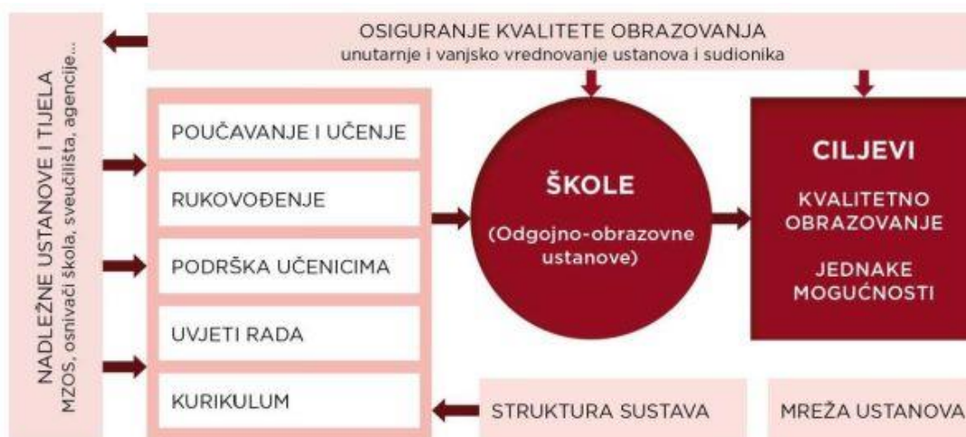
Slika 2-4. Konceptualni okvir Strategije osnovnoškolskog i srednjoškolskog odgoja i obrazovanja

U današnje vrijeme, kad je svijet postao istinsko globalno selo premreženo komunikacijskim vezama koje poništavaju prostorno-vremenske, kulturno-povijesne i gospodarsko-političke različitosti, škole organiziraju društveno učenje prema lokalno-globalnim principima. Novi principi organizacije škole počivaju na globalizacijskim zahtjevima za učinkovitim pedagoškim standardima, koji omogućuju cjeloživotno učenje. Tradicionalnim vrijednosnim sustavima, koji su do jučer održavali različite obrasce životnih sredina, sve više nameće globalno prihvatljiv standard obrazovanja. Suvremena škola, da bi odgovorila zahtjevima koji se pred nju postavljaju, svojom organizacijom treba slijediti svjetsku mrežu kulturnih, političkih i gospodarskih odnosa. Donošenjem Strategije osnovnoškolskog i srednjoškolskog odgoja i obrazovanja specifičan fokus stavlja se na unapređivanje rada odgojno-obrazovnih ustanova. Slika 2. prikazuje konceptualni okvir Strategije kao nositelja odgojno-obrazovnih procesa i pokretača razvoja ljudskih potencijala. Ovaj model uključuje čimbenike koji najviše određuju kvalitetu odgoja i obrazovanja i jednake mogućnosti za svu djecu i sve učenike. 3