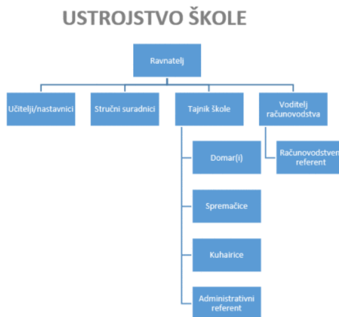
Slika 2-1. Ustrojstvo škole 1

Teorijska istraživanja o organizaciji rada i društva, prije svega su povezana s nastojanjem da se povećaju proizvodni učinci u ljudskom društvu. Teorija organizacije svoj nastanak i razvoj uglavnom temelji na istraživanju procesa rada u poduzećima a modeli tako nastalih ekonomskih teorija organizacije prenose se u druga područja ljudske djelatnosti – primjerice školstvo.