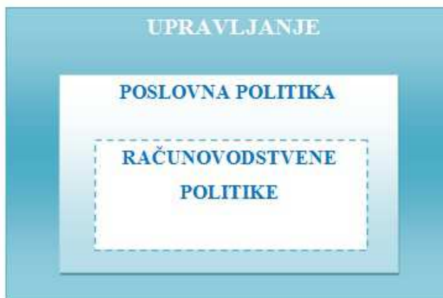
Slika 2. Odnos računovodstvenih politika, poslovne politike i upravljanja

U teoriji ne postoji jednoznačan stav o procesu upravljanja i poslovnoj politici, neki teoretičari ta dva pojma poistovjećuju, dok drugi smatraju da postoje prevelike razlike između ta dva pojma. No najčešće se smatra da je poslovna politika dio procesa upravljanja. Upravljanje je moguće na tri razine: strateškoj (najviša razina), taktičkoj (srednja razina) i operativnoj (najniža razina). Neovisno o razini upravljanja, za svaki proces upravljanja su potrebne informacije. Te informacije većinom nastaju u računovodstvu, što je i razlog zašto se računovodstvo smatra servisom, odnosno uslužnom funkcijom u procesu upravljanja. Možemo računovodstvo usporediti sa strojem koji kao ulaz dobije sirovinu (financijske transakcije i podatke), a u konačnici daje proizvod za upotrebu (informacija potrebna za donošenje odluka i upravljanje). Svaka informacija koju menadžeri koriste da bi donijeli odluke mora biti objektivna i realna, a u tome važnu ulogu imaju računovodstvene politike, kojima se može svjesno utjecati na određene vrijednosti pozicija financijskog izvještaja. Odabir određenih računovodstvenih politika, i njihovih metoda, kratkoročno utječe na poslovni rezultat, odnosno financijski položaj i uspješnost poslovanja. Računovodstvena politika je podskup poslovne politike i njezini ciljevi moraju biti usklađeni sa ciljevima poslovne politike. Odnos računovodstvenih politika, poslovne politike i upravljanja prikazuje Slika 2. 16