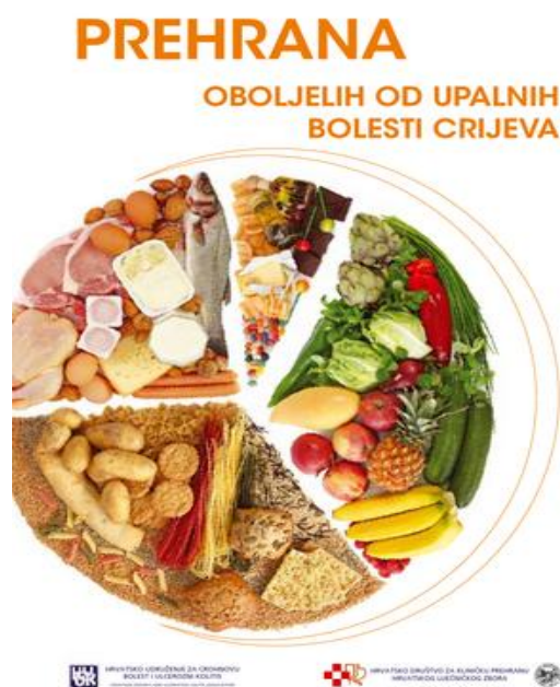
Slika 2.9.1. Prehrana oboljelih od upalnih bolesti crijeva

U slučajevima kada je crijevo suženo na jednom ili više mjesta oboljelom se ne preporuča konzumacija teško probavljive hrane poput žilavog mesa, plodine i sjemenke, vlaknasto povrće, sirove naranče i ostalu hranu koja se ne može dobro sažvakati nego se guta u komadićima. Komadići hrane ili čak preobilan obrok mogu napraviti opstrukciju (privremeno začepljenje) na mjestima gdje se nalazi suženje, pa onda dolazi do grčeva, napuhavanja i pojačanih zvukova u trbuhu. Oboljeli čija crijeva zbog jake upale ili skraćenog crijeva uslijed kirurškog zahvata ne apsorbiraju hranjive tvari, imat će manje proljeva ako smanje unos masnoća u organizam. Dodaci prehrani bit će ponekad potrebni kako bi nadomjestili nedostatak vitamina i minerala uzrokovan slabim apetitom, slabom prehranom, malapsorpcijom kao posljedicom bolesti ili proljevima. [17]