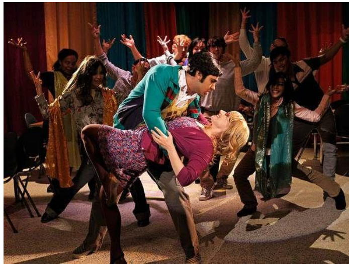
Slika 1. „The Thespian Catalyst“/„Glumački ispušni ventil“

Već u prvoj epizodi serije možemo svjedočiti rasističkim elementima kada se pojavi Penny, lijepa i mlada susjeda Leonarda i Sheldona, koja se obrati Raju, on joj ne odgovori, a njezina reakcija je: „Oprosti, govoriš li engleski?“ Ovu problematičnu pretpostavku pogoršava i činjenica da je njegov najbolji prijatelj Howard odmah uskočio objasnivši Penny kako joj Raj ne može odgovoriti iz razloga što je „štreber“. Čak i s djevojkama koje se u seriji smatraju „manje privlačnima“ kao što je Howardova djevojka Bernadette, Raj ne može komunicirati bez pomoći alkohola osim ako nije u snu kao što je prikazano u epizodi „The Thespian Catalyst“/„Glumački ispušni ventil“, u kojoj Raj sanja ljubavni mjuzikl u kojemu izvodi ples i pjesmu za Bernadette.