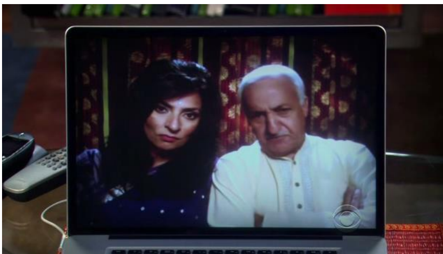
Slika 3. Rajevi roditelji

Rajevi roditelji u seriji su prikazani samo preko videopoziva te gledatelji nisu upoznati s njihovim imenima. U pozadini zaslona uvijek možemo vidjeti zastore koji odišu indijskim stilom dok su roditelji odjeveni u tradicionalnu indijsku odjeću. Gospodin i gospođa Koothrappali, u skladu sa svojim indijskim običajima, žele da njihov sin oženi Indijku i to po njihovom izboru. Usprkos tome, Raj želi sam pronaći ljubav svog života, iako mu to ne ide od ruke. U epizodi „The Grasshopper Experiment“/„Pokus sa skakavcem“, roditelji ga pošalju na „slijepi spoj“ s Indijkom u nadi da će se vjenčati. Nakon što je počeo gubiti nadu u ljubav, pristane na spoj, ali se ubrzo razočara. Naime, Indijka je pristala na spoj samo zato da prikrije svojim roditeljima činjenicu da ona zapravo voli žene. U epizodi „The Wiggly Finger Catalyst“/„Ispušni ventil vijugavog prsta“ saznali smo da su Koothrappaliji veoma bogati, Sheldon ih je nazvao bogatima kao „Richie Rich“ referirajući na dječji film o obitelji milijardera. Rajevi roditelji spominju također kako su veoma bogati u veoma siromašnoj zemlji te se stoga nemaju na što žaliti. S ostatkom Rajeve obitelji nismo upoznati, ali bitno je spomenuti još Rajevog rođaka Venkatesha koji se pojavio u epizodi „The Precious Fragmentation“/„Dragocjeno usitnjavanje“. Venkatesh radi kao odvjetnik u Mumbaiju pa ga je Raj htio angažirati, ali je ubrzo odustao od toga kada je vidio kako ima slabe pregovaračke sposobnosti.