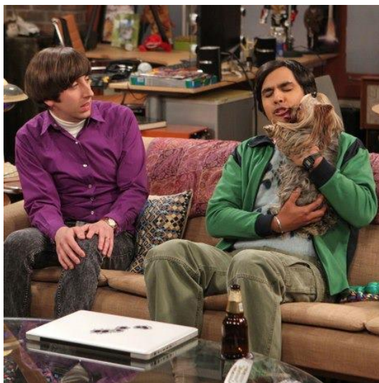
Slika 4. Cinnamon sa svojim „tatom Rajom“ i „ujakom Howardom“

Cinamon, Raj se istog trena „zaljubi“ nazvavši je „najslađim jorkširskim terijerom ikad“. U epizodi „The Proton Resurgence“/„Preporod profesora Protona“, Raj ostavi Cinnamon kod Howarda i Bernadette na čuvanje preko noći zato što mora raditi. Cinnamon je doveo u roza kolicima i obratio joj se kao djetetu rekavši kako će ostati kod „ujaka Howarda“ i „tete Bernadette“.