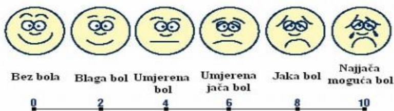
Skala za određivanje jačine bola