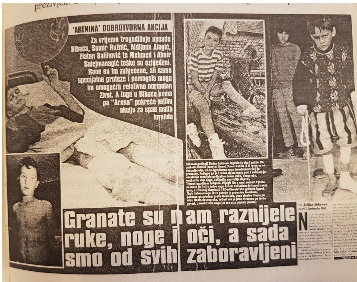
Slika 1. Arenin prilog o stradalnoj djeci u Bihaću

reportaža iz bihaćke bolnice koja prikazuje sudbinu nekolicine djece koja već mjesecima tamo leže, teško ranjena u trogodišnjoj opsadi toga grada. Željela se napraviti potresna priča koja bi zorno prikazala patnje kroz koje prolaze djeca osakaćenih udova, u nadi da će se prikupiti humanitarna pomoć za kupnju protetskih pomagala, odnosno da će im se omogućiti liječenje u kvalitetnijim uvjetima od onih koji su im tada mogli biti pruženi. U nekom trenutku jedan od dječaka povikao je fotoreporterima i novinarima da mu je dosta slikanja, da mu je dosta svega i da to ne želi. Bez obzira na to, slike su objavljene, prikupljena su potrebna financijska sredstva i djeca su zaista otputovala dalje na liječenje. Međutim, ovaj konkretan slučaj, kao i mnogi drugi, nameće etičku dvojbu – jesu li cilj ove akcije i sredstva koja su na putu ka tom cilju korištena, opravdali kršenje prava na privatnost tog dječaka? Jednako tako postavlja se pitanje nije li opisivanjem teške patnje kroz koju su djeca prolazila sekundarna viktimizacija istih? Nisu li se radi toga obnovile patnje i sjećanja ranjenih? Činjenica jest da se na osnovi sočno ispričanih događaja prikupila pomoć od koje su stradali itekako imali koristi. Bi li se isti učinak postigao i da nisu objavljene eksplicitne fotografije iz bolničkih kreveta ili barem da im se u potpunosti zaštitio identitet? (Slika 1)