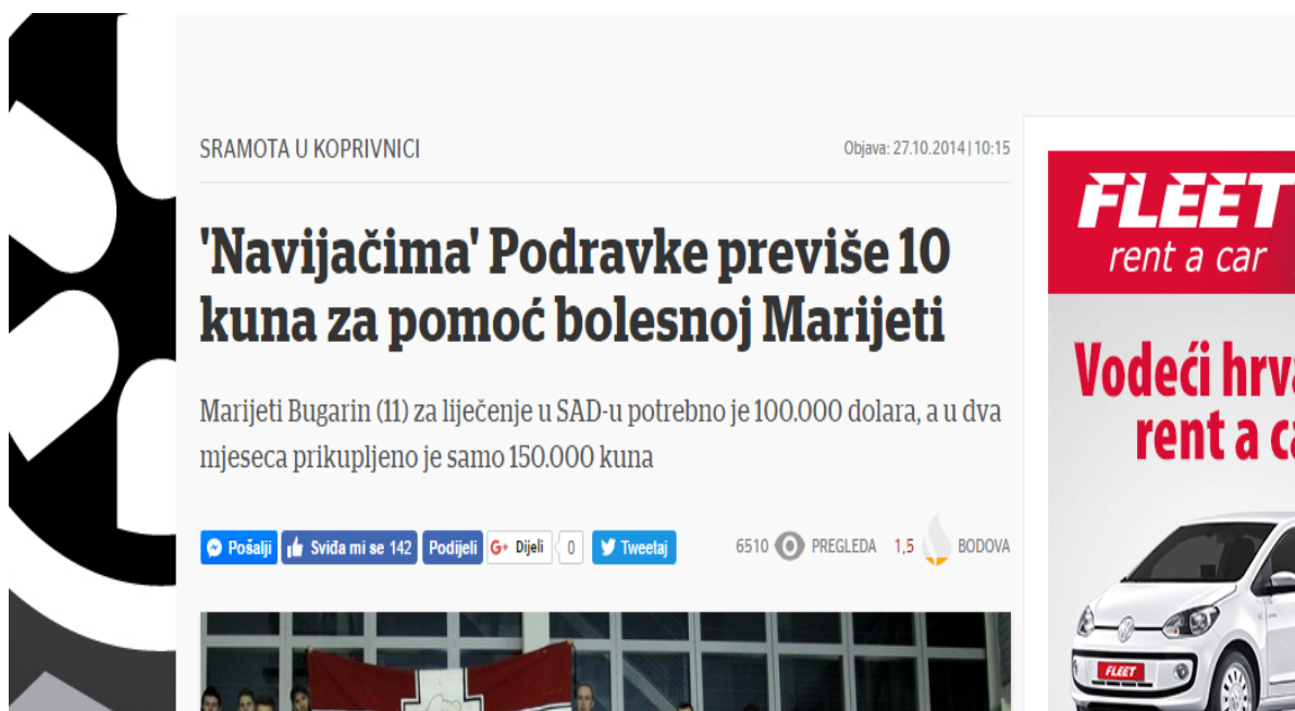
Slika 3. Primjer nadnaslova na portalu Vecernji.hr

Naslovi većine članaka su informativni, tek poneki s elementima senzacionalizma (primjerice, već spomenuti naslov: „Navijačima“ Podravke previše 10 kuna za pomoć bolesnoj Marijeti“). Primjerene su dužine, uglavnom jedna informacija dana u jednoj rečenici. Tek u dva naslova 55 objavljene su dvije informacije odijeljene zarezom, odnosno dvotočkom. Podnaslovi su jednako tako u velikoj mjeri informativni, ali ne senzibiliziraju javnost. Tek kod malog broja uočeni su elementi senzacionalizma. Primjerice, „Veliki igrači“ su se manje-više oglušili na pozive Udruge (...)“ 56 ili „Marijetina majka prijavila udrugu, a u udruzi tvrde da je ona dobivala novac i trošila ga netransparentno“ 57 . Vecernji.hr u opremi teksta koristi međunaslove, kratke i efektne koji senzibiliziraju javnost na humanitarnu akciju, primjerice „Pomozite!“ ili „Jedina u