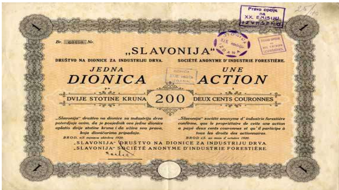
Slika 3.4 prikazuje dionicu "Slavonije" društva na dionice za industriju drva Brod na Savi, 1920 g.