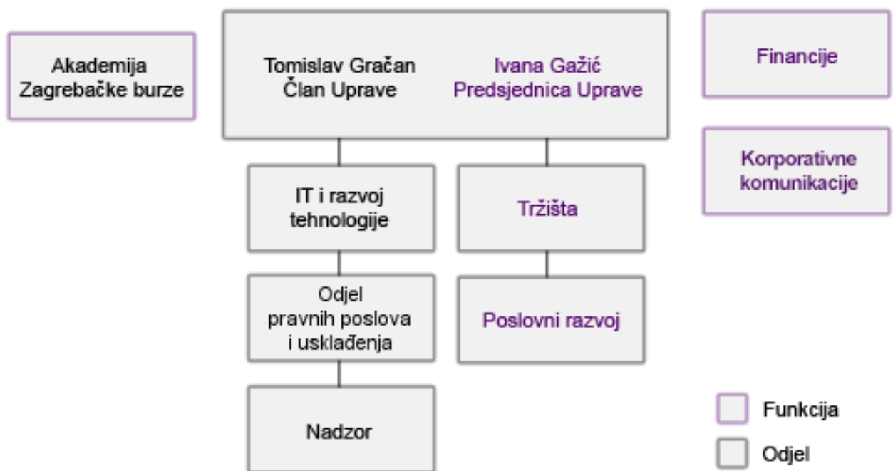
Slika 2.1 prikazuje organizaciju Zagrebačke burze (ZSE)

Burzovni poslovi neizbježno dovode do sporova između kupaca i prodavatelja, pa stoga burze imaju i vlastite arbitražne sudove čiji je zadatak da brzo i efikasno rješavaju nastale sporove kako oni ne bi usporili i zakomplicirali burzovno poslovanje.