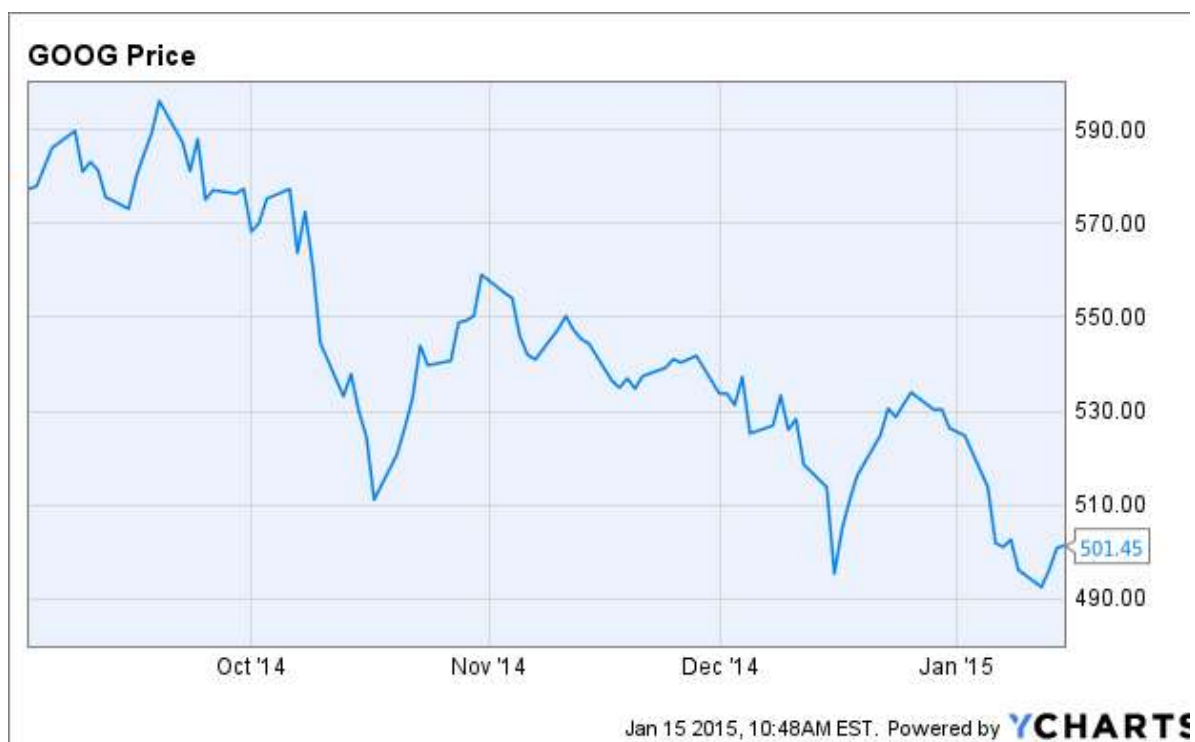
Slika 3.5 prikazuje vrijednost Googla tijekom protekle godine (kretanje dnevnih tečajeva)