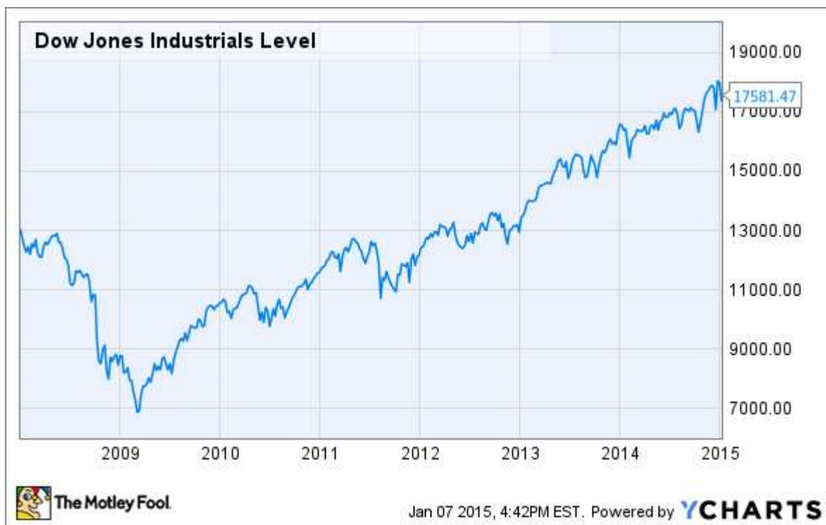
Slika 3.1 prikazuje kretanje burzovnih indeksa na burzi vrijednosnica u New Yorku: Dow Jones