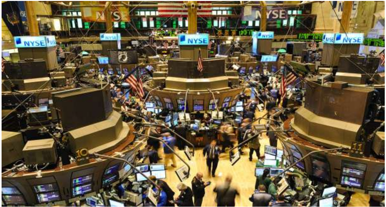
Slika 6.1 New York Stock Exchange

Izvor: http://globalriskinsights.com/2014/01/are-u-s-financial-markets-overheating-again/