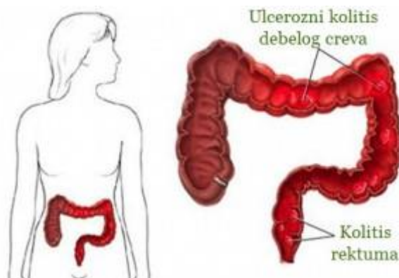
Slika 3.1.1.. Prikaz zahvaćenosti sluznice u ulceroznom kolitisu,

Ulcerozni kolitis karakterizira kontinuirana kronična upala sluznice rektuma i kolona s kliničkim tijekom obilježenim razdobljima remisije i relapsa bolesti. Navedenu bolest prvi put je opisao Sir Samuel Wilks 1859. godine. Različiti termini se koriste za opisivanja stupnja zahvaćenosti debelog crijeva. Ulcerozni proktitis je naziv za bolest ograničenu na rektum. Distalni kolitis ili proktosigmoiditis je naziv za proširenost do sredine sigme, obično unutar dosega savitljivog optičkog instrumenta sigmoidoskopa. Ljevostrani ulcerozni kolitis definira se kao bolest proširena na dio debelog crijeva najbliži slezeni. Pankolitis je naziv za proces koji se širi iza slezenskog zavoja, čak i ako pacijenti nemaju upalni proces u slijepom crijevu (cekumu) [1]. U djece je pankolitis češći nego u odraslih, što međutim ne mora značiti i lošiju prognozu od one lokaliziranih oblika. Ulcerozni kolitis javlja se u dojenčadi i male djece, ali najčešće započinje u dobi od 15 do 20 godine, no također je moguće oboljeti i u svakoj drugoj životnoj dobi. S obzirom da je klinička slika izrazito varijabilna, vrlo je važno definirati aktivnost bolesti, posebice jer o tome uvelike ovisi terapijski pristup [5]. U nastavku je prikazana slika zahvaćenosti sluznice kod ulceroznog kolitisa (slika 3.1.1.).