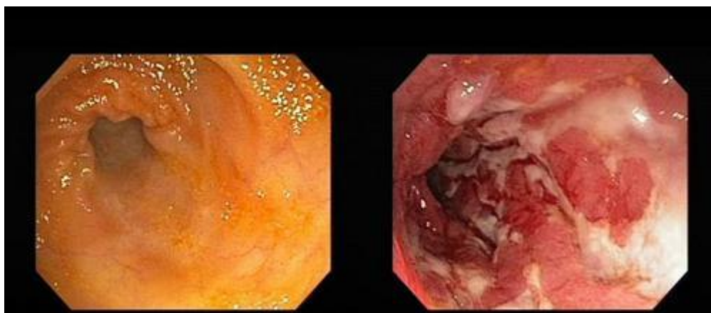
Slika 2.1. Prikaz endoskopije tankog crijeva – na prvoj slici je prikaz zdravog tankog crijeva, a na drugoj slici tanko crijevo zahvaćeno Crohnovom bolešću

Između 1920-tih i 1930-tih sve veći broj mladih odraslih osoba javljao se liječnicima sa simptomima koji su naličili upali crvuljka: grčevitim bolovima, vrućicom, proljevima i gubitkom tjelesne mase [6]. Crohn je ovu bolest sa svojim suradnicima prvi put opisao 1932. godine kao kroničnu upalnu bolest terminalnog ileuma. Kasnije su Crohn, Ginzburg i Oppenheimer opisali regionalni enteritis, što je i danas sinonim Crohnove bolesti, kao bolesti koja može zahvatiti sve dijelove digestivne cijevi od usta do anusa, pa čak tkiva iznad želučano – crijevnog trakta kao što su koža i zglobovi. Od šezdesetih godina definirani su klinički, endoskopski, radiološki i patološki kriteriji za dijagnozu Crohnove bolesti [7]. Kod liječenja Crohnove bolesti se uglavnom pristupa na individualni način, upravo zbog različitih kliničkih manifestacija i endoskopske ekspresije, dijagnostike i terapije. U nastavku se nalazi prikaz izgleda crijeva zahvaćenog Crohnovom bolešću (slika 2.1.) [7].