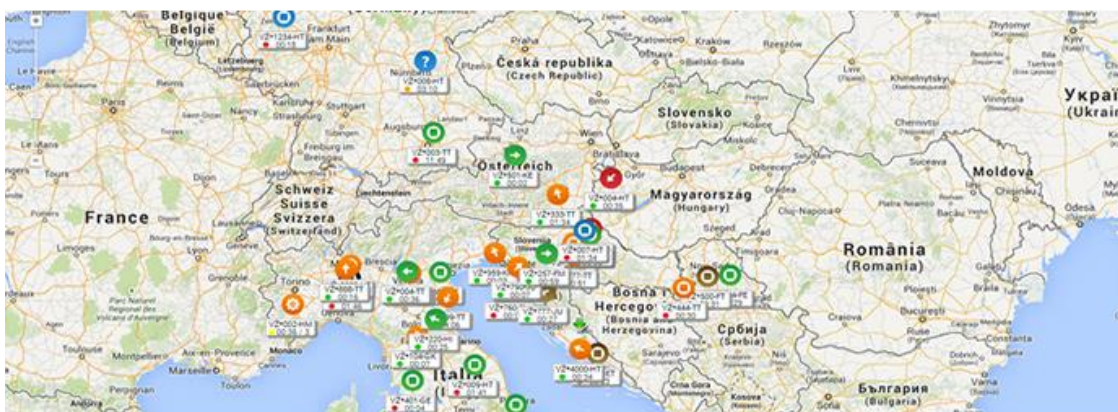
Slika 3. Itinerer kretanja vozila

U planu puta treba uzeti u obzir broj i njegovo dozvoljeno vrijeme upravljanja vozilom. Usputna stajališta za uzimanje goriva i odmor vozača treba unaprijed isplanirati. Preko sustava praćenja, vozač ima mogućnost besplatnog cijelovremenog kontakta sa disponentom vlastite tvrtke, a disponent ima nadzor nad vozilom i teretom. Sustav praćenja omogućuje disponentu cijelovremeni nadzor i kontrolu načina vožnje vučnih vozila. Disponent je u mogućnosti pratiti potrošnju goriva vozila, brzinu kretanja vozila u određenom trenutku, čak i broj naglih pokreta upravljачem vozila kao i naglih usporenja i ubrzanja vozilom.