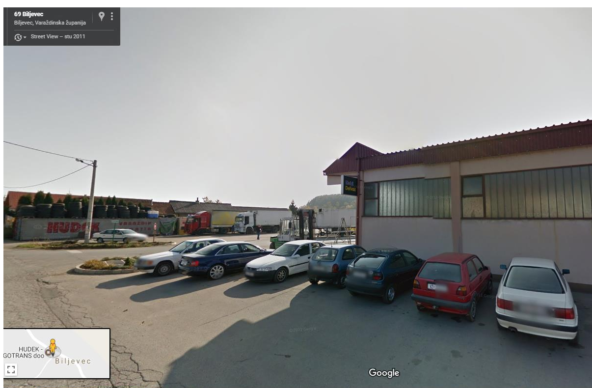
Slika 1. Poduzeće Hudek-Trgotrans d.o.o.

Hudek-Trgotrans d.o.o. (Slika 1.) je tvrtka sa poviješću dugom više od 40 godina, u vlasništvu obitelji Hudek i sa vlastitim voznim kapacitetima. Tvrtka je specijalizirana za cestovni prijevoz robe u međunarodnom i domaćem prometu. Roba koju prevoze osigurana je prijevozničkom odgovornošću. Svako vozilo ima ugrađeno GPS praćenje te stranka u svakom trenu može znati gdje joj se roba nalazi. Prijevoze vrše na relacijama: Hrvatska - Italija – Hrvatska, Hrvatska - Austrija – Hrvatska, Hrvatska - Njemačka – Hrvatska, kao i kroz sve ostale europske države.