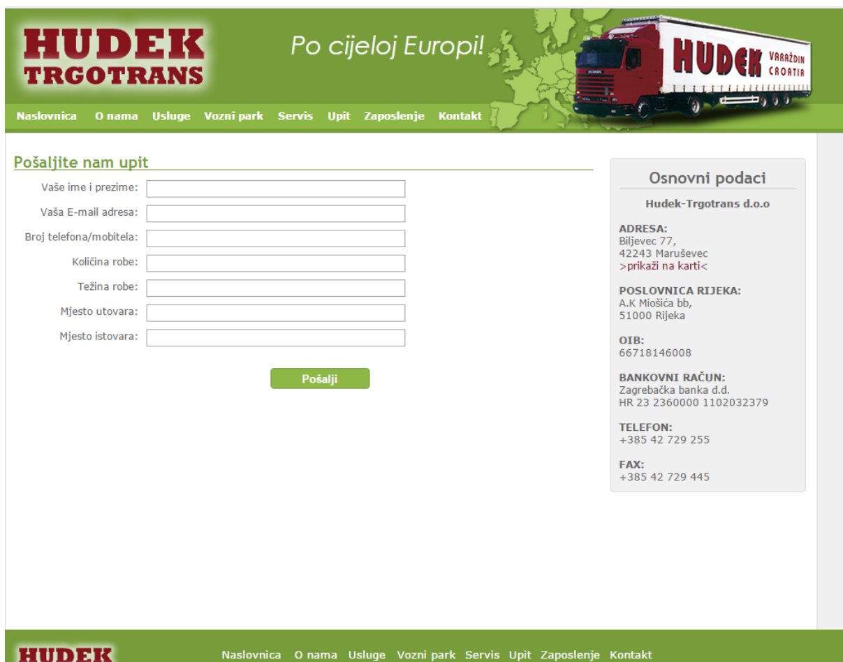
Slika 2. Upit

prijevoza, datum utovara robe i datum istovara, vrstu robe koja se prevozi i u kojoj količini. Obavezni su i podaci o adresi utovara i istovara robe. Naloga za utovar može biti više uz jedan, ovisno o broju različitih lokacija utovara i istovara robe. Problemi koji se javljaju kod preuzimanja narudžbi su nepotpune narudžbe što uzrokuje odbijanje narudžbi kupaca.