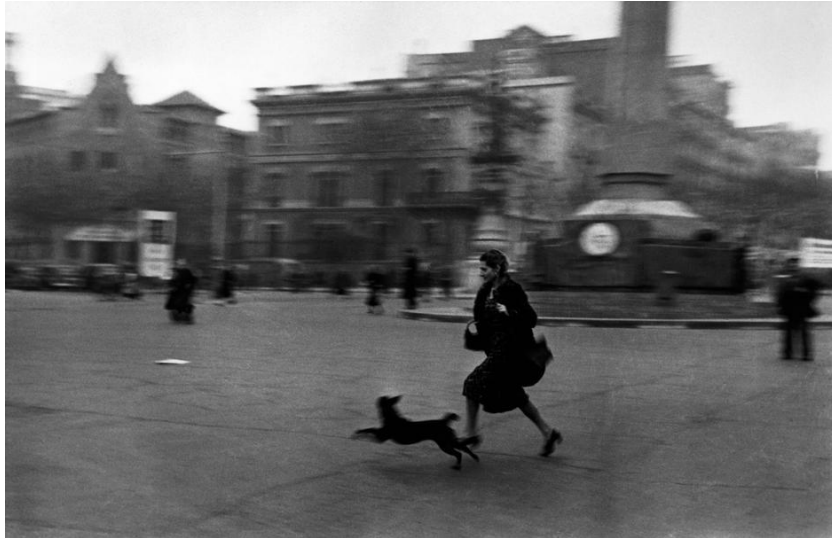
Slika 3.3.: Robert Capa: Bombardiranje u Barceloni, 1938. godina (Izvor: http://www.metmuseum.org/art/collection/search/283315 )

godine Gerda Tara pogiba tijekom bitke za Brunetu, dok Capa ostaje raditi u Španjolskoj kao fotoreporter do 1939. godine. Nakon rata Capa putuje sa fotografom Davidom Seymourom za Kinu prema tadašnjem gradu Hankovu na čijim područjima dokumentiraju japansko- kineski otpor japanskoj agresiji (Drugi kinesko-japanski rat koji je trajao od 1937- 1945.) Svjetsku slavu postiže objavljivanjem fotografije „ Padajućeg vojnika “ koju je napravio u Cerro Murianu na fronti blizu Kordobe 1936. godine. To je jedna od fotografija za koje se smatra da su obilježile razdoblje fotografije 20. stoljeća.