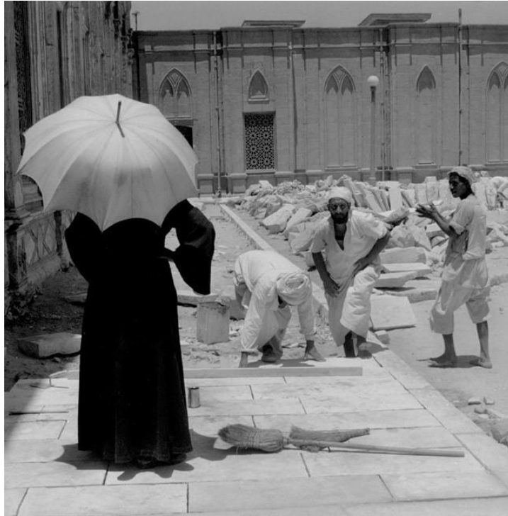
Slika 3.15.: Vivian Maier: Putovanje , 1959.godina, Jemen

Kako je ni najbliži prijatelji nisu uistinu poznavali i mnogi je smatrali Francuskinjom, zbog njezinog francuskog naglaska, Maier je zapravo bila rođena u New Yorku 1. veljače 1926. godine pod imenom Vivian Dorothy Maier. Mladi student se nada kako nije obeščastio autoricu otkrivajući njezine radove, no drugi, bliži prijatelji gospođice Maier tvrde kako ona sigurno nikada ne bi dozvolila da javnost vidi njezin rad. Iz pisma u kojem se obraća svom drugu gospodinu Simonu iz Italije može se jasno iščitati njezina poslovna želja da publicira svoje fotografije talijanskog krajolika u razglednice na finom mat papiru. Vivien također moli gospodina neka joj javi što je odlučio u vezi njezine poslovne ponude uvjeravajući ga da su fotografije odlične i da je toga veoma svjesna. Zašto gospođa Maier nikada nije izašla u javnost sa svojim radovima, ostaje još uvijek zagonetka. Vivian Dorothy Maier umire sama, siromašna i gladna u Chicagu 21.4.2009. godine.