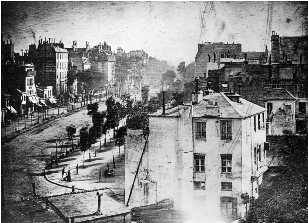
Slika 2.2.: Louis Daguerre: Bulevarhram , 1838. godina (Izvor: https://en.wikipedia.org/wiki/Nic%C3%A9phore_Ni%C3%A9pce )

i formu postavile su ga jednim od ključnih autora ulične fotografije koji je svojim stilom utjecao na mnoge druge europske i američke fotografe. John Thomson također dokumentira London u 1870-im godinama čineći zarobljavanje svakodnevnog života na ulicama, što također daje poticajnu ulogu u širenju novih mladih autora ulične fotografije u Europi. Uz Bressona, oca ulične fotografije, bitno je napomenuti važnost njegovog suvremenika Brassaija koji je u svojoj foto-publikaciji iz 1933. godine pod nazivom „ Pariz noću “ prikazao noćni život Pariza i dijelove sakrivenog gradskog podzemlja. Upravo se ta foto-knjiga smatra među klasicima početka ulične fotografije. Također Henri C. Bresson je u svojoj publikaciji iz 1952. godine „ Slike na Sauvetteu “ zagovarao spontanost i intuiciju kao pokretačku snagu ulične fotografije i tako izložio načela koja su postala mjerilo za buduće generacije. [2]