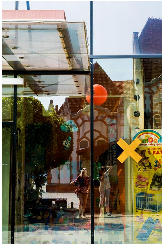
Slika 5.3.8.: . Trgovački centar Međimurka