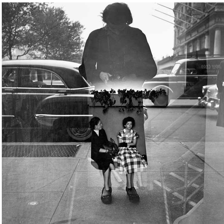
Slika 3.16.: Vivian Maier: Auto-portret , New York, 1954. godina

Autorica jedne od najvećih arhiva fotografija ulice posthumno je otkrivena svjetskoj javnosti koja je oduševljeno prihvatila još jednog američkog vrhunskog fotografa. Pitanje validacije kod brojnih galerija još je upitna, iako njezin rad nesporno govori da se radi o velikom fotografu i autoru američke fotografske povijesti dvadesetog stoljeća. [12]