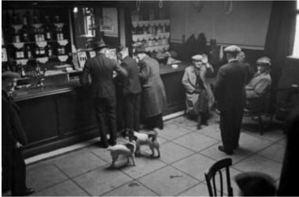
Slika 2.1.: Humphrey Spender: Muškarci se pozdravljaju u krčmi, 1937. godina