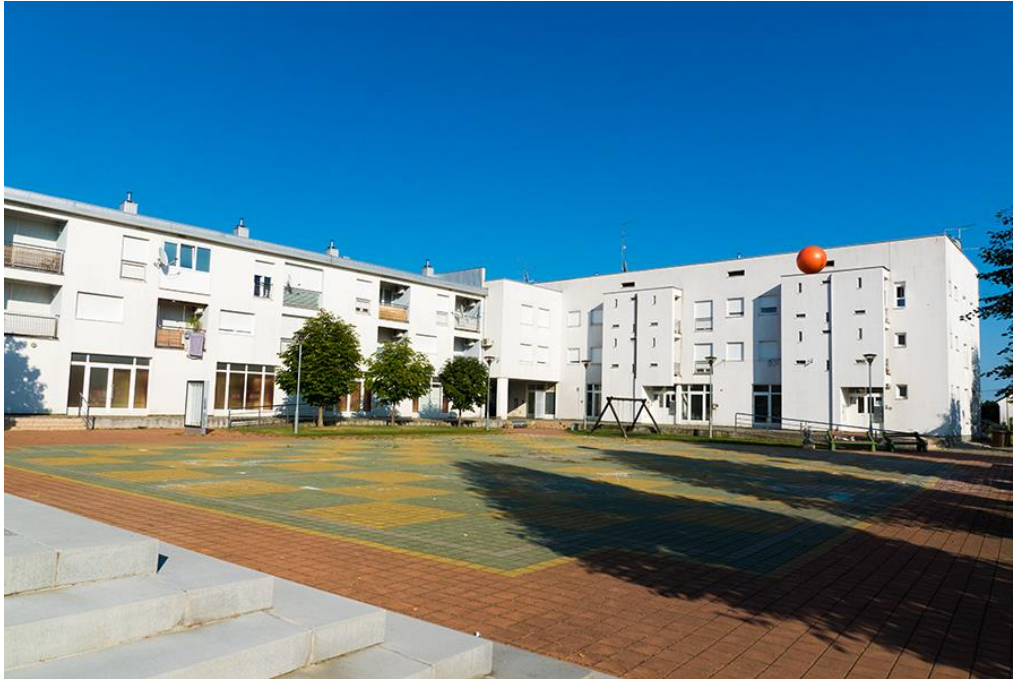
Slika 6.3.3.: Nove zgrade