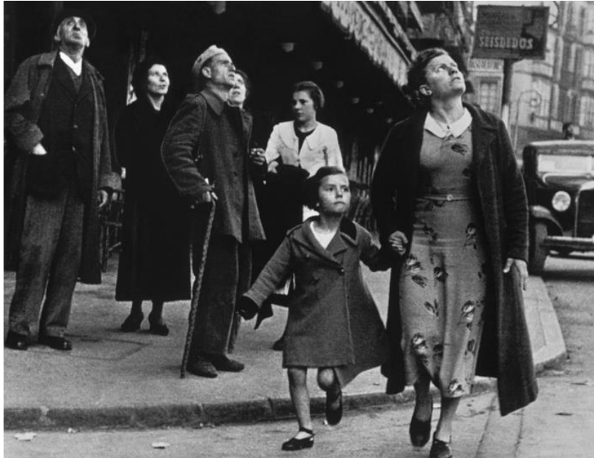
Slika 3.5.: Robert Capa: Žena plače, Španjolska, 1950.godina

onome što se događa i želja da se to preobrazi u vizualno... 1951 godine Capa odlazi u novonastalu mladu državu Izrael i sa oduševljenjem izrađuje mnoge putopisno-dokumentarističke fotografije. Istima se poslužio Irwin Shaw za svoju publikaciju „ Reportaža o Izraelu “. [8]