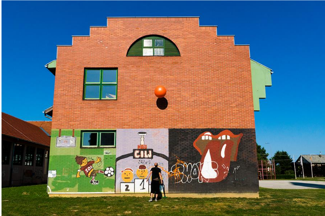
Slika 5.3.11.: Osnovna škola Šenkovec