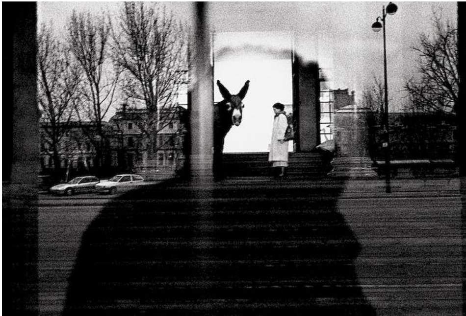
Slika 3.7.: Robert Frank: Pariz, 1924. godina

Frank putuje stalno na relaciji SAD- Europa, tako gradi ogroman opus fotografija ulice, izdaje knjigu „ Fotografije Pariza “ i „ Knjigu Walesa “.