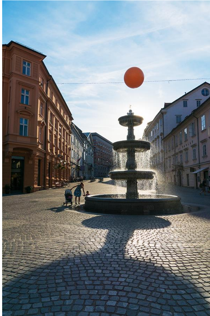
Slika 6.3.2.: Fontana