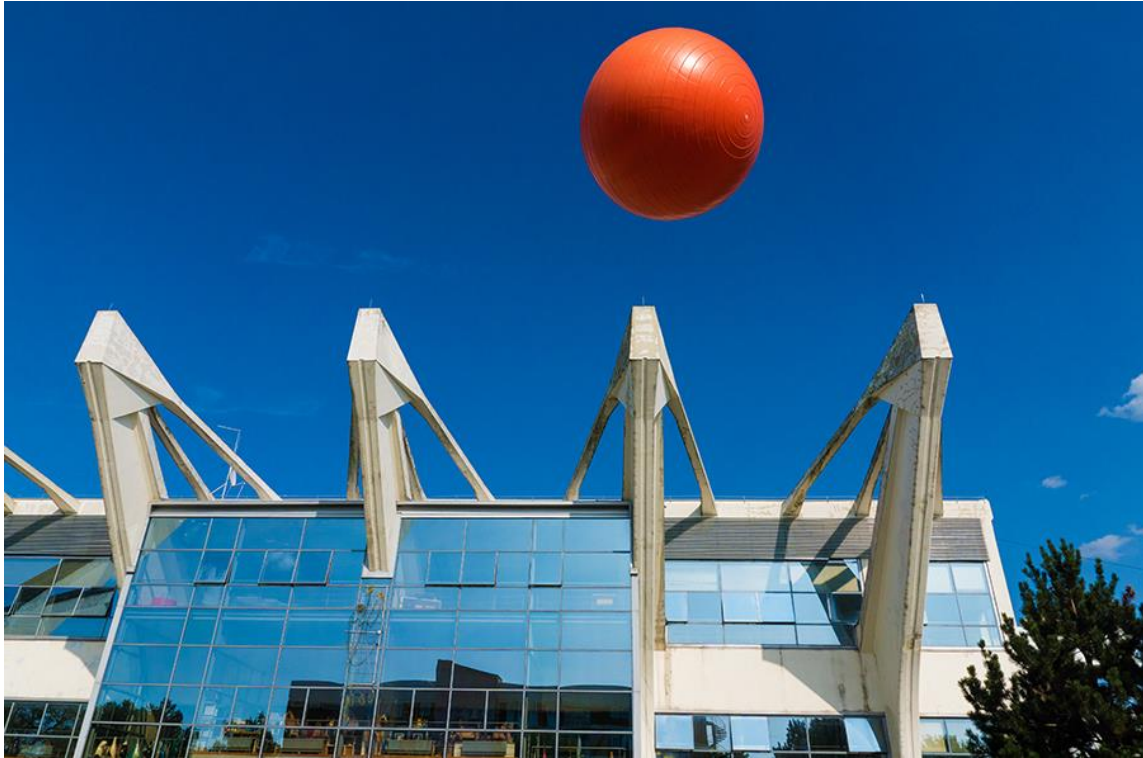
Slika 5.3.12: Graditeljska škola Čakovec