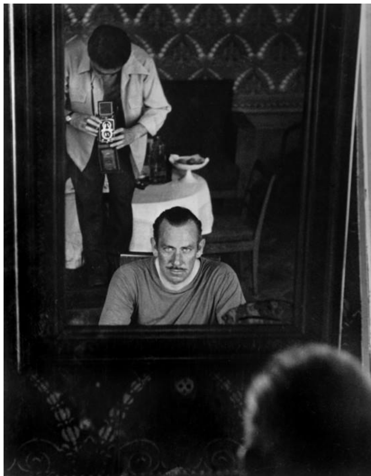
Slika 3.4.: Robert Capa i John Steinbeck, 1947. godina, Moskva

Iznimna predanost poslu i otuđenje u privatnom životu omogućuju Capi da je stalno u pokretu i sa virtuoznom sposobnošću i brzinom kamere bilježi povijesno bitna socijalno-politička zbivanja svog vremena.