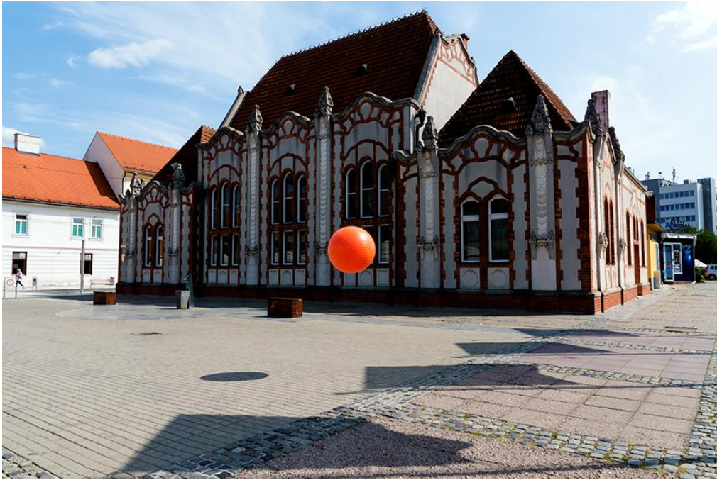
Slika 6.3.5.: Dom sindikata Čakovec