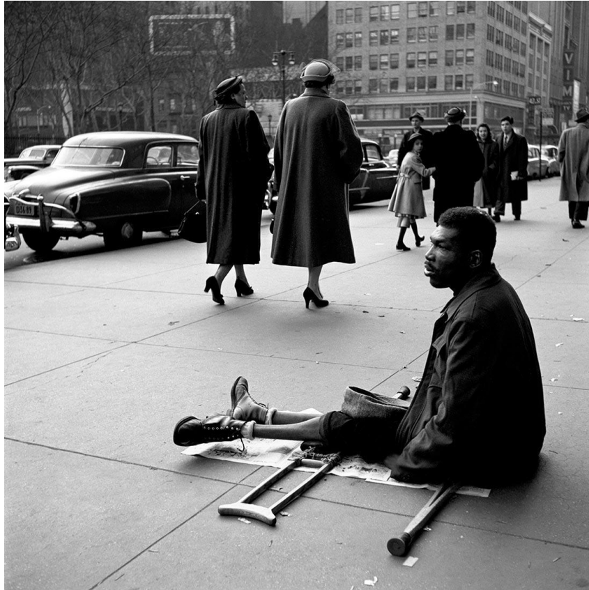
Slika 3.14.: Vivian Maier: Maj, 1955. godina

1959. godine Maier je svom poslodavcu najavila putovanje i povratak za osam mjeseci, i u tom razdoblju prema pronađenim fotografijama i putnim kartama koje je Maier sačuvala bilo je jasno da je proputovala cijelu sjevernu Ameriku, Bankokj, Indiju, Tajland, Egipat i Yemen. Putopisne fotografije gospođice Maier odišu predivnom čistoćom humora i svježeg duha, trenuci u kojima je Maier nakratko uspijevala nagraditi sebe istražiti zemlje i ljude.