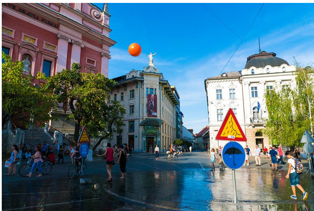
Slika 5.3.7.: Trg