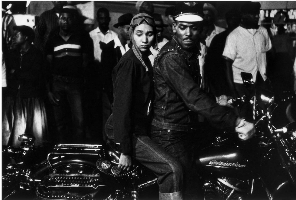
Slika 3.8.: Robert Frank: Indianapolis „Amerikanci“, 1955.godina

uspio snimiti prilikom svog putovanja. Mladi Amerikanci su sa oduševljenjem prihvatili ovu publikaciju, jer je upravo ona pokazivala na rupe i sve nedostatke u vladajućem sistemu. Frank, ljevičar u duši i borac protiv segregacije društva u Americi naglašavao je u svojim radovima na probleme rasizma i iskorištavanje jeftine radne snage pedesetih godina. [9]