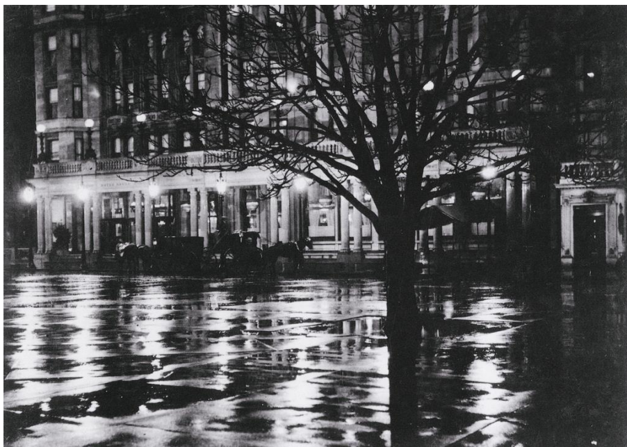
Slika 4.1.: Alfred Stieglitz: Noćne refleksije , New York, 1896.godina