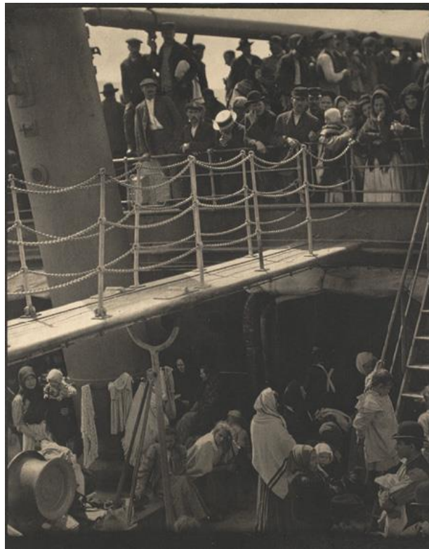
Slika 3.1.: Alfred Stieglitz; Potpalublje, 1907. godina

Stieglitz je surađivao sa svojim prijateljem Clarence H. Whiteom; uzeli su nekoliko desetaka fotografija dvaju odjevenih i golih modela i tiskali fotografije pomoću neobičnih tehnika, uključujući toniranje i crtanje. Po Stieglitzovom mišljenju takva tehnika nadvladala je nemogućnost fotoaparata da radi određene stvari. Na putu u Europu 1907. godine, Stieglitz je na palubi snimio, ne samo njegovu prvu sliku potpisa, već i jednu od najvažnijih fotografija 20. stoljeća- „ Potpalublje “ usmjerivši svoju kameru na putnike nižeg razreda putnika u palubi. Ta jedinstvena slika je bila ujedno i formativni dokument njegova vremena, ali i jedno od prvih djela umjetničkog modernizma.