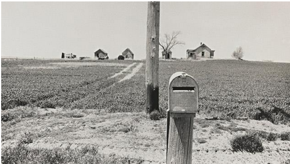
Slika 3.6.: Robert Frank: Amerikanci

Robert Frank, švicarsko-američki fotograf, rođio se u Zürichu 9.9.1924. godine te veoma mlad imigrirao u Ameriku gdje se i proslavio kao jedan od najpoznatijih američkih fotografa u svijetu. Frank je radio za Michaela Wolgensingera i preko njega se upoznao sa švicarskom nakladničkom kućom te je 1946. godine samostalno izradio svoju prvu knjigu fotografija sa tematikom seoskog života u seriji od 40 fotografija. Frank je tijekom svog života samostalno izradio sve ukupno četiri tiskane knjige svojih fotografija. 1947. godine imigrirao je u Ameriku gdje ubrzo počinje raditi kao modni fotograf za časopis „ Harperov Bazar “. Ostavlja taj posao i 1948. godine kreće na svoj put za Peru koji je ostao najpoznatiji po njegovoj velikoj zbirci fotografija- „ Peru “ (1948. g .). Putujući po Peruu, Frank je bio oduševljen ponajviše ljudskim nomadskim i veoma tradicionalnim, skromnim životom stanovnika te je tako više portretirao stanovništvo, nego li fotografirao prirodu ili njihovu kulturu. [9]