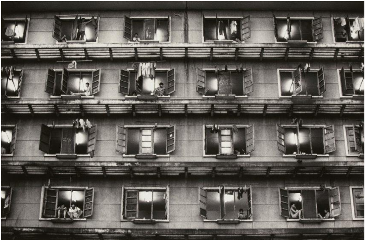
Slika 3.2.: Alfred Stieglitz: Bez naziva, galerija 291 (Izvor: https://commons.wikimedia.org/wiki/File:O%27Keeffe-(hands).jpg )

umjetničkim izložbama, lider u fotografskim i umjetničkim svjetovima, bio je nužno strastven, složen i izrazito kontradiktoran, nadahnjivao je veliku ljubav i veliku mržnju u jednakoj mjeri. Osam od devet najviših cijena ikad naplaćenih na aukciji za Stieglitzove fotografije (od 2008. godine) su one od Georgie O'Keeffea. Najprodavanija je fotografija, „ Georgia O'Keeffe- Ruke “ iz 1919. godine, u veljači 2006. godine na aukciji ostvarila 1,47 milijuna američkih dolara. Na istoj je prodaji „ O'Keeffein Akt “ (1919.g.) prodan za 1,36 milijuna dolara. [6]