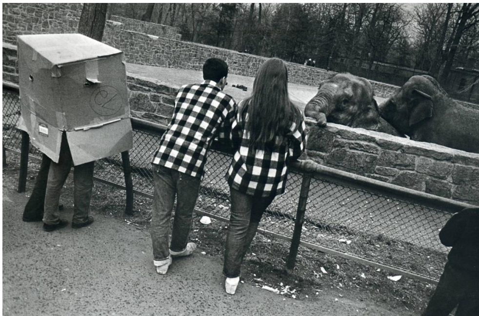
Slika 3.10.: Garry Winogard : publikacija Životinje , New York, 1962. godina

Pod utjecajem europske bresonovske škole, Winogrand je rado hvatao fotoaparatom upravo one odlučujuće trenutke, što je posebno uočljivo u njegovim radovima sredinom 1950-ih godina koje je rado snimao u prestižnom njujorškom noćnom klubu El Morocco. Teoretičari rado uspoređuju njegovu virtuoznost u radu sa kamerom prilikom brzog i gotovo neprimjetnog kadriranja i okidanja svojih glavnih subjekata, sa velikanom Robertom Frankom. [10]