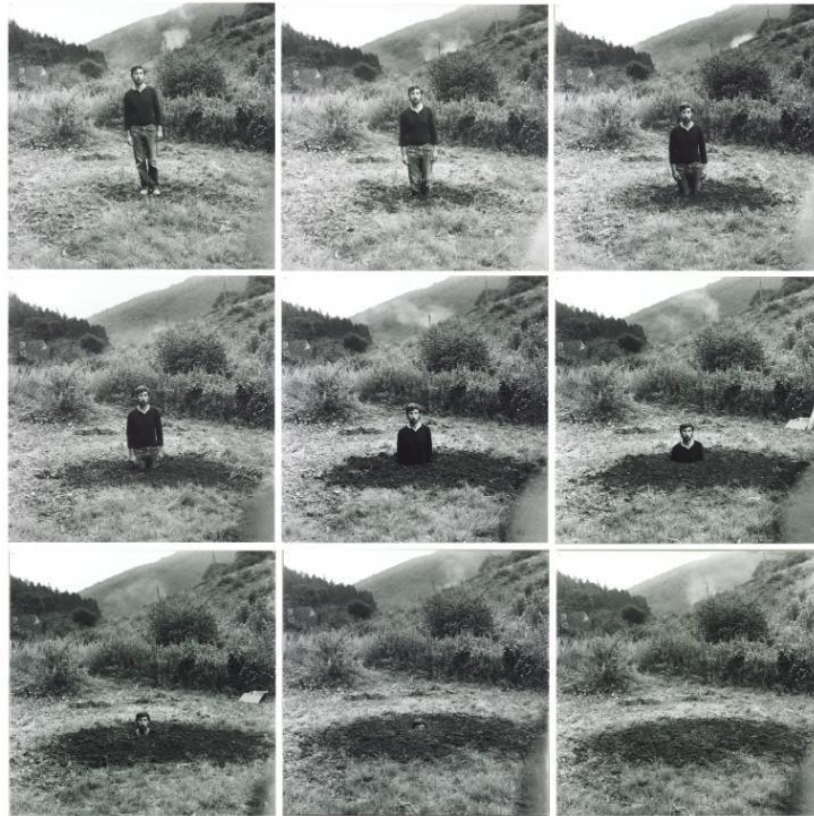
5.1.: Keith Arnatt : serija fotografija, projekt: Samosahranjivanje , 1969.godina