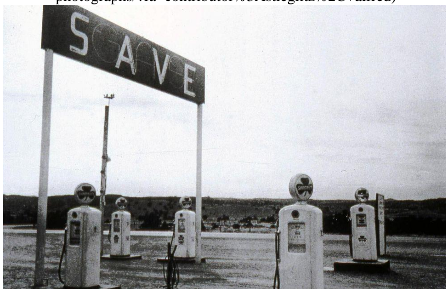
Slika 4.2.: Robert Frank: Amerikanci