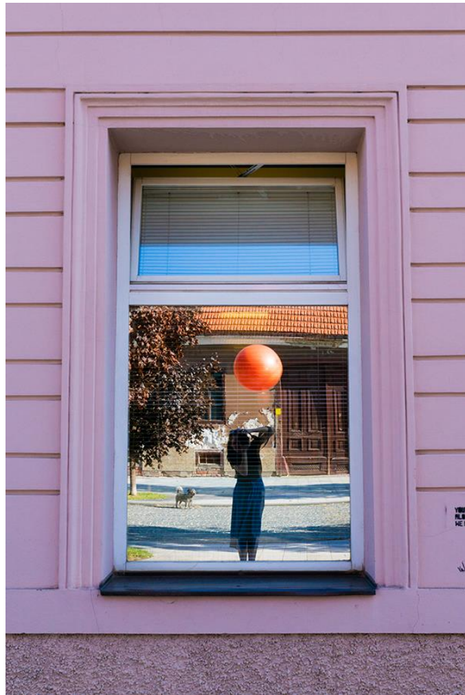
Slika 6.3.4.: HZZO