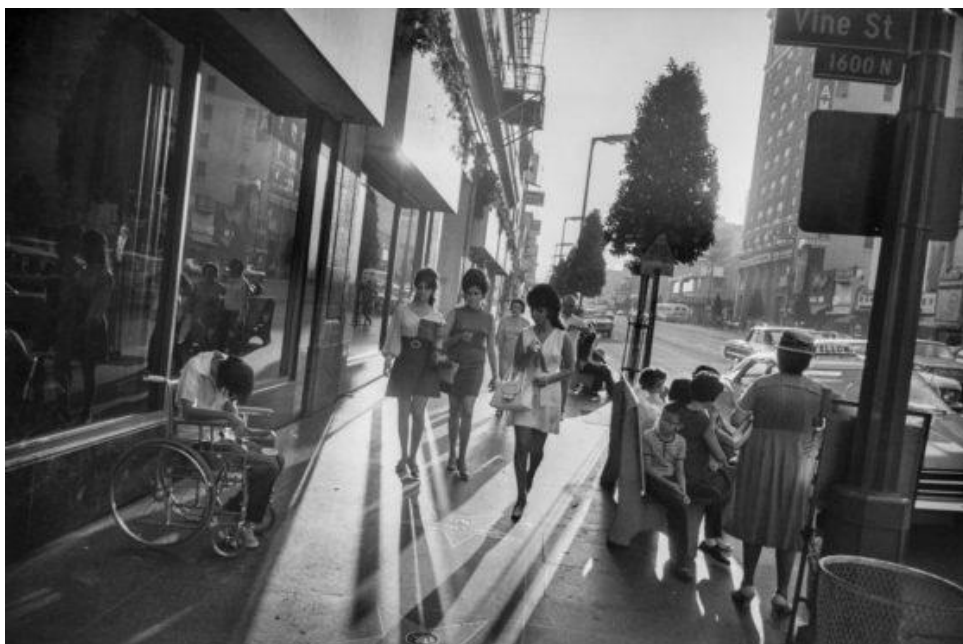
Slika 3.12.: Garry Winogrand: Los Angeles, 1969. godina

Mnogo radova velikana razvijeni su posthumno čiji je broj premašivao brojku od 300 000 još neviđenih te nerazvijenih fotografija. Opus radova sačuvan je u „ Arhivi Garrya Winogranda “ u sklopu „ Centra za kreativnu fotografiju “. Tako su mnoge fotografije Winogranda izložene nakon njegove prerane smrti koja je nastupila 1984. godine. Prozivan egzistencijalnim i modernim fotografom svoje generacije u Americi, Winogrand je svakako zauzeo mjesto genijalca u području fotografije, naglašavajući prolaznost trenutka koji ga je inspirirao najviše od svega uspijevajući naći stalno iznova ono izvanredno u svakodnevnome životu ulice. [11]