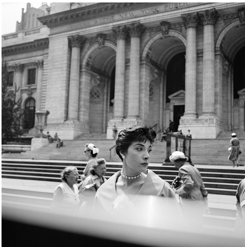
Slika 3.13.: Vivian Maier: New York

Mladi student John Maloof je igrom slučaja, na jednoj od mnogobrojnih aukcija u Chicagu, kupio i jednu kutiju negativa za potrebe izrade svoje povijene knjige uz koju je poželio i nove fotografije starog Chicaga u razdoblju između 1950. i 1970. godine. U nadi da će doći da svog praktičnog materijala, Mallof je shvatio da se pod imenom autorice kutije negativa koje je kupio na aukciji za 380 dolara nalazi veliko fotografsko ime. Gospođica Maier je iz nejasnih razloga cijeli svoj životni vijek provela uglavnom radeći kao dadilja te u svoje slobodno vrijeme i vrijeme koje je provodila sa djecom koju je čuvala u predgrađu Chicaga, fotografirala socijalne i političke situacije koje su se tada zbivale na ulicama velikog i glasnog velegrada.