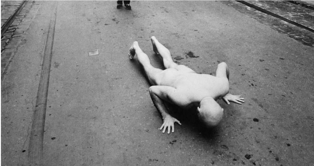
Slika 5.4.: Mio Vesović/ Tomislav Gotovac – „Zagreb, volim te!“ , 1981. godina