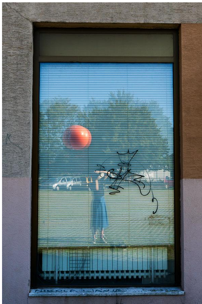
Slika 6.3.1.: Parkiralište