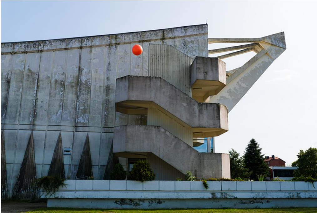
Slika 5.3.9: GOC