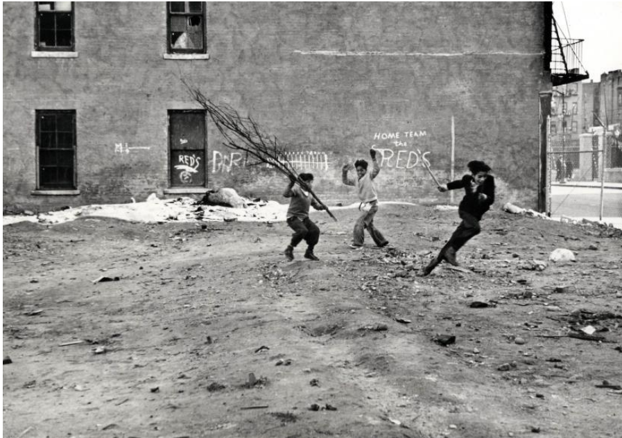
Slika 2.3: Helen Levitt: New York, 1940. godina

udruženja; Teddy Boys, Skinheads i Rock 'n' Roll. Mayneove slike tih sub-kultura koje su se družile oko uličica u Londonu nisu samo pomogle u uspostavi ulične fotografije u Velikoj Britaniji, nego su također igrale ključnu ulogu u generacijskim napetostima koje su izbijale 1960-ih godina. Do kraja sedamdesetih godina, ulična fotografija bila je ugledni medij s bogatom pozadinom i istinskim likovnim oblikom koji se smatrao vrijednim spomena u bilo kojoj knjizi povijesti umjetnosti. [2]