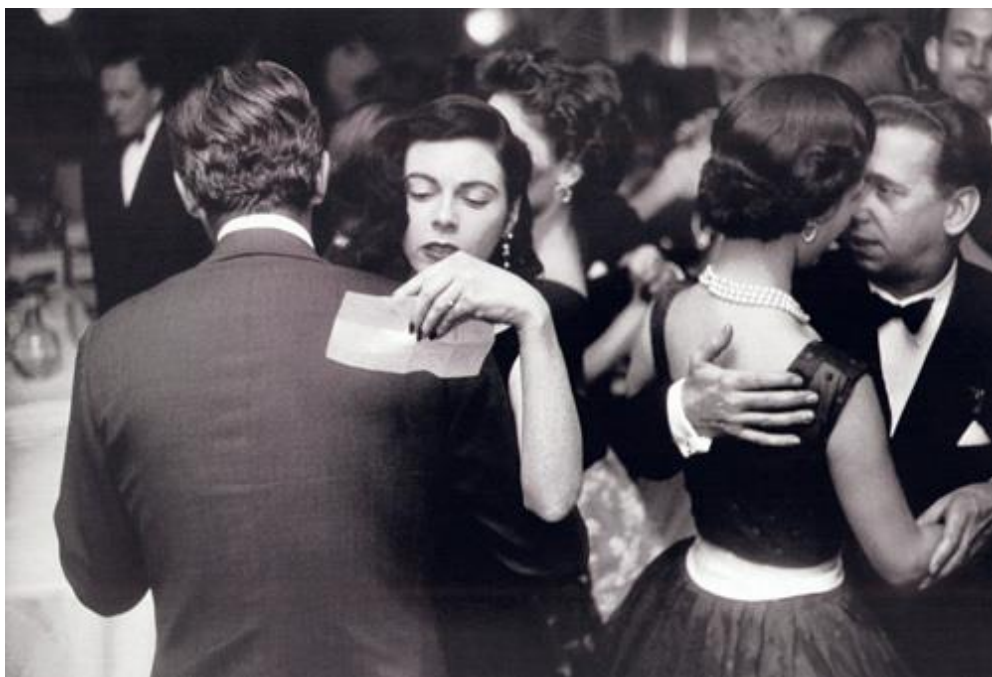
Slika 3.11.: Garry Winogrand: Noćni klub El Morocco, New York, 1955. godina

Poznat po korištenju nagnutog ili nakošenog kadra u fotografiji, kojim je pokušavao dočarati dinamiku i kontrast svojih motiva na fotografiji. Među poznatijim fotografijama Winogranda je ona iz 1969. godine pod nazivom „ Los Angeles “. Fotografija prikazuje ljude na ulici, zvanom Hollywoodska staza slavnih, to jest kako mlade žene iz visokog društva ponosno hodaju ulicom dok ih promatra mali dječak iz crnačke obitelji te invalidni dječak na drugoj strani ulice. Fotografija je zanimljiva u socijalno-političkom kontekstu i bilježi očigledne kontraste modernog američkog društva, dok izbor kadra i izrazite sjene naglašavaju dramatiku opisane scene. [10]