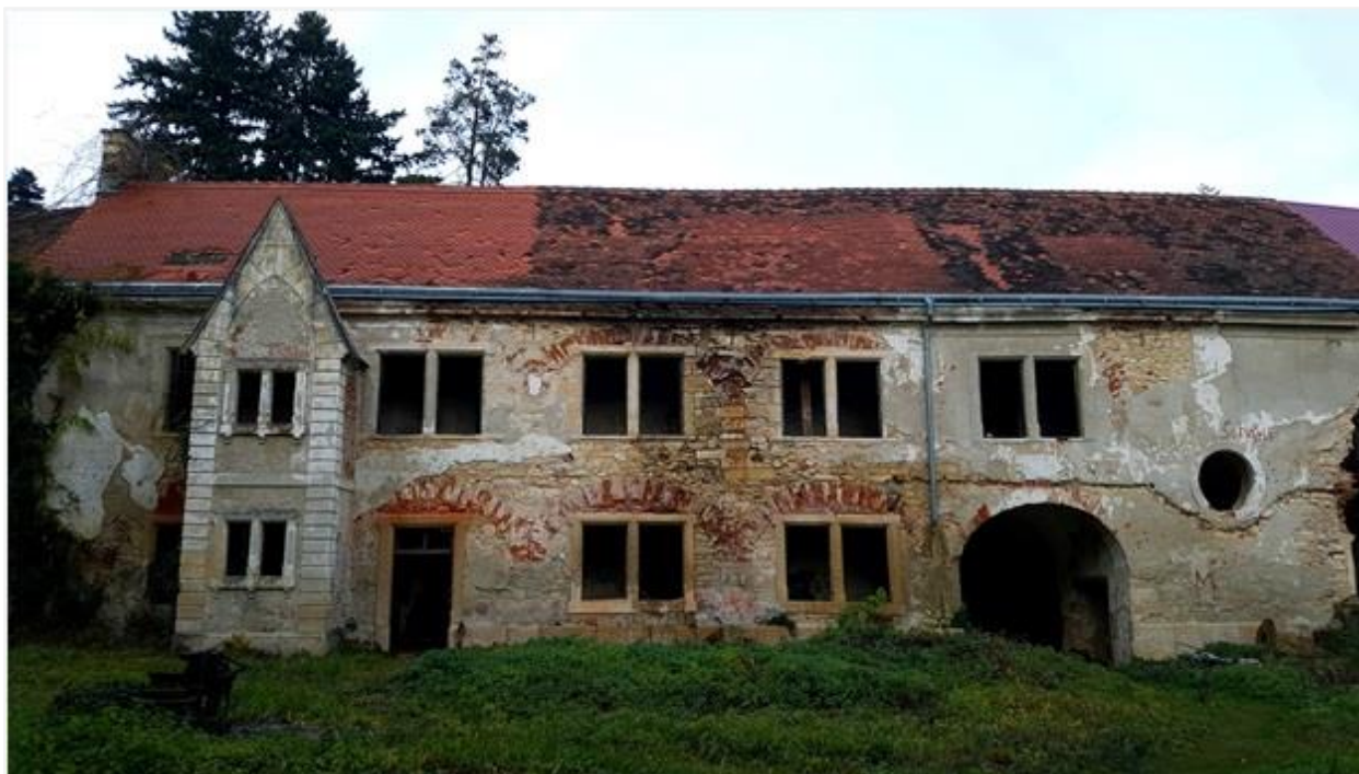
Slika 5.4. Pogled na dvorac s unutrašnjeg dvorišta