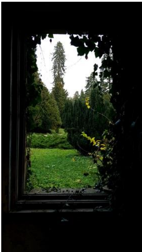
Slika 4.1. Pogled na park s prozora dvorca

Danas je perivoj uz dvorac Opeku nemoguće uspoređivati s ostalim perivojima uz dvorce, jer je to jedinstven primjer vrtne arhitekture koja je nasreću dobro očuvana, a ima najvišu estetsku vrijednost i dendrološku raznolikost kakvu nema nijedan naš perivoj. Stoga perivoj uz dvorac Opeka predstavlja jedinstveni primjer naše parkovne arhitekture ne samo uz dvorce Hrvatskog zagorja već i mnogo šire. Od vrtnog inventara u perivoju očuvano je još nekoliko originalnih kamenih klupa izuzetne ljepote i vrhunskog dizajna 19. st. [5]