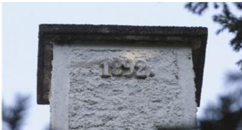
Slika 6.3. Godina 1892. izvedena u žbuci u dimnjaku