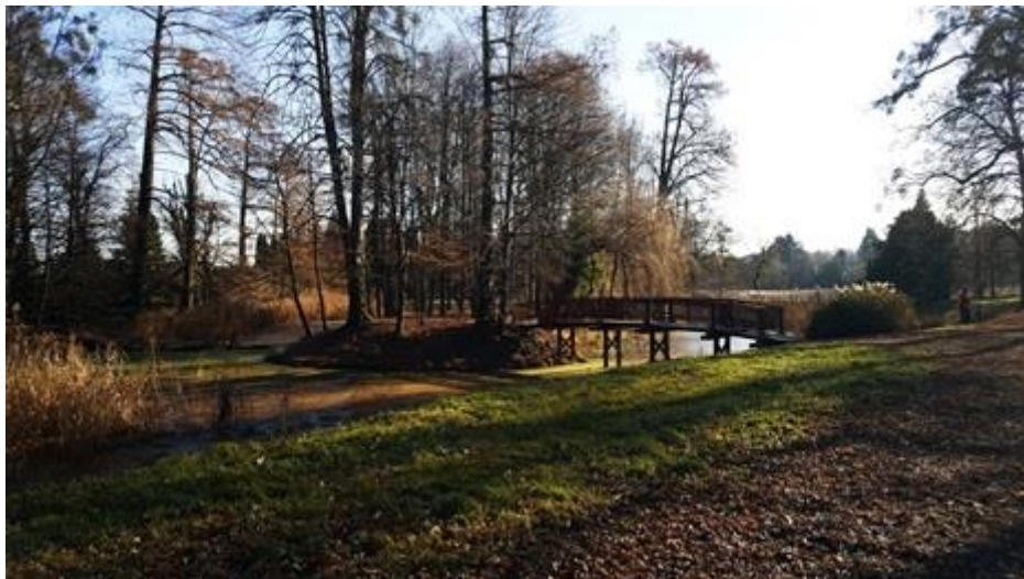
Slika 6.8. Jezero

U donjem dijelu arboretuma postoji malo jezero nastalo vađenjem zemlje za proizvodnju opeke u nekadašnjoj ciglani. U sredini toga jezera nalazi se mali otočić koji mještani zovu otok ljubavi. Pristup otočiću omogućen je drvenim mostom. Prema legendi, ako čovjek prođe preko mosta, a nije zaljubljen, pretvorit će se u žabu.