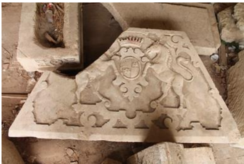
Slika 6.2. Polomljeni grb obitelji Bombelles