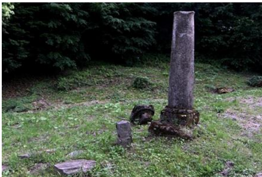
Slika 6.9. Spomenik konju i psu

U arboretumu se također nalazi spomenik psu i konju, jedan uz drugoga. Na psećem spomeniku nalazi se natpis: "Spitz (1867. – 1879.), „Sie war glücklich". Prema natpisu, pas je živio dugo i sretno. Nema mnogo informacija o tim spomenicima, ali pretpostavlja se da ih je dao podići grof Bombelles u čast i sjećanje svojim ljubimcima.