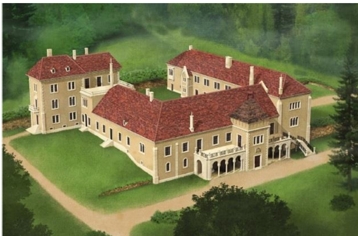
Slika 5.5. 3D vizualizacija dvorca HRZ-a

Europski šumarski institut(European Forest Institute - EFI) je međunarodni znanstveni institut sa sjedištem u Joensuu u Finskoj. Jedan od razvojnih ciljeva EFI-ja je osnivanje regionalnih ureda po Europi. Šumarski institut je u postupku osnivanja pet istraživačkih centara na području cijele Hrvatske, a planira se da jedan bude baš u Varaždinskoj županiji. [3]