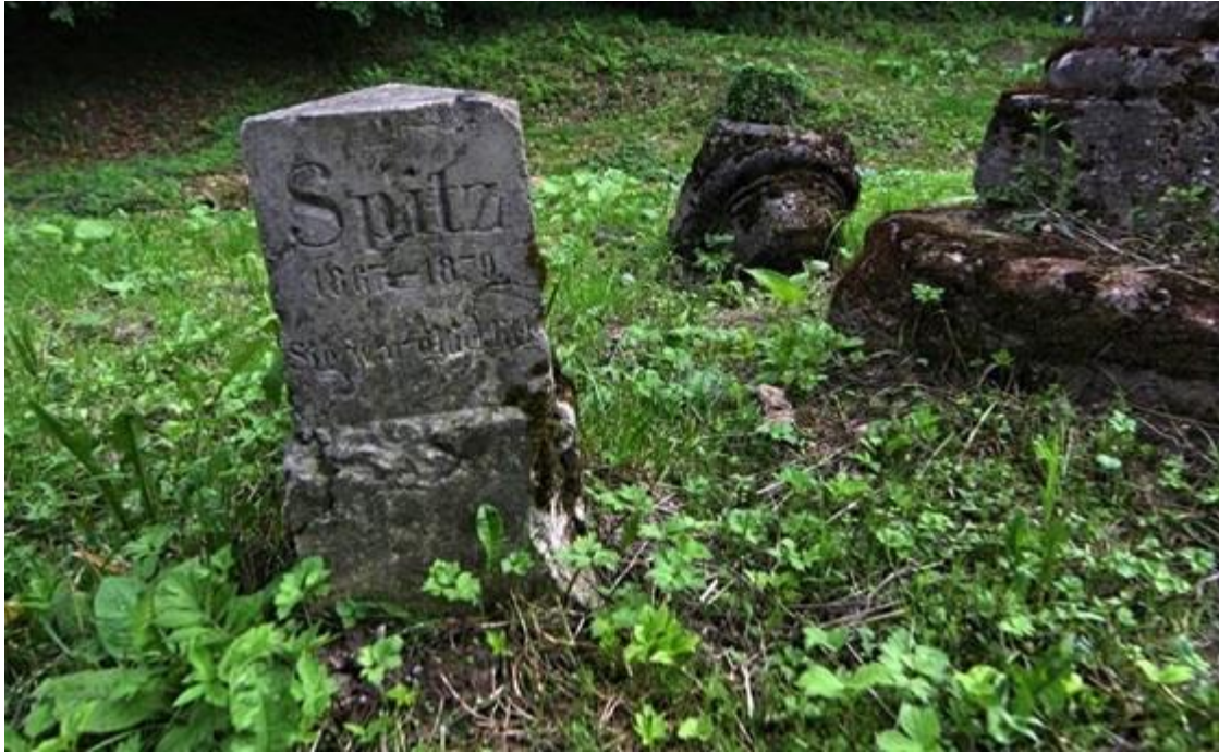
Slika 6.10. Spomenik psu s natpisom: „Sie war glücklich“