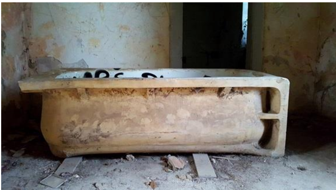
Slika 5.2. Kada ostavljena u dvorcu Opeka