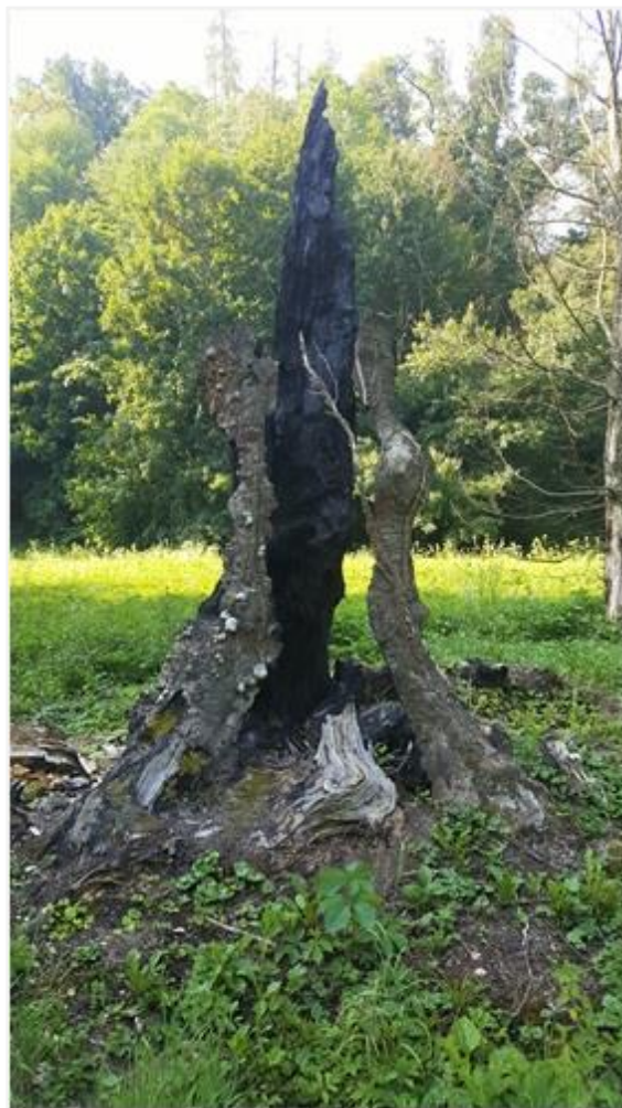
Slika 4.2. Spomenik munji