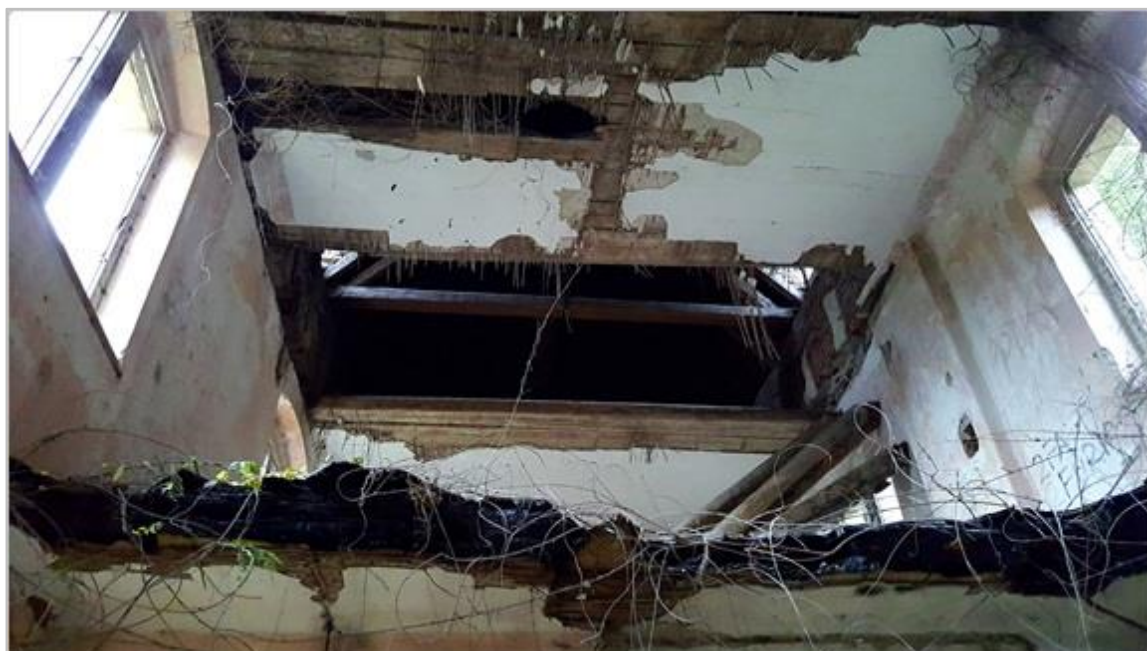
Slika 5.3. Spaljeni stropovi u dvorcu Opeka