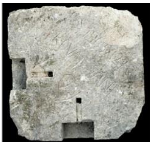
Slika 6.4. Potpis klesara s datacijom na kamenom stupiću terase aneksa: 1905., Kovač Jani