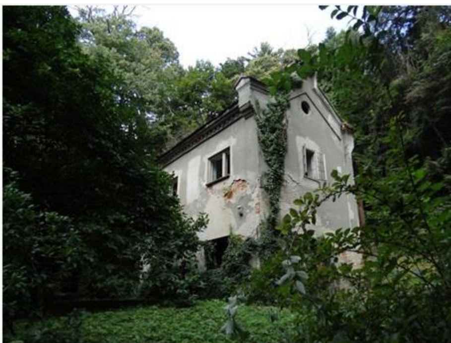
Slika 6.5. Kuća za sluge

Kuća za sluge je još jedan objekt u parku kojeg je pojeo zub vremena. Kao što i samo ime govori, to je kuća u kojoj je živjela posluga grofovskih obitelji. Nalazi se oko stotinjak metara sjeverno od dvorca. Nakon odlaska grofova, ona kao i dvorac služi još neko vrijeme kao učenički dom, a sedamdesetih godina biva napuštena. Danas je to neugledna razrušena kuća, koja više ne privlači znatiželjne poglede, nego je veliko ruglo uz glavni put prema dvorcu. Unatoč ruševnom izgledu, kuća je i danas statički dovoljno čvrsta da se može očuvati. Postojeći arhitektonski planovi omogućuju vraćanje ove zgrade u prvobitni oblik, a njezina kulturno – povijesna vrijednost opravdava znatna ulaganja koja su potrebna za njezinu zaštitu i prenamjenu. [4]