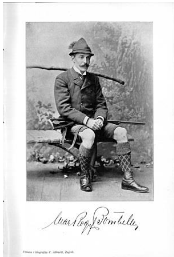
Slika 2.2. Grof Marko Bombelles mlađi

Marko Bombelles mlađi ostavio je u Vinici neizbrisiv trag svojim djelovanjem u javnom i kulturnom životu. Bio je jedan od osnivača Dobrovoljnog vatrogasnog društva Vinica, osnivač Hrvatske čitaonice i knjižnice u Vinici te Viničke štedionice. Grof Bombelles je do zadnjeg dana ostao aktivan političar, a njegovi politički potezi su uvijek bili odlučni. Ondašnji novinski članci uvelike su isticali kako je grof Marko Bombelles mlađi bio jedan od aristokrata koji je od davnine bio u uskom savezu s kraljevskom kućom. Bio je jedan od najbogatijih ljudi u Hrvatskoj (Izvor: Državna uprava za zaštitu kulture i prirodne baštine). [2]