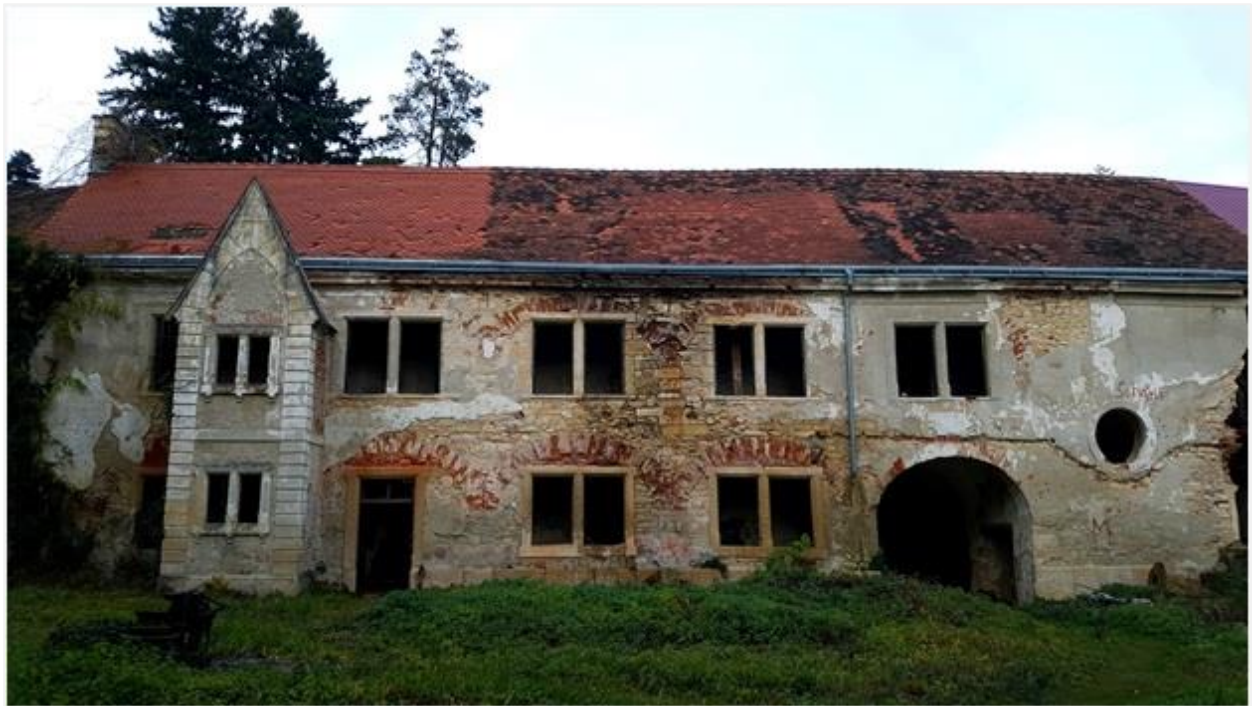
Slika 5.4. Pogled na dvorac s unutrašnjeg dvorišta