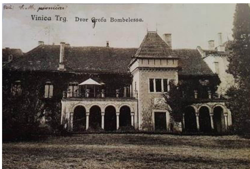
Slika 2.1. Dvorac Opeka