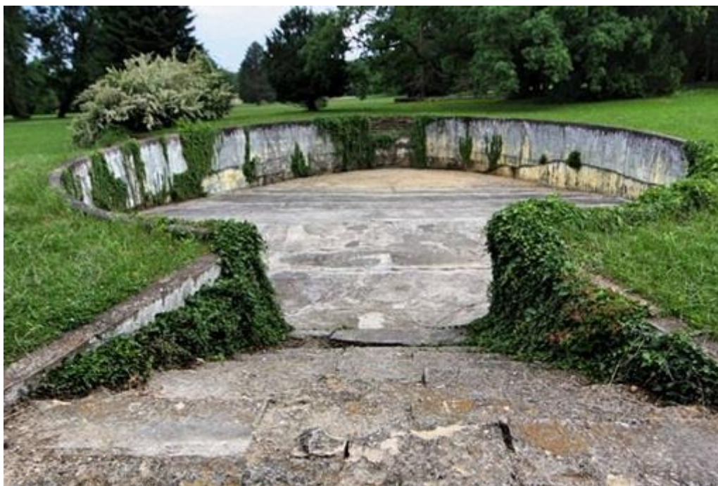
Slika 6.6. Bazen

Od vrtnog inventara izdvajaju se kamene klupe vrhunskog dizajna iz 19. stoljeća, koje su nekada bile vrijedni skulpturalni ukras perivoja. U perivoju se danas većinom nalaze njihove replike izrađene od betona, ali postoji i nekoliko sačuvanih primjeraka.