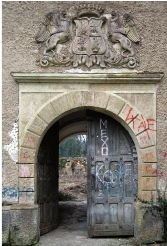
Slika 5.1. Glavni ulaz u dvorac Opeka

Dvorac je u kratkom razdoblju izgubio svoju strukturu, prvobitno zbog nemara kako države tako i vandala koji su iz godine u godinu uništavali i palili zidove i stropove u dvorcu. Objekt je bez ikakvog nadzora te u dvorac može ući tko god i kad god to poželi. Rezultati takvog stanja su zapanjujući. Unutar dvorca rijetko koji zid nije išaran grafitima i degutantnim rečenicama. Jasno se vide tragovi paleža kako pada tako i stropova i namjerno uništavanje dijelova krova kako bi unutra ulazila svjetlost. Jedino što još nije ukradeno iz dvorca su dvije kade koje se nalaze u prednjem dijelu dvorca. Sav ostali namještaj ukraden je, uklonjen ili kompletno devastiran. Zbog ovakvih postupaka okolnih vandala i tko zna koga još, nije preporučljivo ulaziti u dvorac niti se tamo zadržavati.