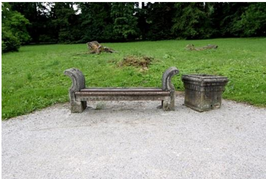
Slika 6.7. Kamena klupica iz 19. st

Od vrtnog inventara izdvajaju se kamene klupe vrhunskog dizajna iz 19. stoljeća, koje su nekada bile vrijedni skulpturalni ukras perivoja. U perivoju se danas većinom nalaze njihove replike izrađene od betona, ali postoji i nekoliko sačuvanih primjeraka.