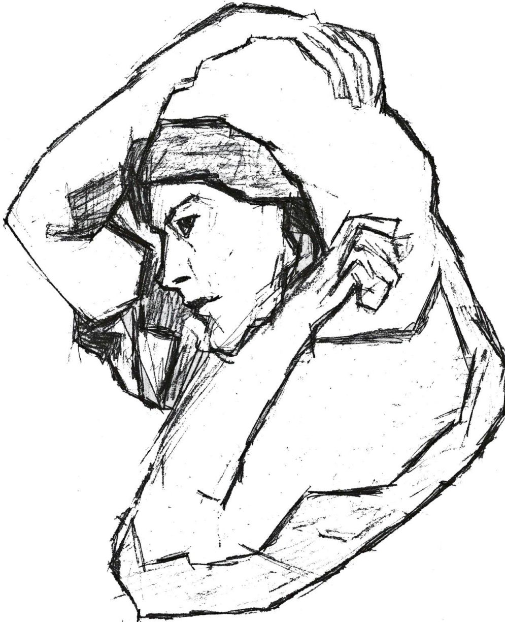
Slika 4.5. Digitalizirani crtež

Svrha digitalizacije je bila da se analogni crteži (crteži nastali grafitnom olovkom i ugljenom) prenesu u digitalni oblik, i da se putem grafičkog programa Adobe Photoshop naprave željene korekcije na crtežima. U procesu obrade na crtežima se povećao kontrast crne i bijele boje- sjena kako bi se stvorio umjetnički dojam, te željeni krajnji rezultat. Na pojedinim crtežima u procesu obrade promijenjen je format crteža, koji je u krajnjem procesu otiska na majicu vizualno nadopunjavao crtež.