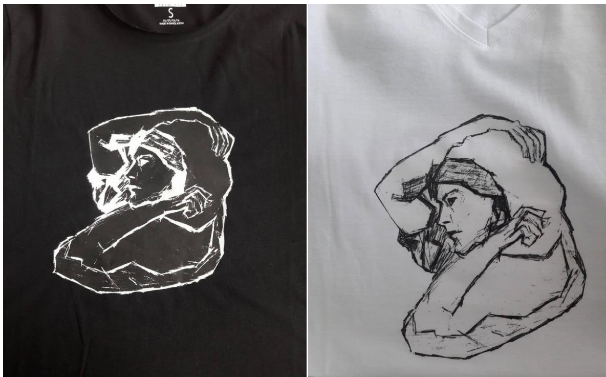
Slika 5.4. Otisak na crnu i bijelu majicu

otiska na majice rezultirale su vrlo kvalitetnom oštrinom. S obzirom na različitost u procesu otiskivanja na majice crne i bijele boje, otisak na bijelu majicu daje bolji vizualni i mehanički-opipljivi dojam, jer se sama boja kvalitetnije otisnula u tkaninu majice. Otisak na crnu majicu daje dojam plastičnosti, te sam otisak nije dovoljno utisnut u majicu. U usporedbi sa drugim tehnikama tiska, termotisak je vrlo pristupačna tehnika koja ne zahtijeva previše radnji kod pripreme za otisak. Termotisak je direktna tehnika tiska i sama priprema vrši se putem računala, nakon koje se željena aplikacija ispiše sa laserskim ili ink-jet pisačem na termo-papir.