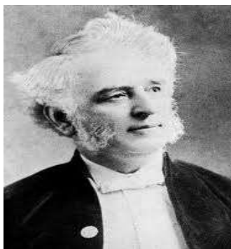
Slika 2.1. John Langdon Down - prvi koji je opisao Down sindrom