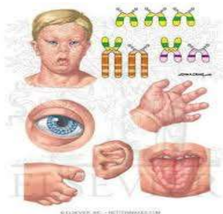
Slika 2.3.1 Karakteristike osobe s Down sindromom

sastoji od samo dvije falange. Stopala mogu pokazivati široki razmak između palca i drugog prsta.[3]