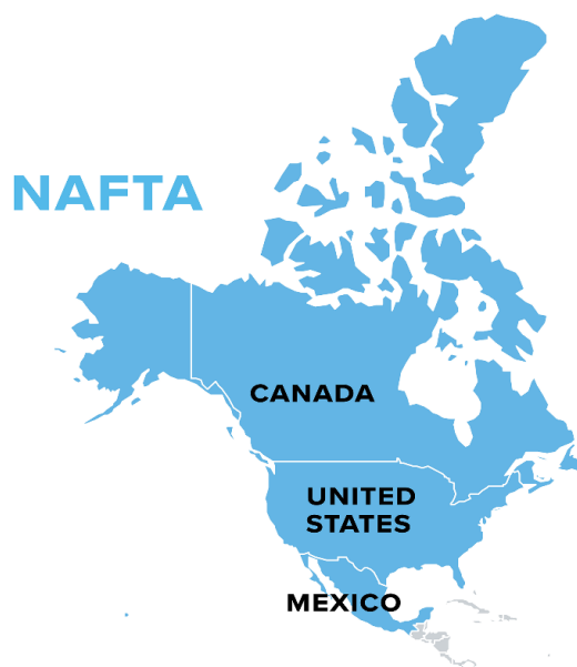
Slika 2: Članice NAFTA-e

Regionalna integracija NAFTA sastoji se od triju zemalja članica koje se nalaze na sjevernoameričkom kontinentu. Ukupna površina koju zauzimaju zelje članice NAFTA-e iznosi oko 21,5 milijuna kilometara kvadratnih, na kojem živi oko pola milijarde ljudi. Zemlja članica NAFTA-e s najvećim brojem stanovnika je SAD, s duplo većim brojem stanovništva od Meksika i čak 10 puta većim brojem stanovništva od Kanade. Najveću stopu rasta stanovništva ima Meksiko, a najmanju SAD. Razmatrajući financijske podatke najveći BDP po glavi stanovnika ima SAD, nešto manje ima Kanada, dok Meksiko bilježi znatno manje iznose nego SAD i Kanada. Ta činjenica govori da Meksiko financijski uvelike zaostaje za divovima SAD-om i Kanadom, ali s najvećom stopom rasta BDP-a ima potencijala da im se financijski približi.