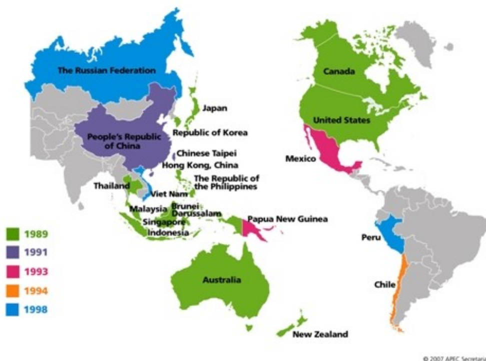
Slika 6: Zemlje članice APEC-a

Filipini. Savez ima potencijala za financijski napredak pošto sve zemlje članice osim Brunej Darusalama i Rusije bilježe rast BDP-a, a najveći rast pripada Kini, Vijetnamu i Filipinima.