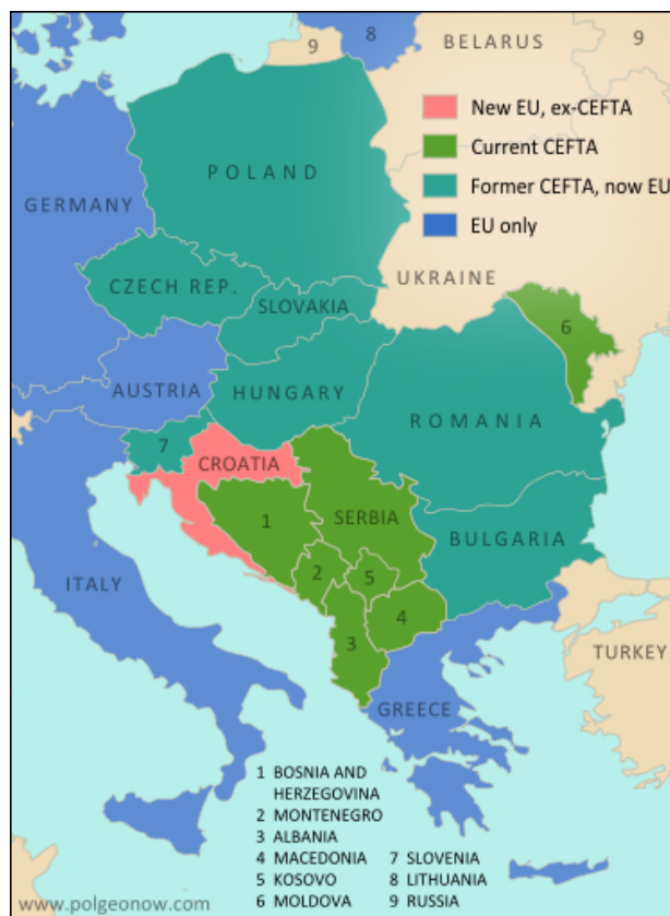
Slika 3: Bivše i sadašnje članice CEFTA-e

Izvor: Political Geography Now. Dostupno na: http://www.polgeonow.com/2013/07/croatia-joins-eu-leaves-cefta.html (22.02.2018.)