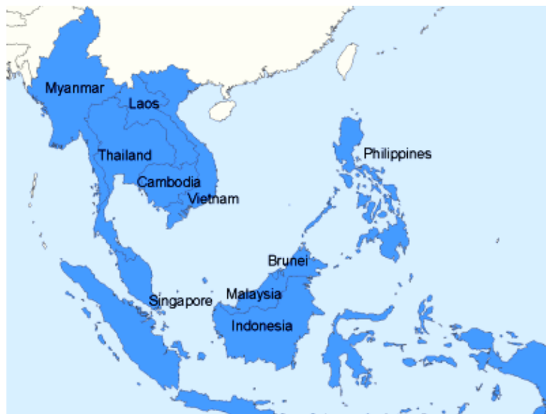
Slika 1: Zemlje članice ASEAN-a

stanovnika slijedi ga Brunej Darusalam, dok ostale zemlje članice imaju znatno manje iznose. Ti podaci govore da su unutar saveza velike razlike između bogatih članica i siromašnih članica, kojih je znatno više. Najveću stopu rasta BDP-a bilježe zemlje u razvoju (Laos, Filipini i Kambodža), a jedini s negativnom stopom rasta BDP-a je Brunej Darusalam.