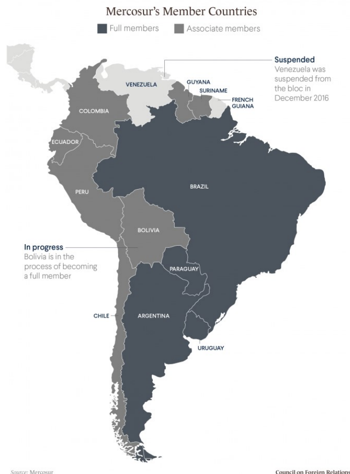
Slika 4: Zemlje članice MERCOSUR-a

Regionalna ekonomska integracija MERCOSUR sastoji se 5 punopravnih zemalja članica s južnoameričkog kontinenta. Zemlje članice MERCOSUR-a na južnoameričkom kontinentu zauzimaju oko 13,7 milijuna kilometara kvadratnih ukupne površine, s nastanjenih oko 300 milijuna stanovnika. Daleko najveći broj stanovnika ima Brazil, gotovo pet puta više od Argentine, koja je po odmah druga po broju stanovnika nakon Brazila, a najmanje stanovnika broje Urugvaj i Paragvaj. Sve zemlje članice saveza imaju pozitivnu stopu rasta stanovništva, a najveće stope bilježe Venecuela i Paragvaj, dok najnižu bilježi Urugvaj. Financijski podaci pokazuju da su najrazvijenije države saveza MERCOSUR-a Urugvaj i nakon njega Argentina, koji imaju najveći BDP po glavi stanovnika. Najveću stopu rasta BDP-a ima Paragvaj, koji uz Urugvaj zapravo jedini ostvaruje rast. Od ostalih članica koje ostvaruju pad BDP-a prednjači Venecuela, i to s izrazito velikom stopom pada.