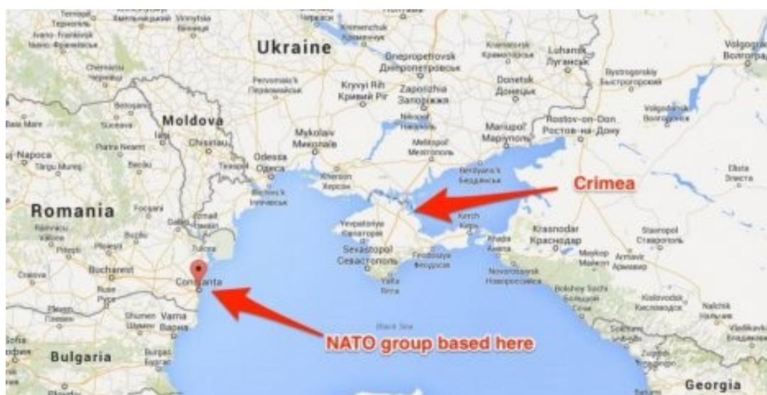
Slika 6: NATO formira flotu u Crnom moru