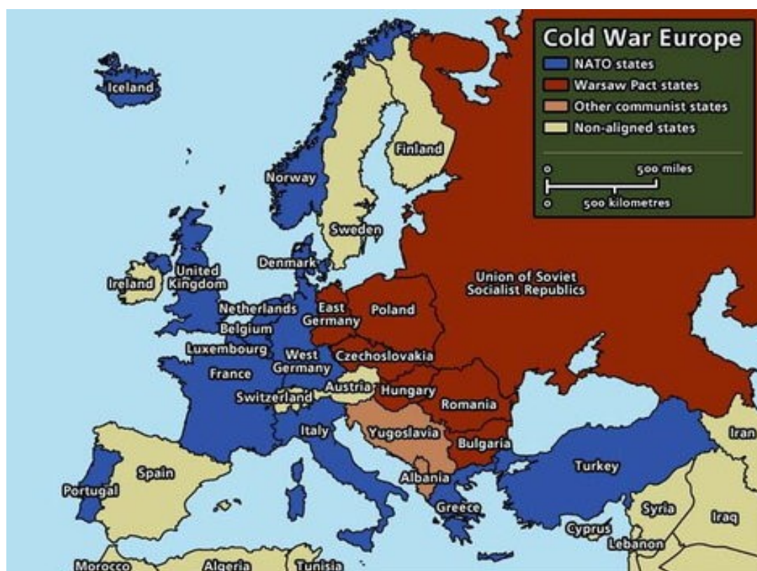
Slika 2: Podjela Europe za vrijeme Hladnog rata