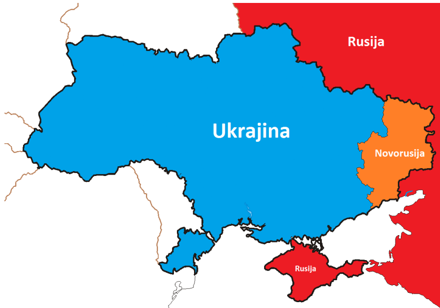
Slika 4: Teritorij Ukrajine – aneksija Krima i nastanak Novorusije

se nalazi na pomolu podijele zemlje i na početku građanskog rata za njezin suverenitet.