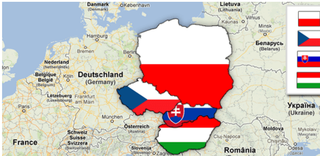
Slika 3 : Zemlje Višegradske skupine