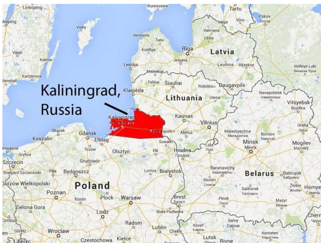
Slika 5: Prikaz Kalinjingradske oblasti

Izvor: https://www.blic.rs/vesti/svet/litvanci-razbesneli-putina-oduzmite-kalinjingrad-rusiji-moskva-grmi-ne-igrajte-se/y7qwqz6 , 12.02.2018.