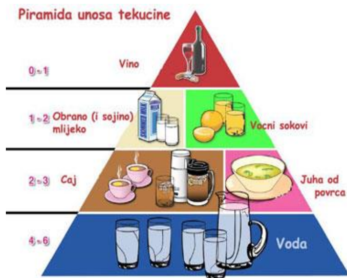
Slika 6.1. Piramida unosa tekućine

Da bi se prevenirala dehidracija potrebno je voditi računa o važnosti kontinuirane edukacije osoba starije životne dobi, odgovarajućem unosu tekućine, izračunati unos tekućine tijekom dana, koristiti vrstu tekućine koja odgovara osobi starije dobi, (izbjegavati sokove i pića puna šećera), unositi tekućinu tijekom obroka radi lakšeg žvakanja ali paziti da se prilikom toga ne narušava apetit, adekvatan raspon uzimanja tekućine tijekom dana, (ne uzimati jednokratno veliku količinu), dokumentacija unosa tekućine. Također suprotno hipohidraciji se može javiti i hiperhidracija, koja najčešće nastaje zbog prekomjernog unosa vode u organizam, a može dovesti do potencijalno smrtonosnoga poremećaja ravnoteže elektrolita i edema mozga [12].