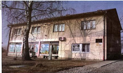
Zgrada u kojoj se nalaze ambulanta i liječnički stan