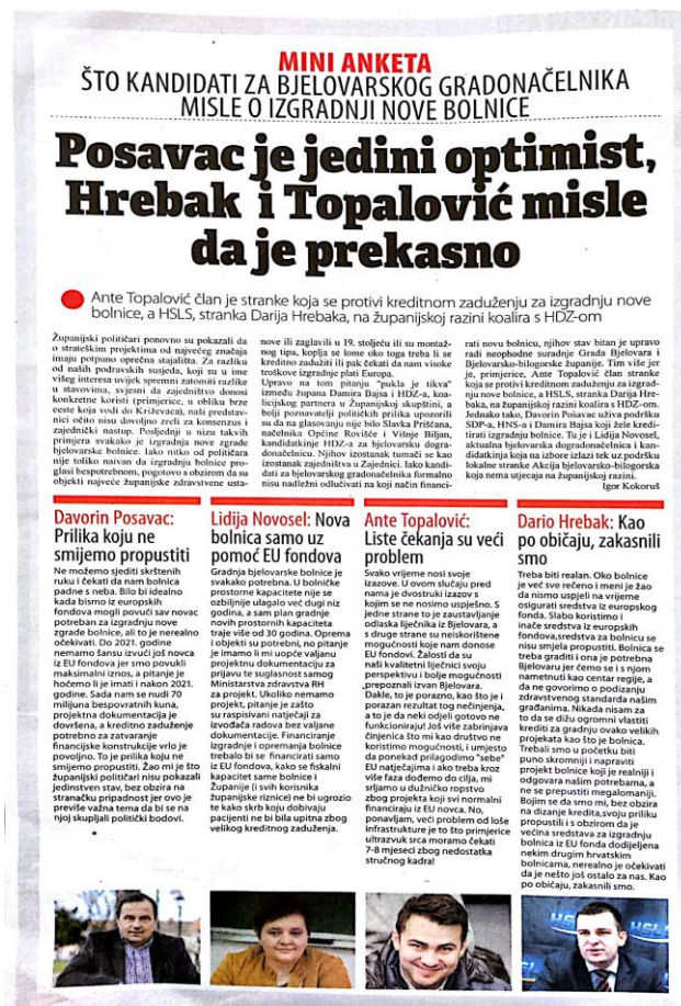
Slika 5. Mini anketom zapostavljena dva kandidata

U tekstu objavljenom 27. travnja 2017. prekršen je standard uravnoteženosti. Mini anketom Što kandidati za bjelovarskog gradonačelnika misle o izgradnji nove bolnice ispitana su samo 4 od ukupno 6 kandidata koji su bili na listi u prvom krugu lokalnih izbora. Svoje mišljenje o bolnici mogli su iznijeti Lidija Novosel, Davorin Posavac, Ante Topalović i Dario Hrebak, ali ne i Stipe Šola te Marijan Žiher. Anketa je provedena manje od mjesec dana prije izbora te ne postoji mogućnost da novinari nisu bili upoznati s kandidaturom dva zapostavljena kandidata (Slika 5.).