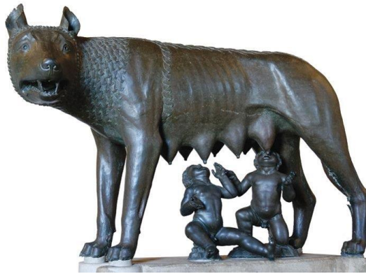
Slika 4 Romul i Rem

Ne postoji mnogo saznanja o ženama u Starome Rimu jer su povjesničari bili muškarci i pisali su samo o muškom rodu. Iz rimske mitologije i povijesti, važno je spomenuti Reu Silviu, majku Romula i Rema, Lukreciju i vučicu Martiu. Vjeruje se da je Rim nastao na sedam brežuljaka te da su ga osnovali braća Romul i Rem.