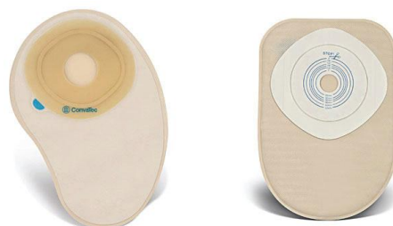
Slika 7.1 Jednodijelni sustav za kolostomu

Jednodijelni sustavi su tanji od većine dvodijelnih stoma sustava i tako manje zamjetni ispod odjeće. Jednostavni su za uporabu, a pri svakoj zamjeni vrećice uklanjaju se u cijelosti. Dostupni su u izvedbi za sve tri vrste stoma: zatvorene vrećice (za kolostomu), vrećice s ispustom (za ileostomu) i vrećice sa ispusnom slavinom (za urostomu). [31]