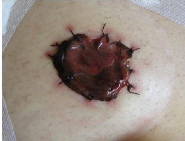
Slika 6.1 Nekroza stome