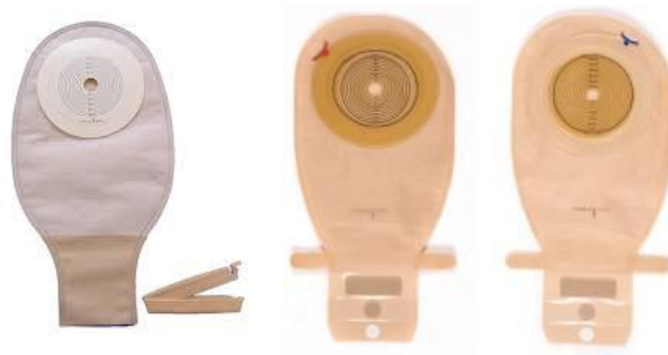
Slika 7.2 Jednodijelni sustav za ileostomu

Osnovno obilježje dvodijelnog sustava je da se sastoje od dva dijela i to: