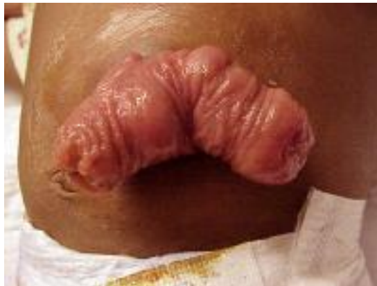
Slika 6.4 Prolaps stome

Prolaps je stanje koje karakterizira protuzija crijevne vijuge proksimalno od same stome na prednju trbušnu stijenu. Bolesnik često sam može reponirati prolabiranu crijevnu vijugu kako bi olakšao crijevnu pasažu te promjenu i lijepljenje pločice. Ukoliko dolazi do uklještenja i vaskularne kompromitacije prolabiranog crijeva, edematoznog crijeva, lividne ljubičaste boje, bolesnik se javlja s bolovima, povraćanjem i slikom crijevne opstrukcije, tada je potrebno hitno kirurško liječenje. [20]