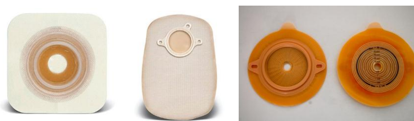
Slika 7.3 Dvodijelni sustav za kolostomu

Kod dvodijelnog sustava s tehnologijom lijepljenja, vrećica i podložna pločica međusobno se spajaju uz pomoć pjenastog ljepljivog prstena smještenog na vrećici i područja za lijepljenje na podložnoj pločici, čime je izbjegnuta potreba za spajanjem pomoću krutih prstenastih spojnika. Tehnologijom spajanja lijepljenjem omogućuje se savitljivost i gipkost cijelog sustava usporedbi s uobičajenim dvodijelnim sustavom. Uz to cijeli sustav ima nizak profil te je manje zamjetan ispod odjeće. [19]