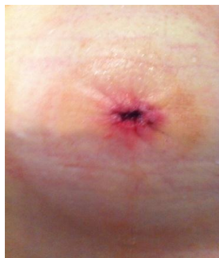
Slika 6.3 Stenoza stome

Suženje stomalnog otvora (stenoza stome) gotovo se uvijek pojavljuje kao posljedica neadekvatnog kirurškog kreiranja same stome. Ozljede kraja crijeva ili ruba kože koje znatno krvare mogu cijeliti formiranjem stenozirajućeg ožiljka, a drugi najčešći mehanizam je nastanak malih peristomalnih apscesa zbog neodgovarajućeg postavljanja šava crijeva za kožu te posljedične ožiljkaste sanacije tih apscesa. Liječenje se sastoji od kirurške ekscizije stenozirajućega prstena te ponovnog adekvatnog formiranja stome jer tehnike dilatacije donose samo privremeno rasterećenje i rezultiraju recidivom stenoze. [20]