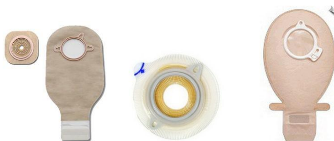
Slika 7.4 Dvodijelni sustav za ileostomu