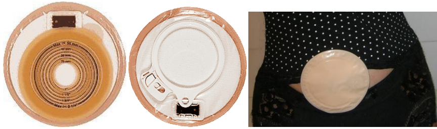
Slika 7.5 Stoma kapa ili čep

Stoma kapa ili čep pokriva stomu, ali nema spremnik za stolicu (odnosno spremnik je vrlo mali), koristi se kod kupanja u moru ili bazenu, a može se koristiti i nakon irigacije. [26]