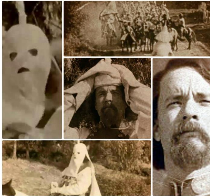
Slika 7.1. Scena „Ku Klux Klana”

Slika prikazuje scenu iz filma „The Birth of Nation” snimljenog 1915. godine, no važno je spomenuti kako se radi o lažiranoj sceni u koju je protagonist Forrest Gump ubačen kao osnivač „Ku Klux Klana”.