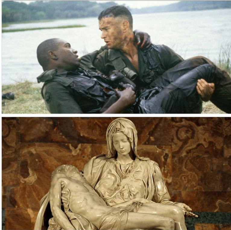
Slika 6.2. Jukstapozicija Bubbe u Forrestovom naručju s Michelangelovom skulpturom