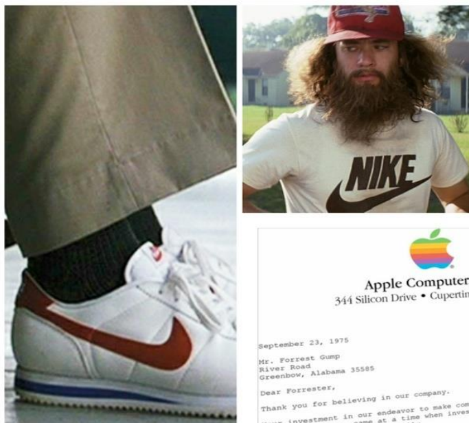
Slika (kolaž) 7.2. Promoviranje „Nikeovih” artikala i „Apple” korporacije kroz film

komercijalizacijom filma, koja se pored vrjednijeg bogatstva tematike sklanja u stranu, odnosno u pozadinu jer postaje apsolutno bezvrijedna kao apsolutno proturječna.