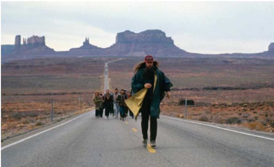
Slika 6.1. Forrest kao Isus Krist sa svojim sljedbenicima

Jedan mladić koji ga je počeo slijediti povjerio se: „Želim reći da sam u glavi čuo kao neki alarm. Rekao sam, evo tipa koji zna što radi. Evo tipa koji svoje misli provodi u djelo. Evo nekog tko zna odgovor! Svuda ću vas slijediti, gospodine Gump.”