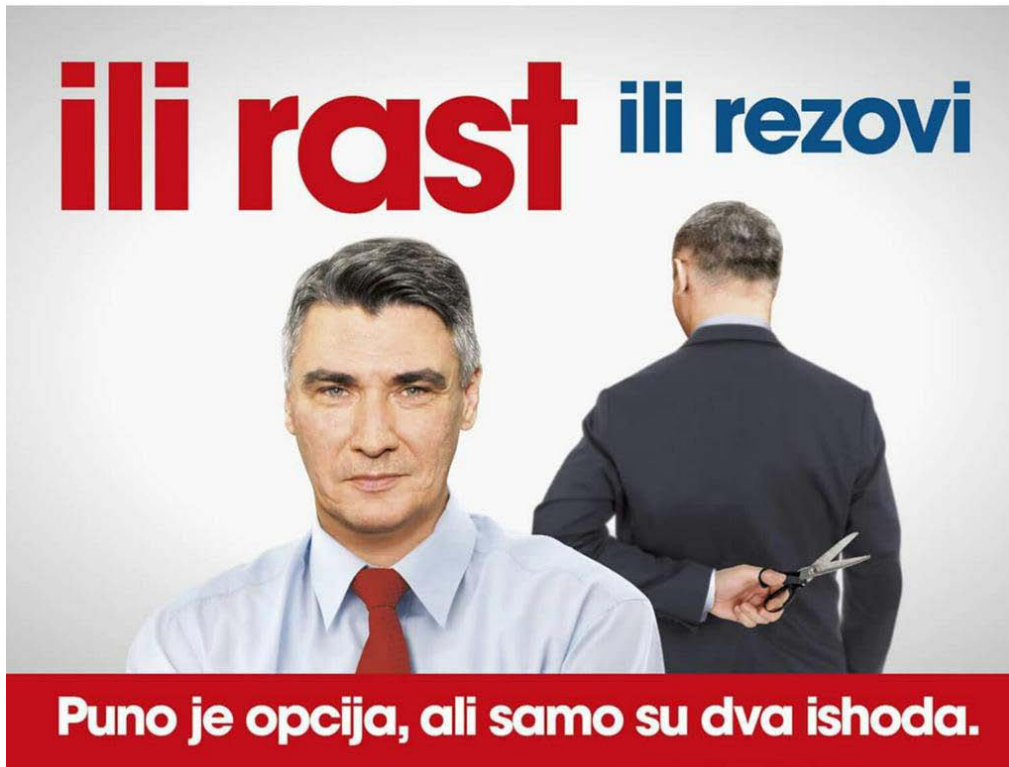
Slika 6.4.2. Plakat stranke SDP

Stranka HDZ sastavila je popis top 10 propalih obećanja stranke SDP iz predizborne kampanje 2011-e godine – plan 21.