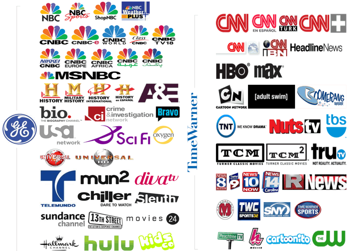
Slike 5.1. Mediji u vlasništvu korporacija General Electric i Time Warner

Kao primjer, istaknula bih dvije velike svjetske korporacije i medije koji su u njihovom vlasništvu: