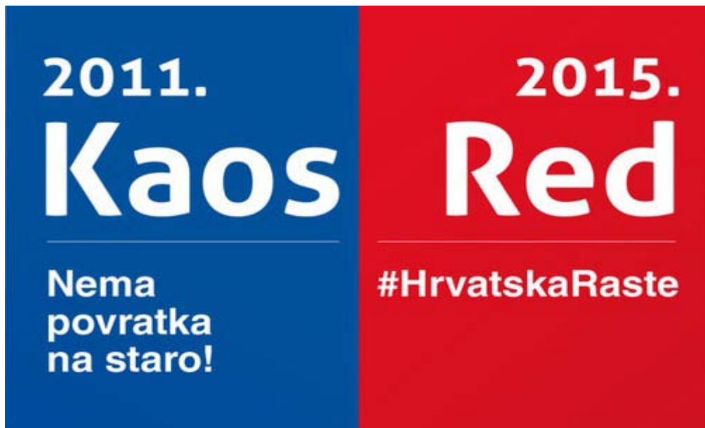
Slika 6.3.7. Plakat stranke SDP