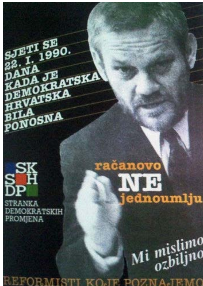
Slika 6.3.4. Plakat stranke SKH-SDP, izvor: http://povijest.net/wp-content/uploads/2016/06/skh-sdp-hdz.jpg

„Zaustavili smo jednouljje, ostvarili demokraciju, Hrvatska slobodno bira“ i „Račanovo NE jednouljju“.