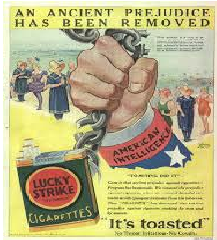
Slika 6.1. Plakat vezan uz kampanju za Lucky strike cigarete

Postiže se doba želja, a ne potreba, čime se riješio problem prekomjerne proizvodnje.