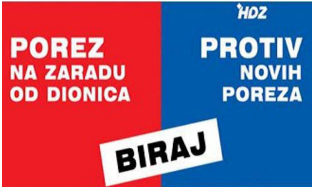
Slika 6.3.6. Plakat stranke HDZ

2015-e godine SDP je prozvan zbog velike sličnosti njihovih plakata sa plakatima HDZ-a iz 2007-e godine.