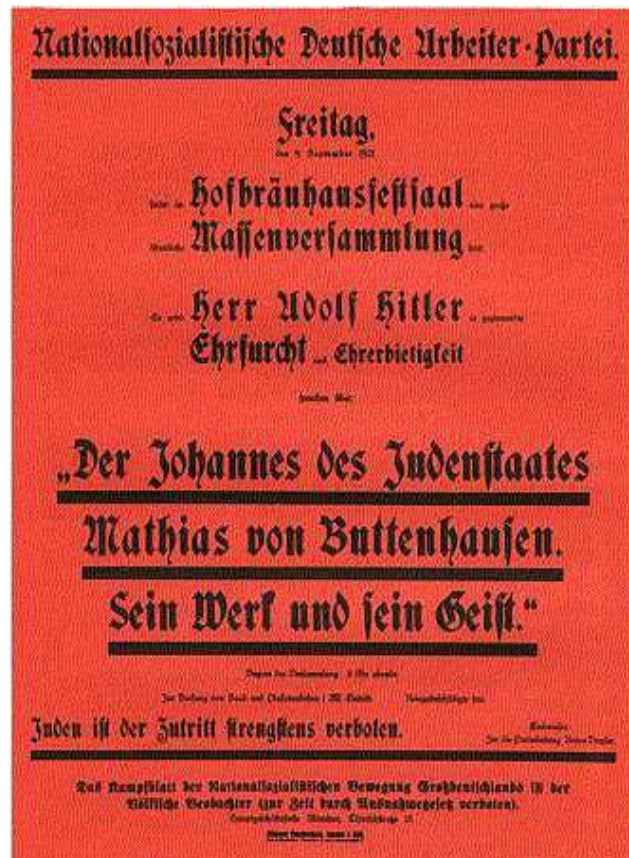
Slika 6.2. Primjer propagandnog plakata Adolfa Hitlera, 1921. godine, izvor: http://www.bytwerk.com/gpa/posters1.htm

Za vlastitu propagandu, među ostalimh, Hitler je koristio plakate. Među najranijim plakatima koji su bili napravljeni, isticala se crvena pozadina – što je bilo po njegovom napatku, kako bi plakat privukao pažnju pojedinca, ali i kako bi izazvao reakciju svojih političkih protivnika – komunista.