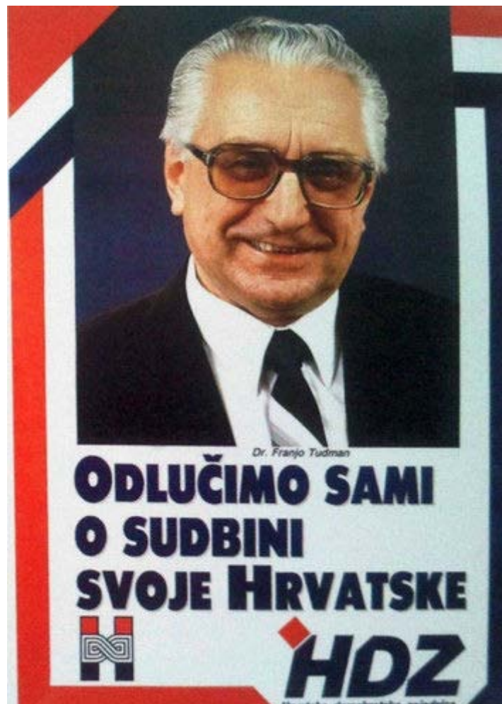
Slika 6.3.5. Plakat stranke HDZ

„Zna se - HDZ“ ili „HDZ – naše je ime naš program“