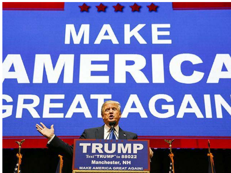
Slika 6.3.1. Slika slogana Donalda Trump-a iz predsjedničke kampanje

Donald Trump je za svoj slogan postavio „ Make America great again “.