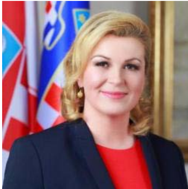
Slika 6.4.3. Kolinda Grabar Kitarović

Što se tiče predsjednice Republike Hrvatske, Kolinde Grabar Kitarović i njezinih predizbornih obećanja, u zadnje dvije godine nije ih ispunila mnogo: