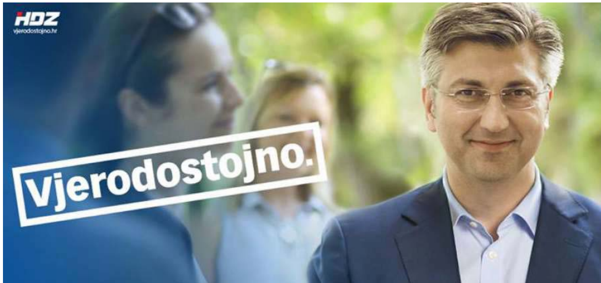
Slika 6.4.1. Plakat stranke HDZ, izvor: https://www.dulist.hr/wp-content/uploads/2016/08/andrej-plenkovic.jpg

Predsjednik HDZ stranke Andrej Plenković predstavio je HDZ-ov stranački izborni program u kojem su navedena razna obećanja, od kojih ćemo spomenuti neke: