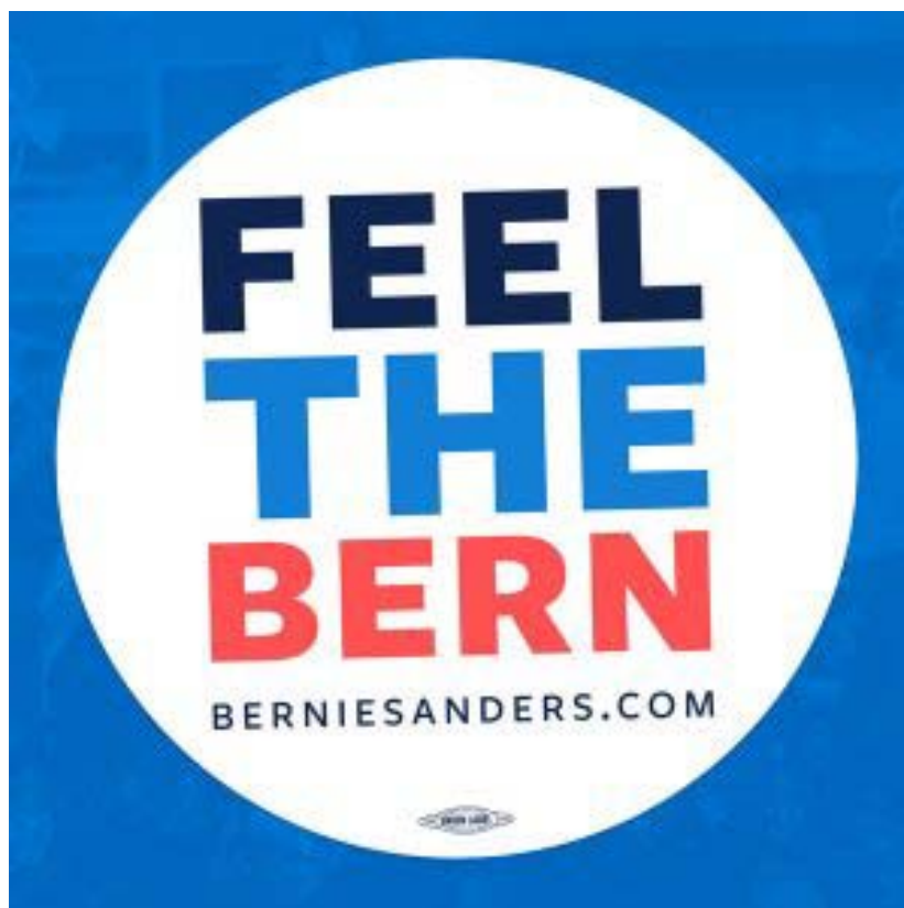
Slika 6.3.3. Slika slogana Bernie Sandersa iz predsjedničke kampanje, izvor: https://cdn.arstechnica.net/wp-content/uploads/2016/01/feelthebern-magnet_1024x1024-640x640.jpg

Neki od slogana su: „ Not me. Us “, „ Not for sale “, „ A future to believe in “... iako je njegov glavni slogan „ Feel the Bern “.