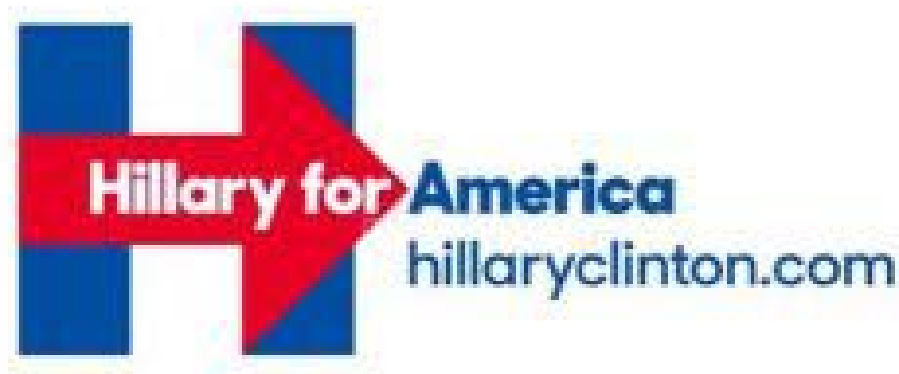
Slika 6.3.2. Slika slogana Hillary Clinton iz predsjedničke kampanje, izvor: http://data.junkee.com/wp-content/uploads/2015/04/hillary.jpg

Slogan Hillary Clinton glasio je: „ Hillary for America “.