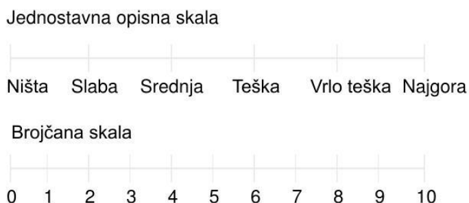
Slika 4.8.1.1 Skala procjene boli