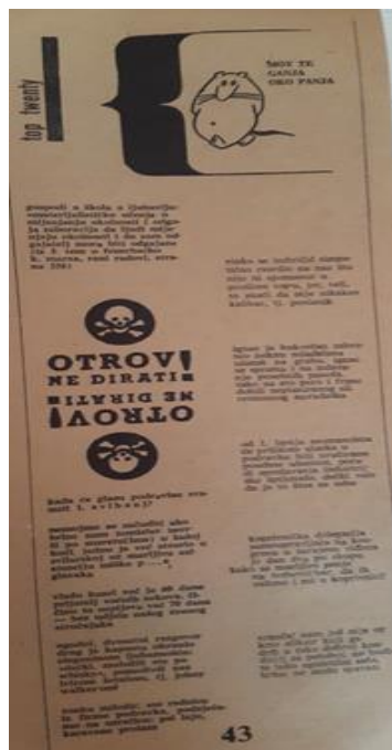
3.7. Slika „Top twenty“

Zanimljiva rubrika koja se nalazi na kraju časopisa zasićena dosjetcama i humorom, ali prikazana kroz aktualne lokalne događaje. Radi se o posebnom pristupu u kojem je baš društvena situacija sirovina za završni humoristični tekstualni proizvod. Ono što je važno za razumijevanje istoga jest upoznavanje s kompletnim listom kako bi se čitatelju približio način na koji su osmišljavali takve dosjetke, a ono što je malo teže dosegnuti jesu ljudi onog vremena o kojima se pričalo ili konkretne situacije za koje netko danas ne zna pa u takvoj situaciji možda ne može razumjeti o čemu su pisali i čemu su se smijali.