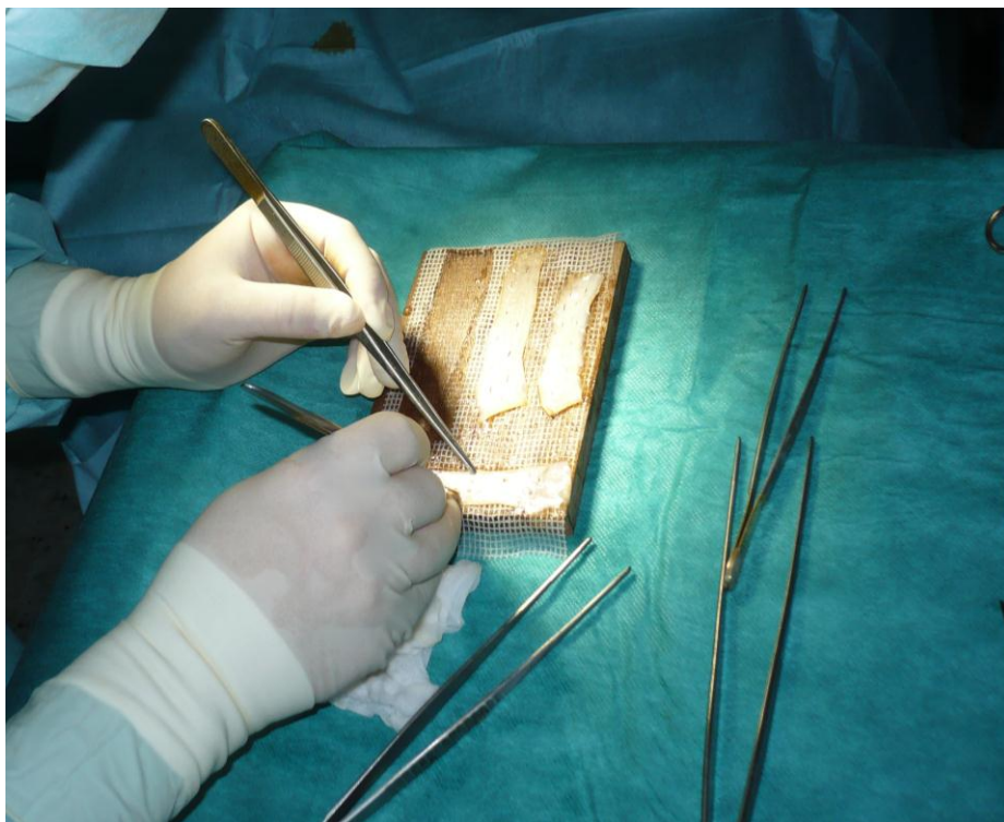
Slika 3.2.4. Thiersch transplantati