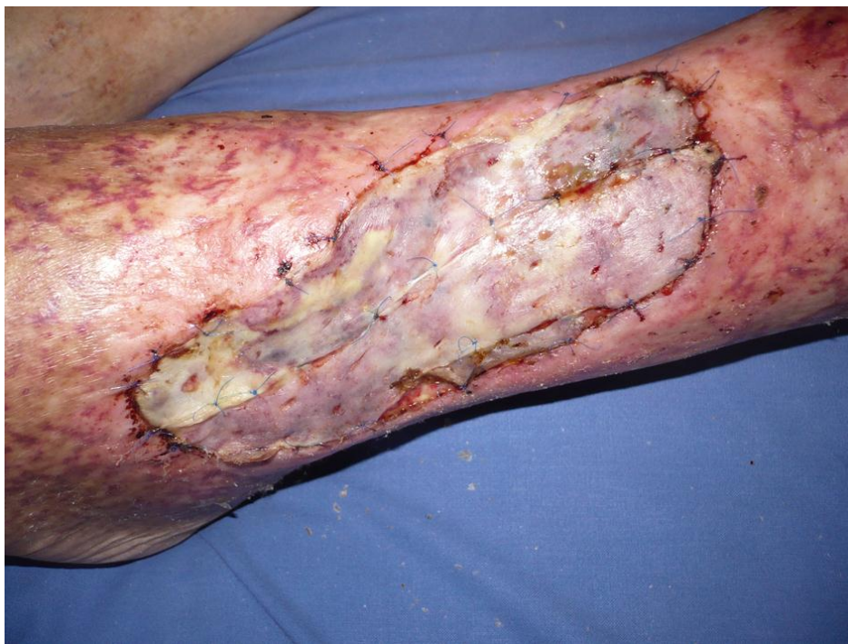
Slika 2.6.1. Uspješna transplantacija na potkoljeničnom ulkusu