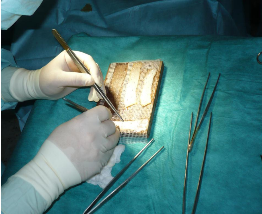
Slika 3.2.4. Thiersch transplantati