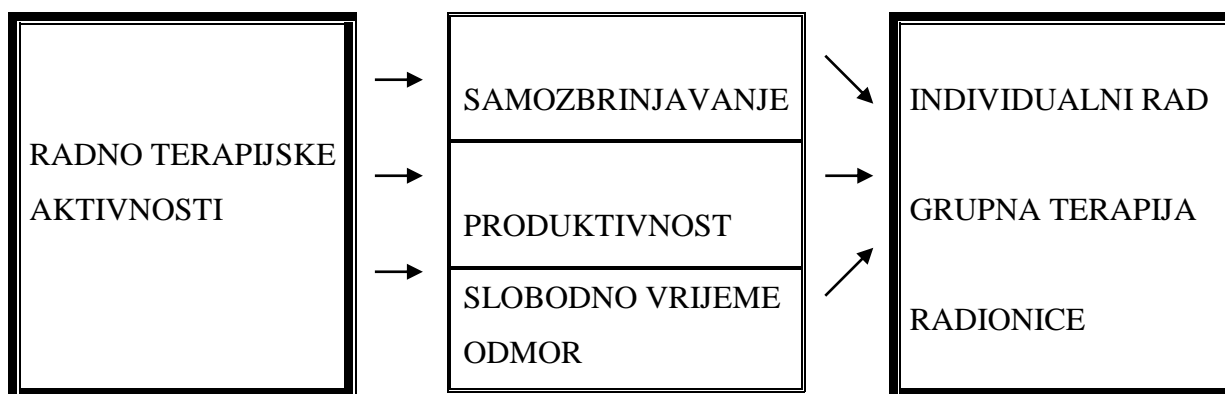
Slika 4.1.2.- Radno-terapijske aktivnosti doma

Na slici 4.1.2.- prikazano je područje radno-terapijskog djelovanja koje se provodi u Domu za odrasle osobe-Vizjak. Područje radno-terapijskog djelovanja u ovom domu usmjereno je na aktivnosti koje su korisnicima bliske i uobičajene te koje korisnici izvode tijekom svakog dana. To su aktivnosti samozbrinjavanja, produktivnosti i slobodnog vremena.