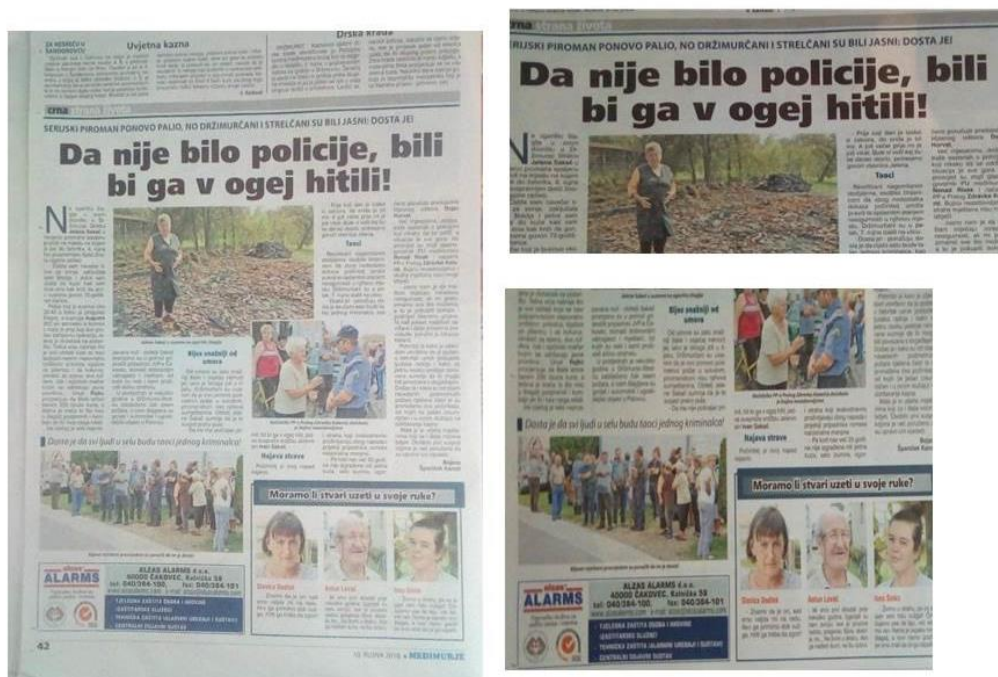
Slika 4.1.: Novinski članak u listu Medimurje

Ispod članka su fotografije osoba koje su kao svjedoci rekli svoje mišljenje o ovom događaju. Uglavnom su to riječi straha, mržnje prema pripadnicama romske nacionalne manjine i iskustva o požarima koje su oni imali.