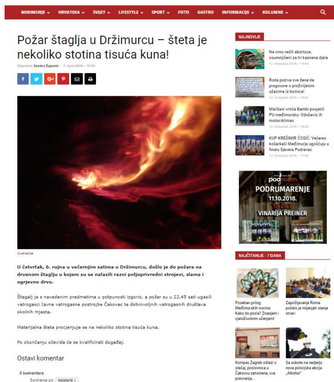
Slika 4.2.: Prikaz Internet članka na stranici međimurskih novina

Ne spominju krivca ni prosvjed, te je članak veoma kratak i iznose se samo glavne činjenice o požaru.