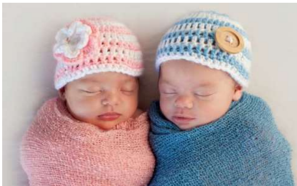
Slika 2.1.1 Formiranje identiteta tijekom ranog djetinjstva

često su izraženije kod dječaka, što se povezuje s činjenicom da je kod njih jači pritisak vršnjaka kako bi se uskladili s društvenim normama. Također, formiranje spolnog identiteta vidljivo je u izboru partnera za igru. Do druge godine života, djevojčice su sklonije provođenju vremena s drugim djevojčicama, dok se kod dječaka ovakve preferencije javljaju nekoliko mjeseci kasnije. Razdvajanje spolova sve više ojačava u kasnijem razvoju djeteta te se nastavlja sve do adolescencije (usp. Declercq, Moreau 2012: 18- 9).