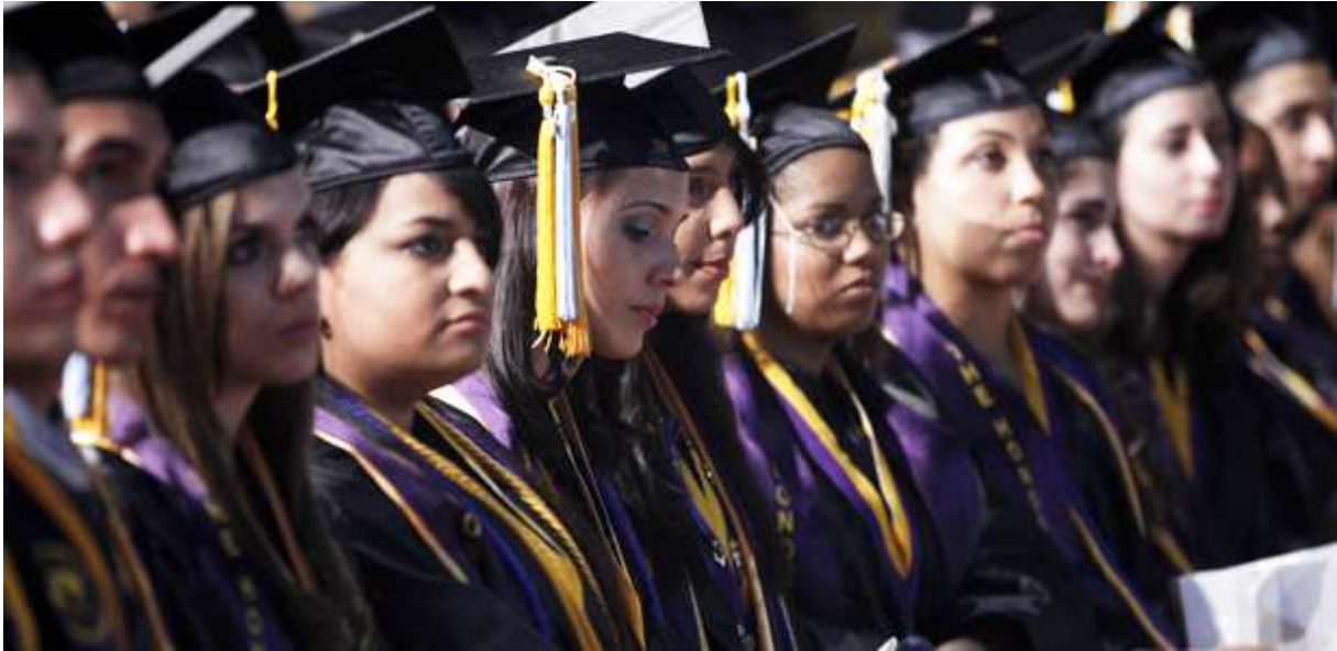
Slika 5.1.1 Obrazovanje žena

sustavu koji je ženu vidio isključivo kao dio obitelji budućeg supruga. Čak i kada bi žena stekla znanje, nije ga mogla unovčiti, odnosno njime samostalno zarađivati za život, niti je stjecanje znanja moglo povećati njezin društveni ugled kao samostalne individue. Intelektualne vrijednosti žena bile su ne samo u sjeni njihova fizičkog izgleda, već i moralnih osobina (dopadljivo ponašanje, umijeće razgovora, privlačnost...) (usp. Kodrnja 2006: 160).