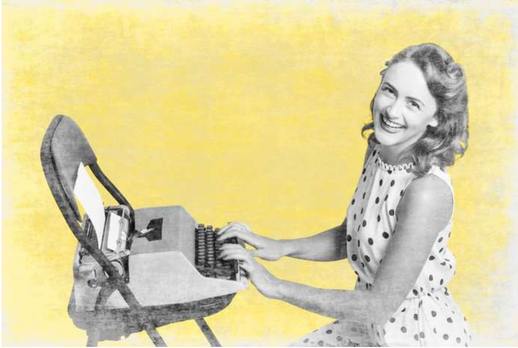
Slika 6.2.1 Sudjelovanje žena u književnosti