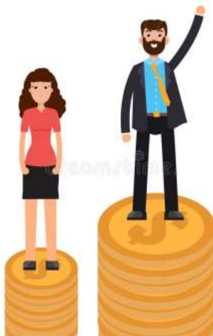
Slika 4.2.1 Muškarci su često više plaćeni od žena za obavljanje jednakog posla