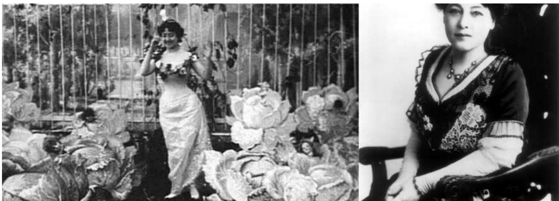
Slika 6.3.1 Prvi igrani film „ La Fée aux choux “ (1896.), režirala je Alice Guy-Blaché