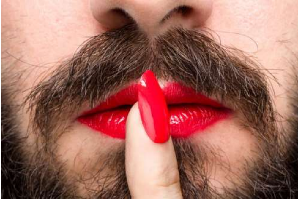
Slika 3.3.1 Težnja prema suprotnoj rodnoj ulozi

Poremećaj rodnog identiteta kod djece i adolescenata, s obzirom na brzinu i dramatičnost razvojnog procesa u toj dobi (psihološkog, seksualnog i fizičkog), razlikuje se od onog koji se javlja kod odraslih osoba. Stoga, može se reći kako poremećaj identiteta kod djece i adolescenata predstavlja složeno stanje. Mlada osoba svoj fenotipski spol može doživljavati proturječnim vlastitom doživljaju rodnog identiteta. U adolescenciji često je prisutna intenzivna uznemirenost, a česte su i s time povezane emocionalne poteškoće i poteškoće u ponašanju. Što se tiče ishoda, veća je fluidnost i varijabilnost, što se najviše očituje kod djece u pubertetskoj dobi. Mali broj djece s rodnim nesuglasjem postanu transseksualne osobe, iako mnoga na kraju razviju homoseksualnu orijentaciju. Najčešći oblici konflikata rodnog identiteta koji se javljaju kod djece i adolescenata, uključuju izraženu želju da budu drugog spola (izbjegavanje odjeće, ponašanja i igara koje se povezuju sa spolom i rodom koji mu je pripisan) (usp. isto: 14).