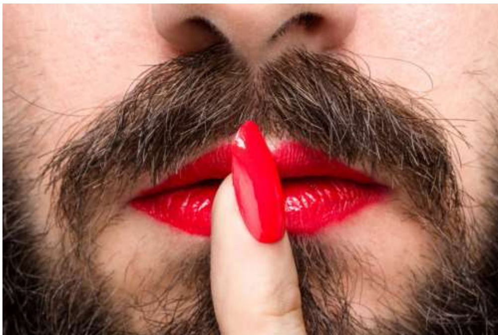
Slika 3.3.1 Težnja prema suprotnoj rodnoj ulozi

Poremećaj rodnog identiteta kod djece i adolescenata, s obzirom na brzinu i dramatičnost razvojnog procesa u toj dobi (psihološkog, seksualnog i fizičkog), razlikuje se od onog koji se javlja kod odraslih osoba. Stoga, može se reći kako poremećaj identiteta kod djece i adolescenata predstavlja složeno stanje. Mlada osoba svoj fenotipski spol može doživljavati proturječnim vlastitom doživljaju rodnog identiteta. U adolescenciji često je prisutna intenzivna uznemirenost, a česte su i s time povezane emocionalne poteškoće i poteškoće u ponašanju. Što se tiče ishoda, veća je fluidnost i varijabilnost, što se najviše očituje kod djece u pubertetskoj dobi. Mali broj djece s rodnim nesuglasjem postanu transseksualne osobe, iako mnoga na kraju razviju homoseksualnu orijentaciju. Najčešći oblici konflikata rodnog identiteta koji se javljaju kod djece i adolescenata, uključuju izraženu želju da budu drugog spola (izbjegavanje odjeće, ponašanja i igara koje se povezuju sa spolom i rodom koji mu je pripisan) (usp. isto: 14).