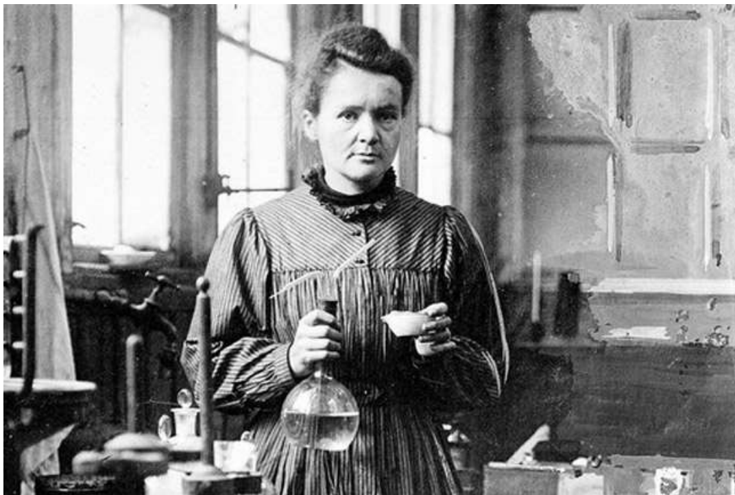
Slika 6.1.1 Marie Curie- Sklodowska, zaslužna za priznavanje žena kao znanstvenica

zajednice. U matematici, koja se još naziva i kraljicom svih znanosti, nema zabilježene niti jedne ženske osobe, iako niti jedan povijesni i enciklopedijski izvor ne zaobilazi postojanje Hipatije (370.-415. g.), neoplatoničke filozofkinje, matematičarke i astronomke. Učešće žena treba se razmotriti malo dublje u prošlost, one tamo jedva da i postoje i to u suženom prostoru tek nekoliko polja znanosti, a nikako u cijelom njenom rasponu. Zapravo, žene su se počele pojavljivati na području prirodnih znanosti tek nakon jedinstvenog uzora i značaja Marije Curie-Sklodowske, francusko-poljske kemičarke i fizičarke, dva puta nagrađene Nobelovom nagradom za izuzetna otkrića. Od tada počinje uvažavanje priloga žena povijesti znanosti i njenih istraživačkih pothvata. Pri tome, Nobelova nagrada postaje kriterij za ubilježavanje znanstvenica i znanstvenih istražiteljica u povijesti znanosti. Međutim, lako je uočiti kako Nobelova nagrada nije dominantan kriterij za upisivanje muških istraživača i znanstvenika u povijest jer oni i bez nje tamo dopijevaju (usp. Kodrnja 2006: 189-90).