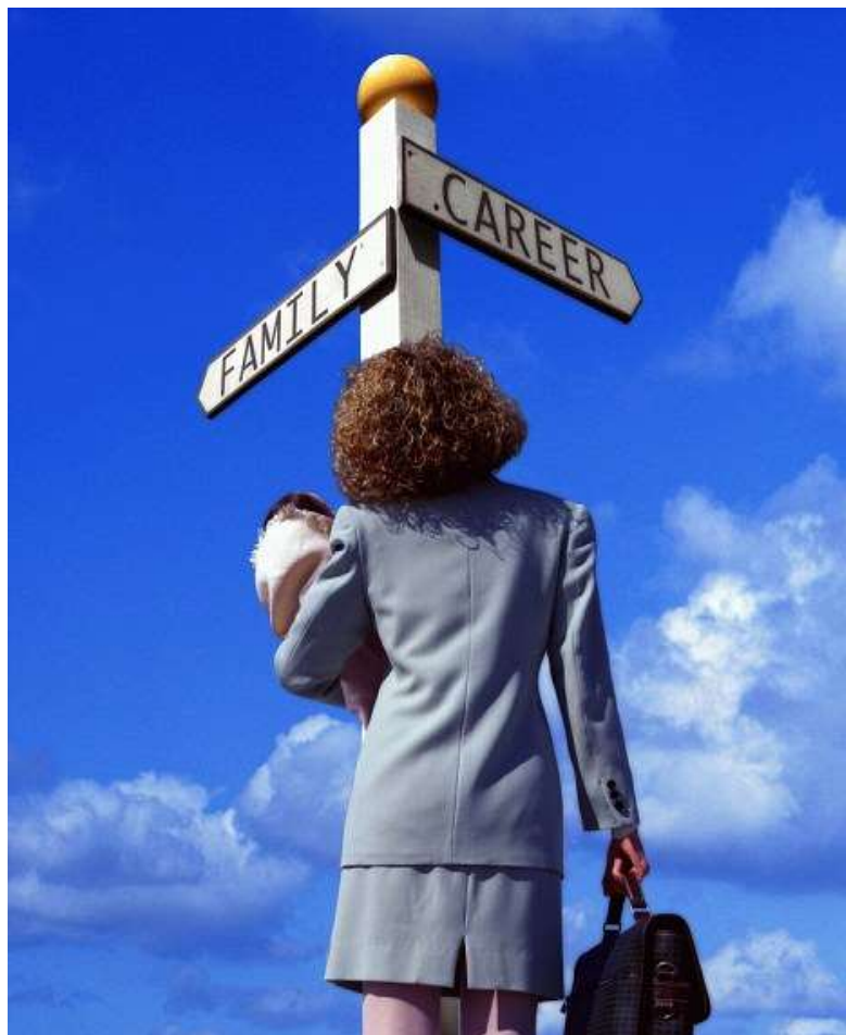
Slika 5.2.1 Žene prisiljene birati, karijera ili obitelj?

dostignuća na poslu. Treba naglasiti i kako je izbor karijere kućanice, odnosno žene koja se isključivo posvećuje podizanju djece i domu, vrlo riskantan potez. U suvremenim okolnostima, osoba koja se posveti samo kućanstvu izlaže se riziku da godinama akumulira „pogrešnu“ vrstu ljudskog kapitala – onoga koji se na tržištu ne može vrednovati. Istovremeno žena ne sakuplja nova iskustva i staž na tržištu rada, a znanja i vještine vezani uz njezino zanimanje ili profesiju postupno zastarijevaju (usp. Gelo, Smolić, Strmota 2010: 73-5).