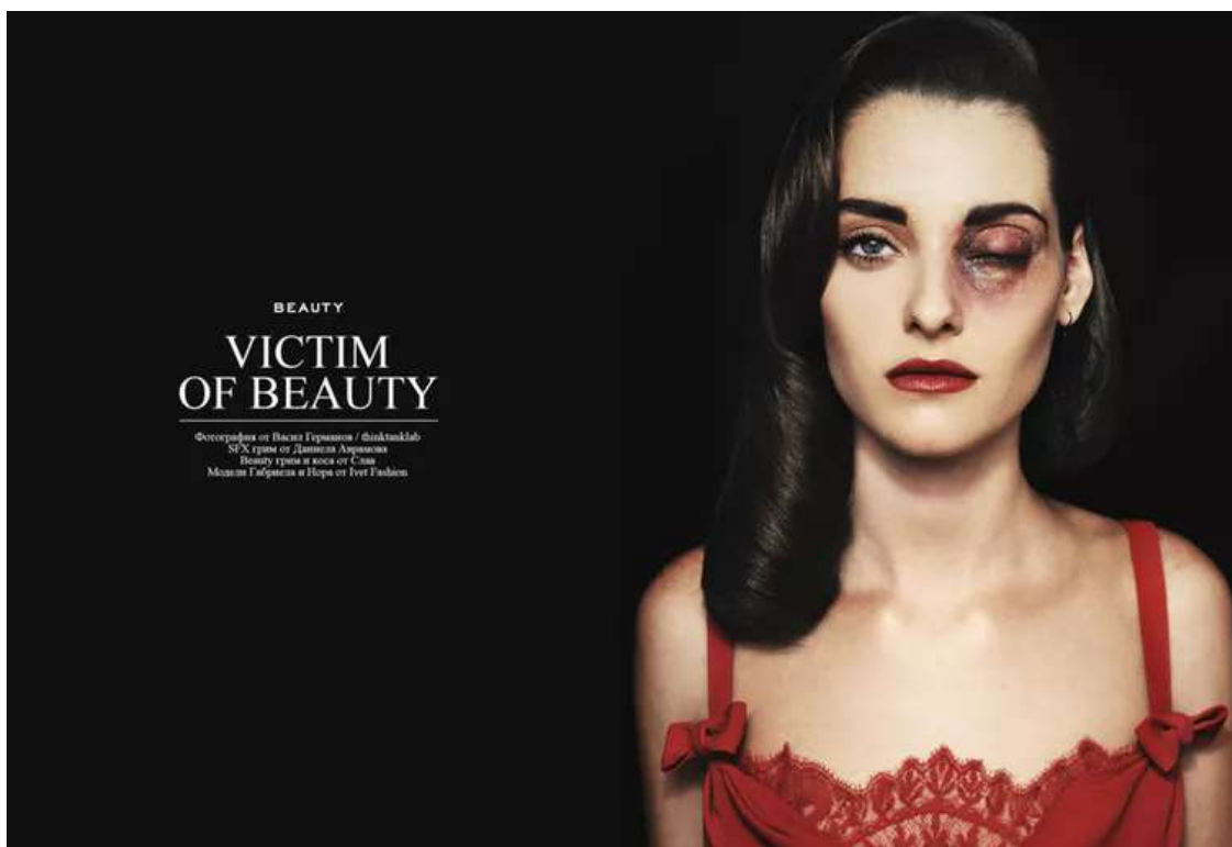
Slika 3.1.1.1 Žena – kolateralna žrtva ljepote

kao zreli; ona dolazi kući s lošom frizurinom i plače zbog ljutnje koju se čak srami i pokazati. Što god on rekao u tom trenutku neće biti ispravno, a sve što kaže samo je sve više vrijeđa. Ako je utješi i takav problem nazove sitnicom, on je ne razumije. A ako se kojim slučajem složi s njom da je to uistinu ozbiljan problem, to je još gore. Muškarac u takvim situacijama svjedoči nečemu što ne može razumjeti. Jednako tako bi se osjećala i žena kada bi muškarac kojeg voli bio zarobljen u nečemu toliko besmislenom, gdje ništa od onoga što bi mu ona rekla, ne bi moglo doprijeti do njega (usp. isto: 199-200).