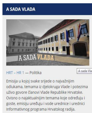
Slika 5.2. Emisija: A sada Vlada