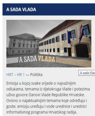
Slika 5.2. Emisija: A sada Vlada