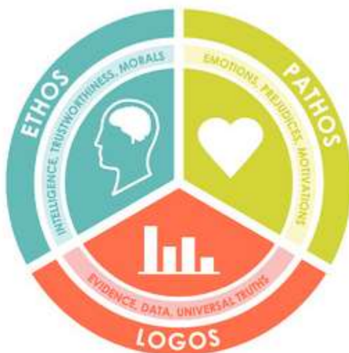
Slika 2: Tri tripa uvjeravanja: Ethos, Pathos i Logos

Retorički govor ujedinjuje volju, razum i osjećaje, a cilj mu je pridobiti osobu za neku ideju ili akciju (Anonymus, 2016).