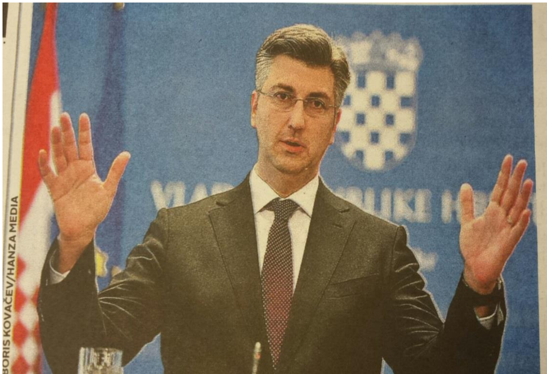
Ilustracija 3.6. Tipični Plenkovićev portret u Jutarnjem listu

Večernjakov je pristup, dakle, dokumentaristički bogatiji i dosljedniji, uz osjetno manje vizualnih provokacija i svjesnih manipulacija u odnosu na Jutarnji list. U Jutarnjem listu može se na fotografijama u slučaju Plenković povremeno osjetiti negativno raspoloženje, iako je takvih prikaza tek desetak posto u odnosu na ukupni broj njegovih fotoportreta. Tu je premijer prikazan kako zasigurno nije želio ispasti, iskazujući ljutnju, nekontrolirani smijeh i tome slično. Kod Večernjeg lista su gotovo uvijek objavljivane fotografija u kojima nije namjera prikazati Plenkovića u negativnom kontekstu. U Večernjem se, za razliku od povremenih postupaka Jutarnjeg lista, vizualno ne komentiraju pojedini premijerovi potezi.