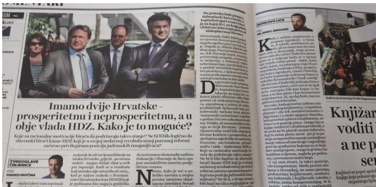
Ilustracija 3.4. Presnimka kolumne Marka Biočine u Jutarnjem listu

Prema istraživanju u svibnju iste godine 9 , u posljednja četiri mjeseca prednost HDZ-a u odnosu na SDP gotovo se prepolovila (u veljači je iznosila gotovo 12 posto, dok je tada bila 6,7 posto), opet zbog „afere Agrokor” te Plenkovićeva podržavanja ministara Barišića i Marića. Također, svibanjsko istraživanje 2017. pokazalo je kako vrh ljestvice negativnog doživljaja hrvatskih političara drži upravo premijer Plenković, za koga je glasalo 18,5 posto anketiranih građana. Ukratko, negativno raspoloženje prema Plenkoviću osjetno je poraslo od početka godine. Na kraju godine, točnije u studenome 2017., istraživanje CRO Demoskop 10 potvrdilo je kako se upravo premijer našao na vrhu ljestvice negativnog doživljavanja hrvatskih političara. Tomu je zasigurno pridonio slučaj Tomašević, odnosno mlako reagiranje vrha HDZ-a na nasilje u obitelji svoga župana, o kojem su Jutarnji i Večernji list gotovo podjednako pisali, te je sveukupno o toj temi objavljeno sedam članaka. Pri samom kraju, u prosincu 2017. godine, najviše se pisalo o arbitraži sa Slovenijom, o čemu je objavljeno 37 tekstova.