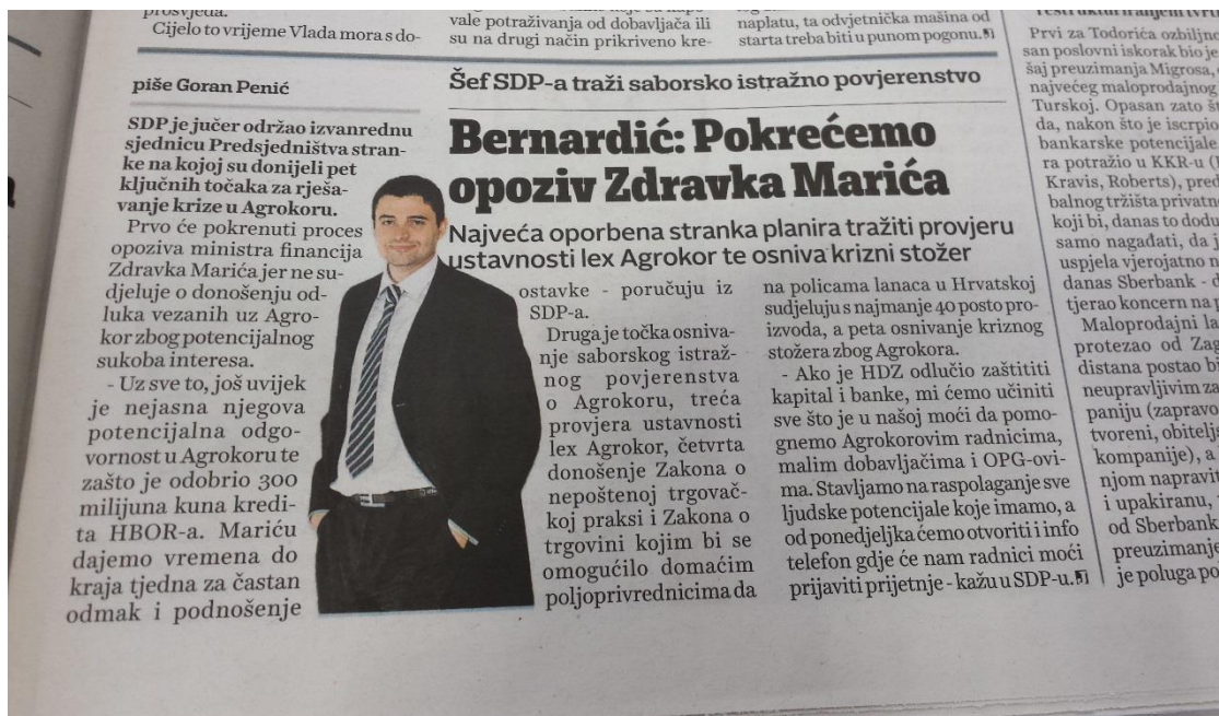
Slika 3.5. Presnimka teksta u Večernjem listu