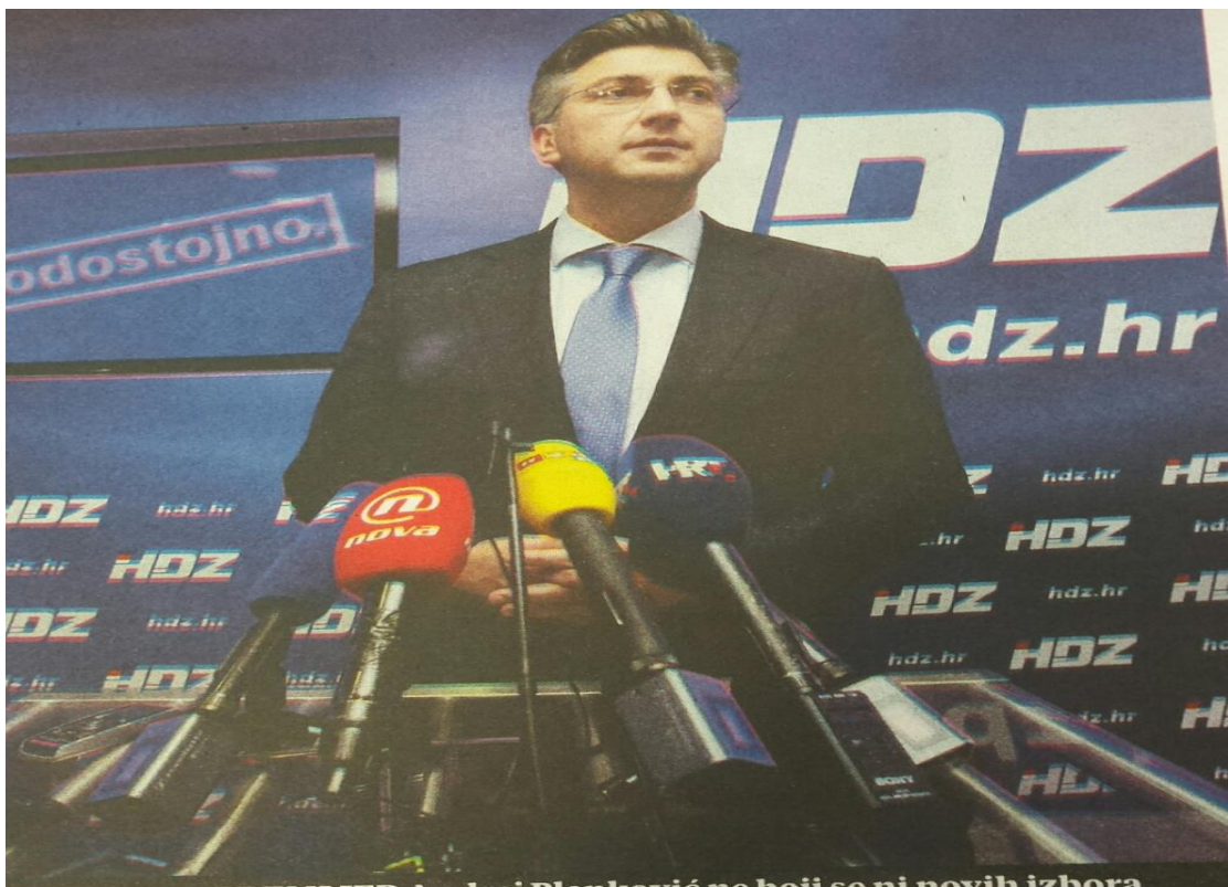
Slika 3.6. Tipična Plenkovićeve fotografija u Večernjem listu