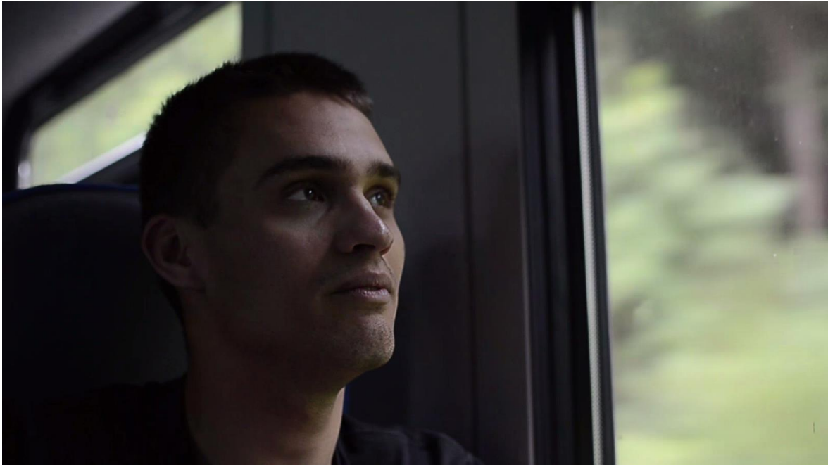
Slika 10 Treći dio razgovora, u vlaku

Krupni kadar u vlaku, akter u ovoj sceni odgovara na pitanja, tako da je trajanje također dugo, kamera je djelomično statična (ipak se snimalo bez stativa, ali je usredotočena na aktera).