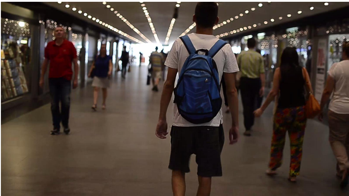
Slika 11 Dolazak u Zagreb

Krupni kadar u vlaku, akter u ovoj sceni odgovara na pitanja, tako da je trajanje također dugo, kamera je djelomično statična (ipak se snimalo bez stativa, ali je usredotočena na aktera).