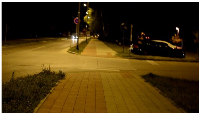
Slika 2 Ulica u Koprivnici

Koprivnica – najveći dio intervjua je sniman u iznajmljenoj kući u kojoj Fran stanuje dok studira u Koprivnici. Pošto je padala tek večer, a još je bilo toplo ljeto, odlučio sam da prvi dio snimamo na vanjskoj terasi, gdje sam se najviše morao baviti postavkama svjetline zbog toga što je kroz razgovor pala noć.