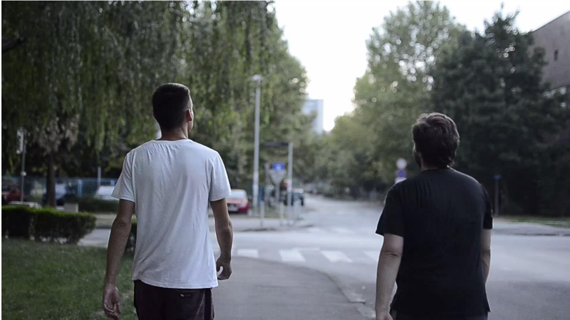
Slika 14 Hod po zagrebačkom kvartu

Dinamičan kadar hoda po zagrebačkom kvartu, uz polublizi plan na obojici subjekata scene. Kratko je trajanje kadra, a rakurs je također u razini pogleda.