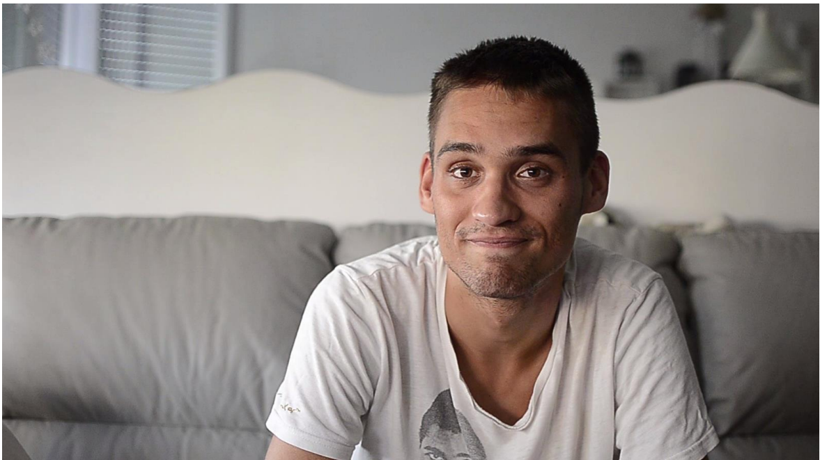
Slika 13 Treći dio razgovora, u stanu u Zagrebu

Srednji plan na akteru, kadar koji prikazuje stan i akterovo uobičajeno stanje tijekom bivanja u tom prostoru. Kamera je dinamična, a sam kadar kratko traje.