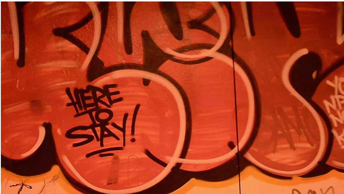
Slika 15 Kadar koji me inspirirao za naslov

Dinamičan kadar hoda po zagrebačkom kvartu, uz polublizi plan na obojici subjekata scene. Kratko je trajanje kadra, a rakurs je također u razini pogleda.