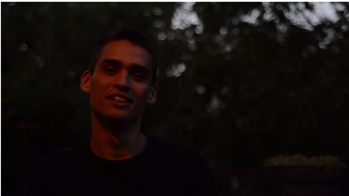
Slika 7 Prvi dio razgovora u Koprivnici, na terasi

Nakon početnog kadra, ovim sam htio uvesti u priču preko upoznavanja pozadine situacije studenta. Dinamični kadar koji prati aktera s leđa, srednje dužine, dovoljno da se može u cijelosti pročitati dodani tekst.