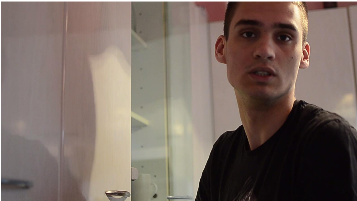
Slika 9 Drugi dio razgovora u Koprivnici, u kuhinji

Također krupni plan, a u ovom kadru je prikazan akterov hod iz profila. S kamerom u razini pogleda ovaj kadar je kratkog trajanja, a uprizoruje samotni hod po Koprivnici.