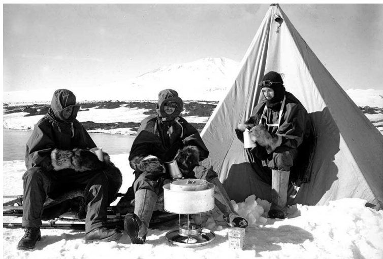
Slika 1 Članovi britanske ekspedicije predvođeni Robertom Falconom Scottom. Autor: Herbert Ponting

Ovako je Ante Peterlić opisao te rane početke dokumentarnog filma u svojoj knjizi Povijest filma: Rano i klasično razdoblje : „Iako film počinje kao čin divljenja zabilježbi pojavnoga svijeta, odnosno kao dokumentarni ili barem protodokumentarni, razvoj događanja u tom rodu dugo neće opravdavati slavu početka. Već u prvom desetljeću 20. stoljeća dokumentarni film potiskuje igrani film u nadiranju, a tako će biti tijekom čitave povijesti. Razlog povlačenja bio je, međutim, i u zadovoljnosti pukom registracijom, u neinventivnosti postupaka, ustrajavanju na temeljno činjeničnim filmovima i aktualitetima, a i u čestim krivotvorinama. Iznimno mjesto u drugom desetljeću zaslužuje jedino cjelovečernji britanski film S kapetanom Scottom na Južni pol (1913.) Herberta Pontinga, o tragičnoj ekspediciji kapetana Scotta. U tom je filmu primijenjena poslije često prakticirana metoda praćenja: filmska je ekipa slijedila Scottovu ekspediciju dok su god to dopuštali vremenski uvjeti.“ 1