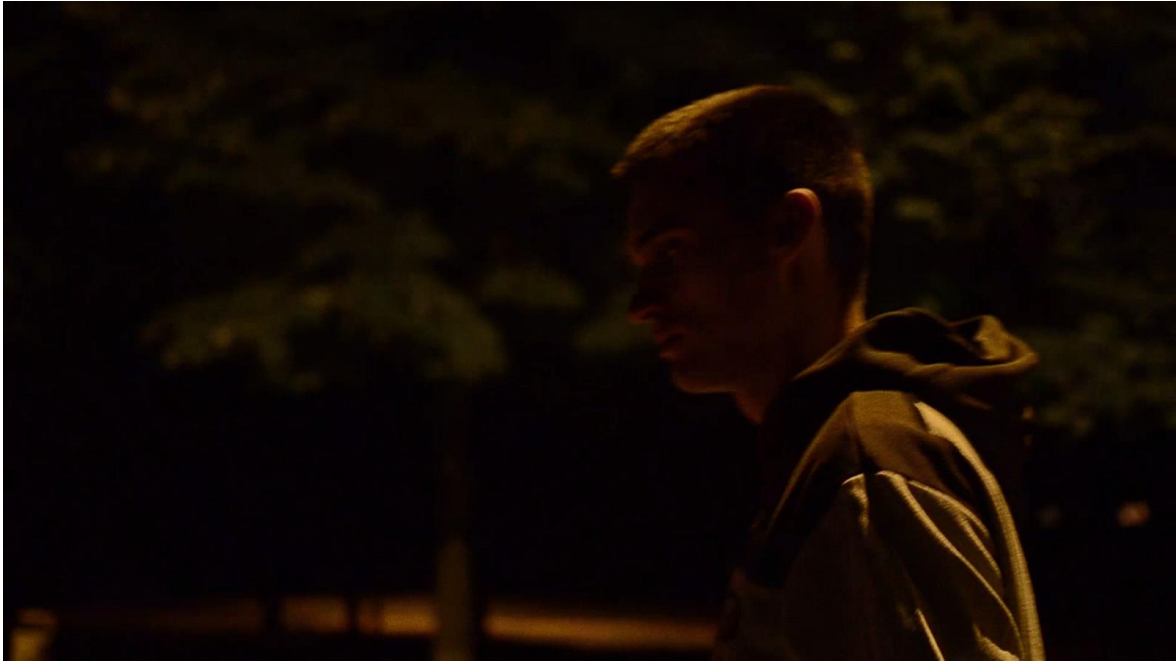
Slika 8 Samostalan hod po Koprivnici

Također krupni plan, a u ovom kadru je prikazan akterov hod iz profila. S kamerom u razini pogleda ovaj kadar je kratkog trajanja, a uprizoruje samotni hod po Koprivnici.