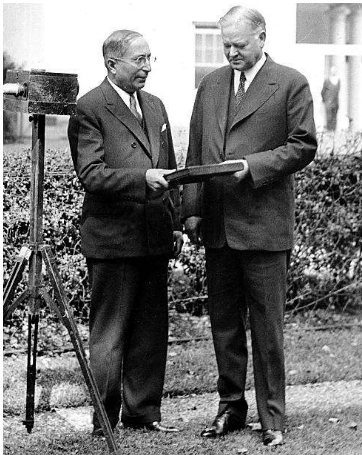
Slika 2.1. Mayer i predsjednik Hoover ispred MGM studija

oblikuje trajnu vezu između stranke krupnog kapitala (republikanaca) i filmske industrije koju je tada predstavljalo osam najvećih studija udruženih u kartel.