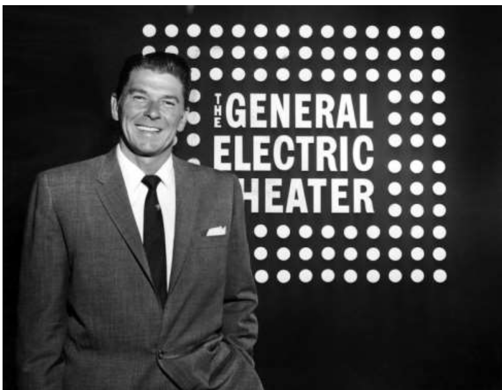
Slika 4.1. Ronald Reagan kao voditelj The General Electric Theatera

„Ronald Reagan, američki glumac i predsjednik Udruženja glumaca Amerike u aktivnu politiku ulazi nakon demobilizacije poslije Drugog svjetskog rata. Kao političar zalagao se za konzervativni pokret s novom vrstom vodstva, bolje opremljenim za novo – televizijsko doba, u kojem je slika kandidata jednako važna kao i njegove riječi i ideje. Tijekom pedesetih godina prošloga stoljeća Reagan koristi svoju slavu, šarm i komunikacijske vještine da bi pomogao u izgradnji konzervativnog pokreta, iako je tridesetih godina u Hollywood došao kao liberalni demokrat, ubrzo nakon svršetka Drugog svjetskog rata mijenja političku orijentaciju tvrdeći kako politiku New Deal-a vidi kao prijetnju temeljnim američkim vrijednostima.“ (Ross 2011:132). Ross smatra kako je Reaganova pozicija kao predsjednika Udruženja glumaca tijekom turbulentnih godina HUAC-ovih saslušanja učvrstila kod njega antikomunističke stavove, koji su ujedno postali osnovni element njegovog političkog vođenja Amerike.