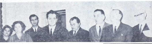
Slika 3: Varaždinske vijesti br. 1304 (10. 12. 1969.), str. 3. Izvor: