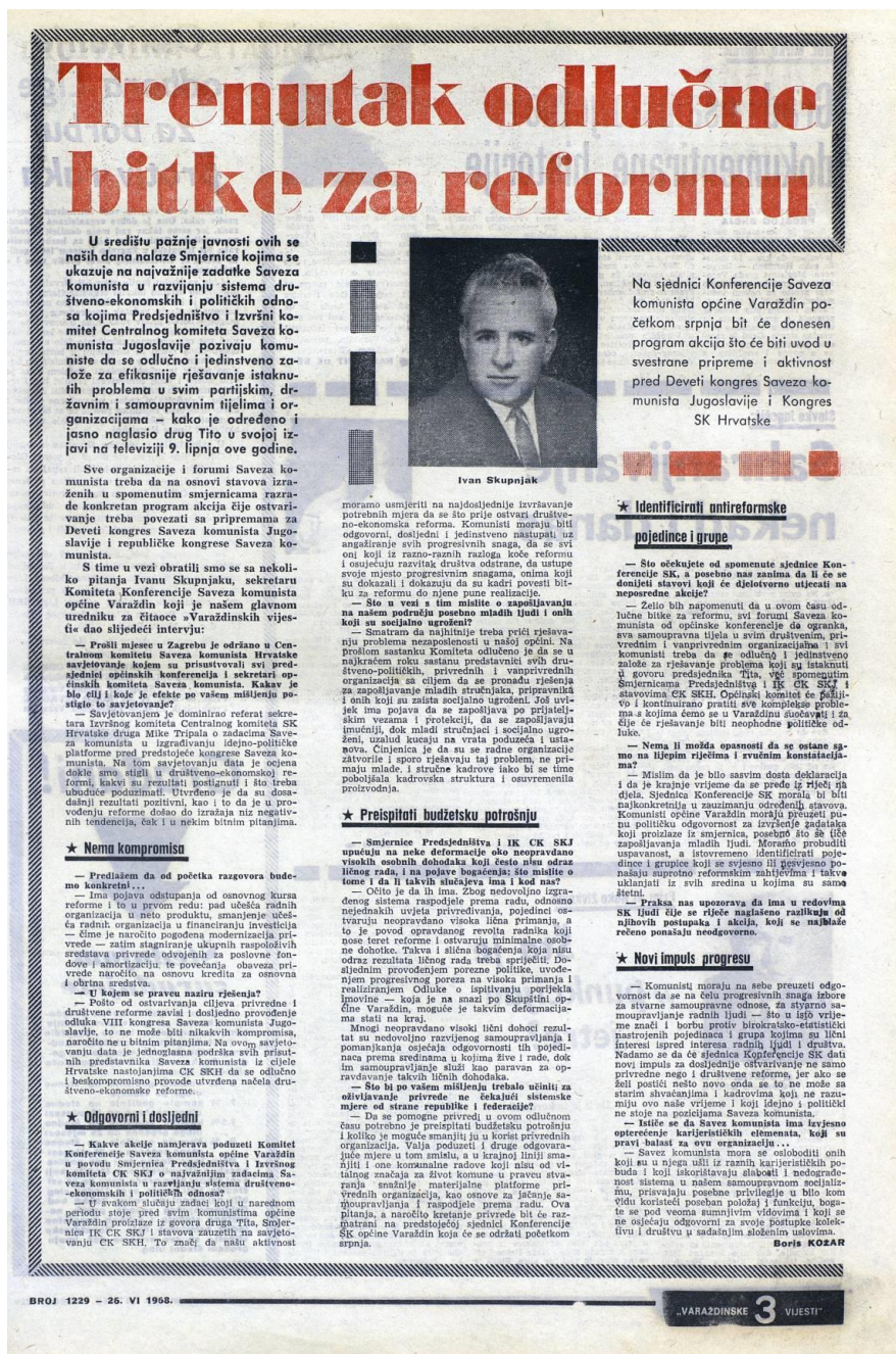
Slika 5: Varaždinske vijesti, br. 1229 (26. 6. 1968.), str. 3. Izvor:

http://library.foi.hr/novine/broj1.aspx?C=3&godina=1968&broj=000024&datum=1968-06-26&F=&H=&vrsta=&grupa=&lang=hr&stranica=001