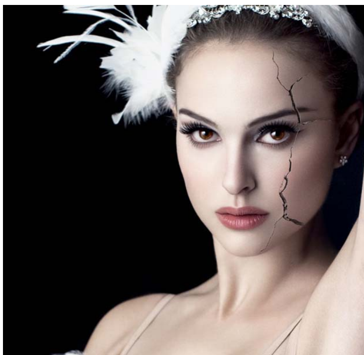
Slika 5.1 Balerina

Film Crni Labud ( Black Swan ) sadrži mnogo sličnosti sa prijašnjim filmom Darrena Aronofskog Hrvač ( The Wrestler ). Centrira se oko opsesije i fizičkog pakla jednog lika, koji ulaže cijelo svoje tijelo i duh u neku nedovoljno cijenjenu fizičku umjetnost. Crni Labud ( Black Swan ) se zapravo može smatrati modernom adaptacijom Labuđeg jezera, ali sa malo mračnijim pristupom. Lik Nine koji se pretvara u crnog labuda je oslobađanje njene unutarnje moći tj. dobivanje samopouzdanja. Također jedan bitan lajtmotiv u filmu su njene oči. U trenucima kada je Nina bijeli labud u očima se vidi strah i nesigurnost, ali kada se pretvori u crnog labuda oči se ispunjavaju krvlju i odmah uočavamo kako heroína dobiva snagu i samopouzdanje. „U trenutku u kojem se odvija transformacija u labuda ona više nije ovozemaljsko biće, nego se uzdiže prema nebeskom.“ (Rosanda Žigo i Tkalec 2016: 304)