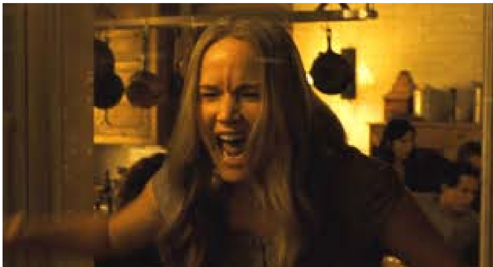
Slika 6.2 Ljutnja

( https://encrypted-tbn0.gstatic.com/images?q=tbn:ANd9GcTF06V01Xw1-WwyY3XzFm7lkkgCeZEzXAPEUKCHKXMEeKcyyNJA )