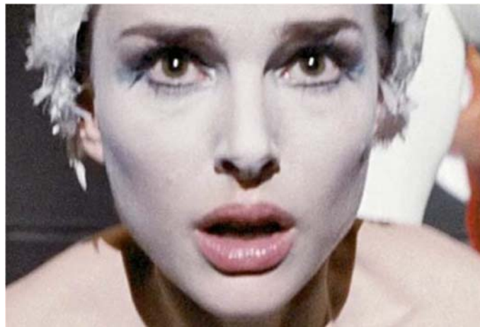
Slika 4.2 Bijeli labud

Nina dobije osobine i Crnog labuda. Priča se dalje vrti oko njezinih strahova neuspjeha, pritisaka, ljubomore, a niz čudnih i neshvatljivih događaja te navede na razmišljanje što se zapravo uopće događa. 2 Samu ideju za film Crni labud Aronofsky je imao još prije 15 godina, no tek ju je 2010. odlučio pretvoriti u filmsko djelo. Usporedio je ovaj film s poznatim Hrváčem , kojim je dokazao da se hrvanje i balet ne razlikuju u mnogočemu kada je odricanje u pitanju, iako su na prvi pogled kao dva različita svijeta. Iako na prvi pogled, balet nema nikakve veze s horor žanrom, u Crnom labudu imamo dvije prijateljice u kojima se budi rivalstvo, ali i želja da jedna drugu unište, a sve kako bi slava pripala upravo jednoj od njih. Ta crna želja za uništenjem suparnice, dotiče granice horor/trilera koji Crnog labuda ipak svrstava u horor žanr. 3