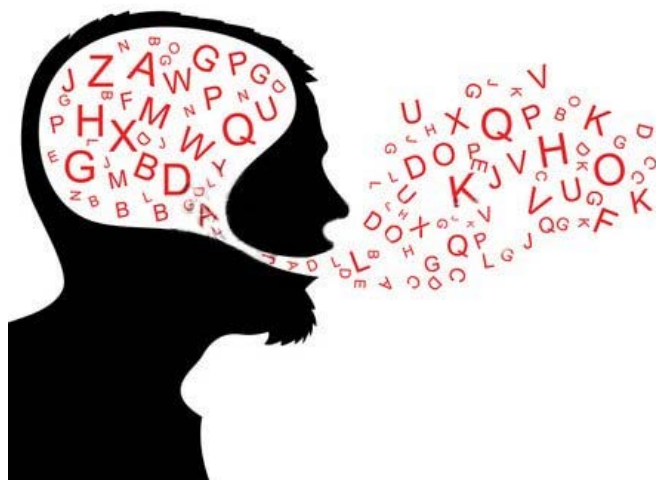
Slika 2.1 Naratologija

pojediniosti često izostavljene, recipijent se koristi shemama da bi nadoknadio te praznine. „Pojam sheme često se upotrebljava paralelno s pojmom okvir, pri čemu se referira na prikaz znanja relativno statičnih objekata i odnosa, nasuprot reprezentaciji dinamičnih, temporalnih procesa ili scenarija. Shodno tomu, scenariji proizvode očekivanja o tome kako će se određeni slijed događaja odvijati, dok sheme stvaraju očekivanja o mogućem načinu strukturiranja domene iskustva u određenom trenutku u vremenu. Kao prethodnika takvog tipa mišljenja, Herman (1997) navodi teze Dennisa Mercadala za kojega je scenarij opis očekivanoga načina na koji će se slijed događaja razvijati ili razmotati.“ (Kluiser Andrić 2017: 1-10) Scenarij je sličan okviru u smislu da predstavlja skup različitih očekivanja. Okvir se razlikuje od scenarija u smislu da odražava samo jednu točku u vremenu, dok scenarij prezentira događanje u vremenskom slijedu. Shema je pak termin rabljen u psihologiji, i referira se na memorijski uzorak koji ljudi upotrebljavaju za interpretaciju trenutačnih iskustava.