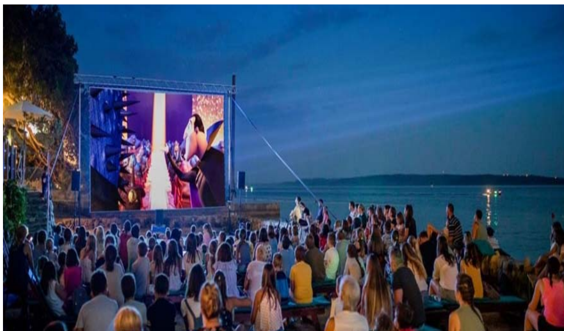
Slika 4.2 Reakcije gledatelja

opažaja prostorno-vremenskog sklopa u stvarnosti i skokovite naravi montažne prezentacije prostora i vremena u filmu, iz gestalt je perspektive potpuno shvatljivo zbog čega je gledatelj sposoban takve isječke filmskoga iskustva razumjeti kao cjelovite i povezane, odnosno, na koji način mu vlastiti kognitivni aparat omogućuje sklapanje cjeline prostora i kontinuiteta vremena u smisleni slijed slika.“ (Lučić 2017: 1892-1895)