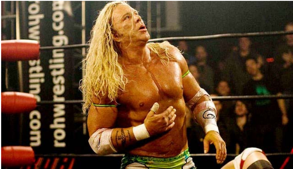
Slika 5.1 Hrváč