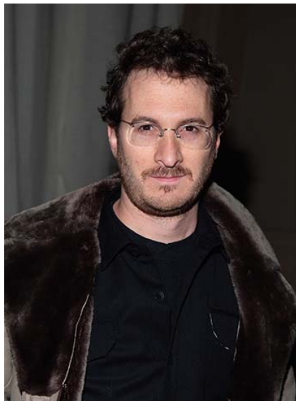
Slika 3.1 Aronofsky u mladosti

pozadini. Darren Aronofsky 1 u svojim filmovima koristi tehnike dijaloga i unutarnjeg monologa kako bi gledateljima omogućio dublje razumijevanje likova.