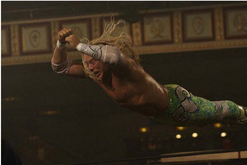
Slika 5.2 Skok

( https://mojtv.hr//images/e707903d-2275-43c8-8525-48c3cd9da2f3.jpg )