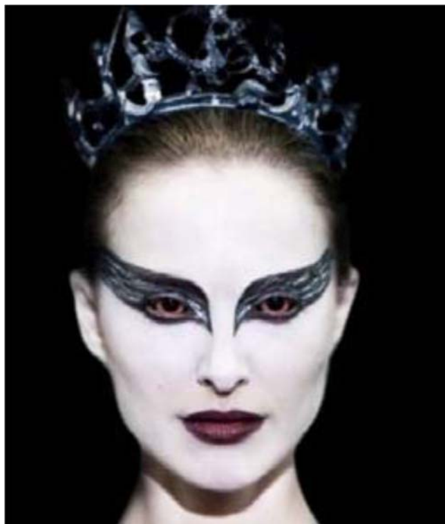
Slika 5.3 Crni labud