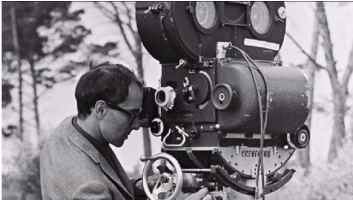
Slika 4.1 Redatelj

( http://www.ziher.hr/wp-content/uploads/2017/05/godard.jpg )