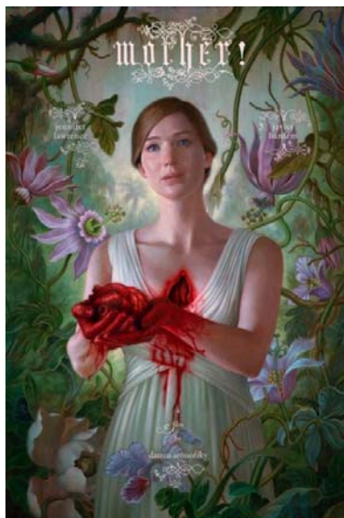
Slika 6.1 Majka

Mother ili Majka je najnoviji film Darrena Aronofskog koji je potpuno podijelio publiku. Velike zamjerke je dobio zato što je u trailerima predstavljen kao horor. Film sadrži mnogobrojne degutantne scene, ali ga definitivno ne bih svrstao među horore nove kinematografije. U filmu možemo primijetiti veliki utjecaj redateljeva osobnog utiska jer je prepun kršćanske simbolike u kojoj se pokušava interpretirati kreatora, koja je važan aspekt njegovog života. Još od svog filmskog prvijenca Pi , Darren Aronofsky se istovremeno iskazao kao filozof, istraživač različitih koncepcija izvora egzistencije te kao promatrač i vrli oponašatelj koncepta ljudske požude. Likovi u njegovih šest dosadašnjih radova vođeni su uglavnom nagonom za preživljavanje, ostavljanjem traga za sobom, iskazanim kroz dokazivanje svijetu, koje je u samoj biti dokazivanje sebi, odnosno svome egu. Implementiranjem teologije, filozofije i psihoanalitike u svoje radove, Aronofsky se doveo u nezahvalnu poziciju u kojoj su mišljenja publike i kritike konstantno u dijametralnoj opoziciji, sežući od stava da je u pitanju pretenciozni redatelj koji skriva svoju nesposobnost prisežući eksperimentalnom pristupu do stavova da je on posljednji istinski redatelj koji tvori umjetnost zbog nje same. 7