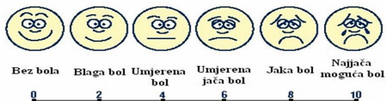
Skala za određivanje jačine bola