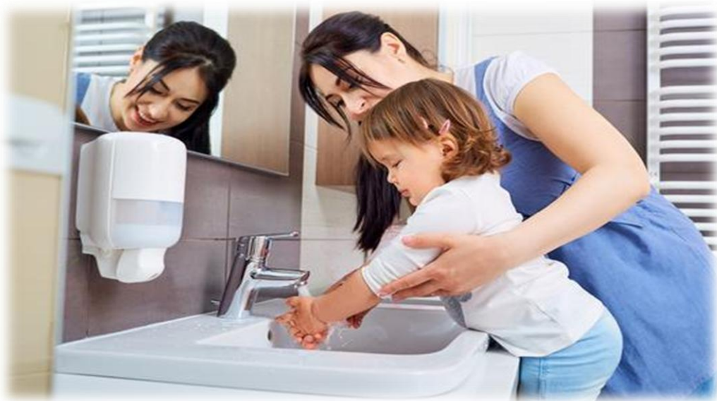
Slika 6.1. Pranje ruku kod male djece

Prevencija akutnih poremećaja prehrane infektivnog oblika moguća je ranom edukacijom opće populacije, edukacijom djece o važnosti pranja ruku. Rana edukacija djece započinje već u vrtićkoj, predškolskoj i školskoj dobi gdje medicinska sestra kao zdravstveni voditelj takvih ustanova uči djecu o važnosti higijene, koja je najbitnija stavka u prevenciji. Zašto je važno usvojiti naviku pravilnog pranja ruku? Jer je to vrlo učinkovita mjera brige o vlastitom zdravlju. Pranje ruku jeftin je i djelotvoran postupak kojim se štitimo od bolesti, te dobar način u prevenciji širenja zaraznih bolesti. Redovito i pravilno pranje ruku dijete treba usvojiti kao naviku već u ranom djetinjstvu. U čemu veliku ulogu ima medicinska sestra u vrtićima. Pranje ruku je najvažniji postupak te je njezina zadaća naučiti djecu pravilnom pranju ruku i kada je obavezno oprati ruke. Također bitna je i pravilna priprema hrane, hrana mora biti pravilno i dovoljno termički obrađena (meso, jaja, mliječni proizvodi). Slika 6.1