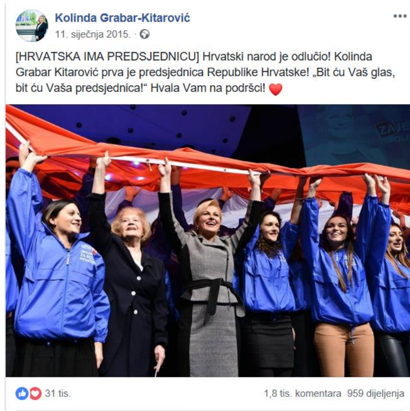
Slika 8: Zahvala predsjednice na podršci, izvor:

Uspješnom i vrlo skupom izbornom kampanjom, Kolinda Grabar-Kitarović pobijedila je na izborima za predsjednika, te tako postala prva ženska predsjednica Republike Hrvatske u povijesti te zemlje. Nakon emotivnog nastupa u medijima koji su uživo prenosili stanje iz stožera kandidata, objavom na Facebooku se predsjednica Republike Hrvatske zahvalila svima na podršci te obećala da će biti prije svega predsjednica građana.