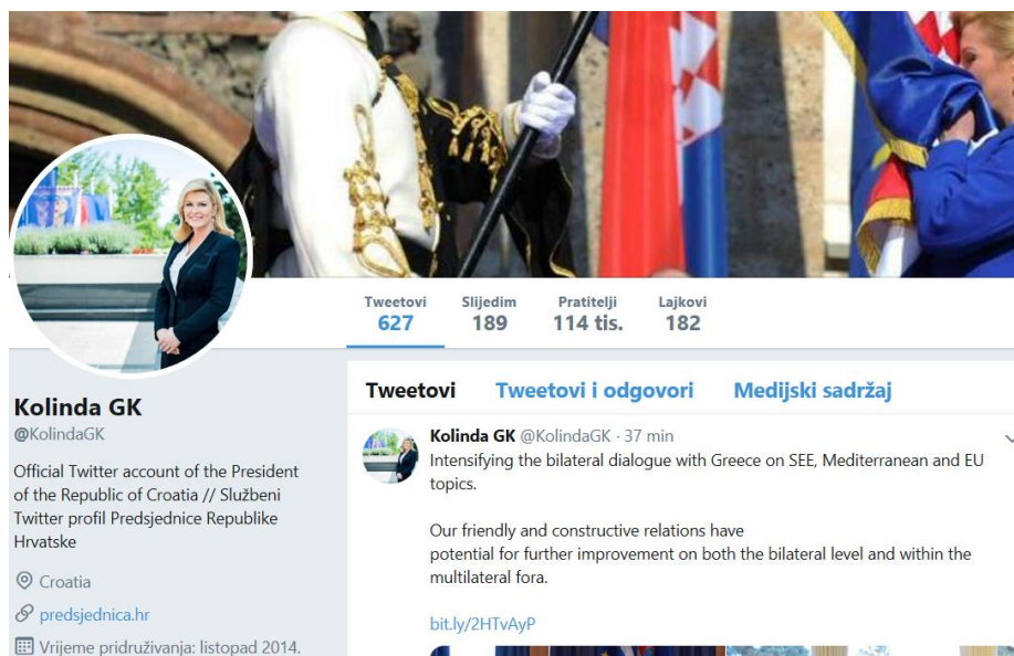
Slika 5: Službena Twitter stranica Kolinde Grabar-Kitarović, izvor: https://twitter.com/KolindaGK , dostupno na dan 04.02.2019.

Na društvenoj stranici Facebook, službena stranica Kolinde Grabar-Kitarović ima oznaku da se 750.792 osobe sviđa ova stranica. Njezina popularnost je puno veća nego na Twitteru, što je i razumljivo s obzirom na to da puno veći broj ljudi ima kreiran profil na Facebooku, nego na Twitteru. Od najave kandidature pa sve do dana izbora, na Facebooku je objavljeno 132 objave vezane uz izbornu kampanju. Sve objave su uz tekstualno objašnjenje imale priložene slike. Službeni početak kampanje je započela u svojem rodnom mjestu Grobnik te su građani mogli pratiti njezine snimke na Kolinda TV. Strategijom izborne kampanje odlučilo se koristiti i Internet TV-om u političkoj promidžbi, što je znatno lakši i jeftiniji način u odnosu na emitiranje na klasičnoj televiziji. 47 Izborna kampanja se temeljila na približavanju običnim građanima te je glavna krilatica bila „ljudi su moja snaga“. Kroz većinu objava na društvenim mrežama pokušalo se ciljanoj javnosti približiti kroz majčinski nastup Kolinde Grabar-Kitarović, kao osobe koja je empatična, pristupačna, druželjubljiva. Prema povratnim informacijama javnosti, izborni tim je uočio da ljudi vrlo dobro reagiraju prema empatičnosti kandidatkinje, određenim objavama se pokušalo intenzivnije prikazati Kolindu kao osobu od povjerenja, kao osobu koja je došla iz naroda i radit će sve za svoje građane.