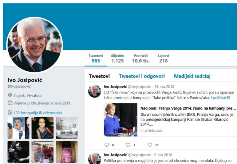
Slika 2: Ivo Josipović, Twitter, izvor: https://twitter.com/ivojosipovic , dostupno na dan 04.02.2019.

Ivo Josipović je nakon tri godine neaktivnosti na Twitteru započeo s komunikacijom. Twitteru se pridružio u srpnju 2009. godine. Predizborna kampanja započela je 25. studenog 2014. godine. Trenutno Josipovića prati 10,6 tisuća ljudi te je do sada objavio 965 tweetova.