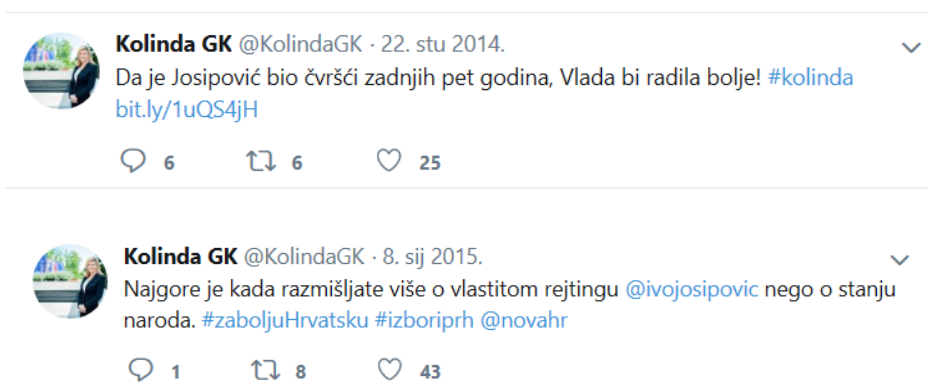
Slika 7: Primjer diskreditiranja protukandidata

Prateći komentare na objave, moglo se zaključiti da su građani pisali poruke potpore kandidaturi. Nakon prvog izbornog kruga, njezin tim odnosa s javnošću je odlučio zaoštriti natjecanje i stvoriti snažne emocije kod ljudi na način da je kandidatkinja posjetila umirovljenog generala Ante Gotovinu u njegovom domu. Taj posjet je u javnosti koja je već tada imala vrlo veliku naklonost, stvorio još veći odjek. S druge strane, manja skupina ciljane javnosti je taj potez smatrala previše napadnim. Nakon objave pobjede kandidatkinje, predsjednica se zahvalila na Facebooku svojim glasačima te je na temelju toga bilo 15.000 klikova ljudi da im se sviđa, 811 komentara te 267 podjela te objave. Uspoređujući navedene društvene mreže, dolazi se do zaključka da su na Twitteru objave bile ozbiljnije i političke, dok se na Facebooku pokušalo što više približiti građanima stvaranjem pozitivnih emocija i empatije. Također, na Twitteru se moglo pročitati više oštrih odgovora kao reakcije na podbadaња konkurencije. Na slici se mogu kao primjer vidjeti dvije objave na službenom Twitter profilu kojima se želi prikazati tadašnjeg predsjednika kao osobu koja nije čvrst vođa te kao osobu koja je sebična pa više misli na svoju dobrobit i osvajanje kandidature nego što bi trebao misliti na narod, a termin objave 8. siječnja 2015. godine ukazuje na posljednje pokušaje prikazivanja protukandidata kao lošijega od sebe.