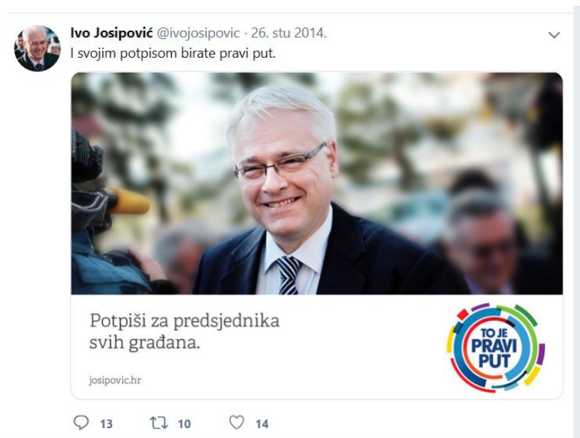
Slika 3: Službeni početak kampanje na Twitteru, izvor: https://twitter.com/ivojosipovic , dostupno na dan 04.02.2019.