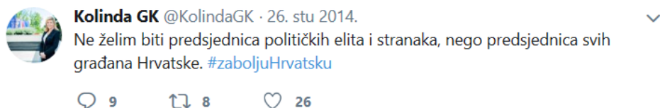
Slika 6: Objave s Kolindine službene Twitter stranice kao primjer, izvor:

https://twitter.com/KolindaGK , dostupno na dan 04.02.2019.