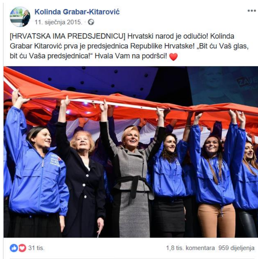
Slika 8: Zahvala predsjednice na podršci, izvor:

Uspješnom i vrlo skupom izbornom kampanjom, Kolinda Grabar-Kitarović pobijedila je na izborima za predsjednika, te tako postala prva ženska predsjednica Republike Hrvatske u povijesti te zemlje. Nakon emotivnog nastupa u medijima koji su uživo prenosili stanje iz stožera kandidata, objavom na Facebooku se predsjednica Republike Hrvatske zahvalila svima na podršci te obećala da će biti prije svega predsjednica građana.