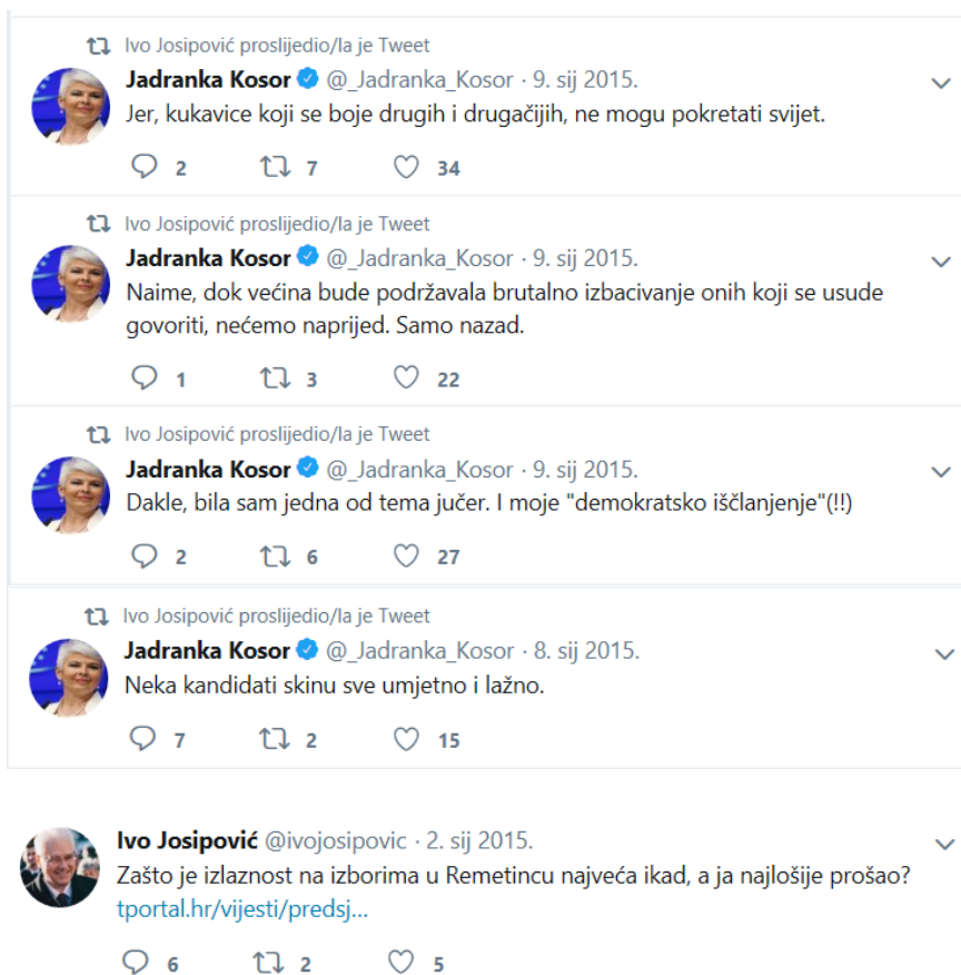
Slika 4: Josipovićeve objave kao „podbadanje“, izvor: https://twitter.com/ivojosipovic , dostupno na dan 04.02.2019.