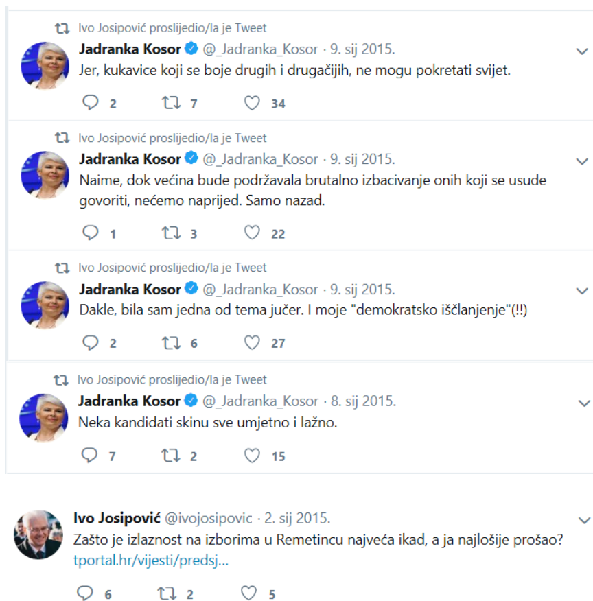
Slika 4: Josipovićeve objave kao „podbadanje“, izvor: https://twitter.com/ivojosipovic , dostupno na dan 04.02.2019.