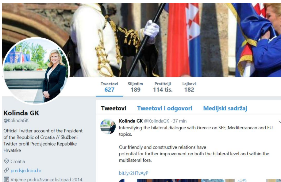
Slika 5: Službena Twitter stranica Kolinde Grabar-Kitarović, izvor: https://twitter.com/KolindaGK , dostupno na dan 04.02.2019.

Na društvenoj stranici Facebook, službena stranica Kolinde Grabar-Kitarović ima oznaku da se 750.792 osobe sviđa ova stranica. Njezina popularnost je puno veća nego na Twitteru, što je i razumljivo s obzirom na to da puno veći broj ljudi ima kreiran profil na Facebooku, nego na Twitteru. Od najave kandidature pa sve do dana izbora, na Facebooku je objavljeno 132 objave vezane uz izbornu kampanju. Sve objave su uz tekstualno objašnjenje imale priložene slike. Službeni početak kampanje je započela u svojem rodnom mjestu Grobnik te su građani mogli pratiti njezine snimke na Kolinda TV. Strategijom izborne kampanje odlučilo se koristiti i Internet TV-om u političkoj promidžbi, što je znatno lakši i jeftiniji način u odnosu na emitiranje na klasičnoj televiziji. 47 Izborna kampanja se temeljila na približavanju običnim građanima te je glavna krilatica bila „ljudi su moja snaga“. Kroz većinu objava na društvenim mrežama pokušalo se ciljanoj javnosti približiti kroz majčinski nastup Kolinde Grabar-Kitarović, kao osobe koja je empatična, pristupačna, druželjubljiva. Prema povratnim informacijama javnosti, izborni tim je uočio da ljudi vrlo dobro reagiraju prema empatičnosti kandidatkinje, određenim objavama se pokušalo intenzivnije prikazati Kolindu kao osobu od povjerenja, kao osobu koja je došla iz naroda i radit će sve za svoje građane.