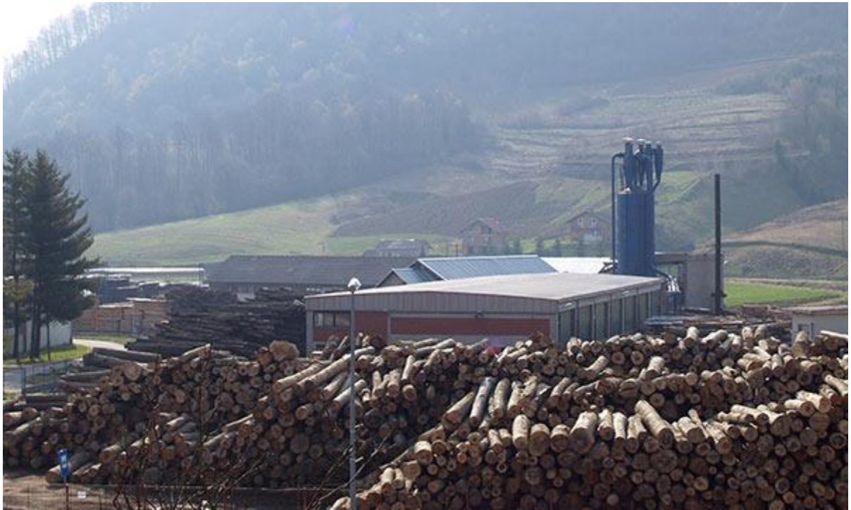
Slika 1 Skladište trupaca pilana Bednja