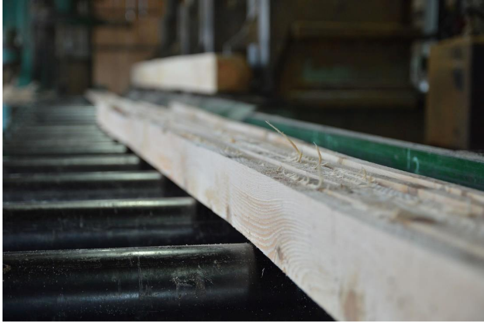
Slika 20. Piljenje rezane građe u manje dijelove