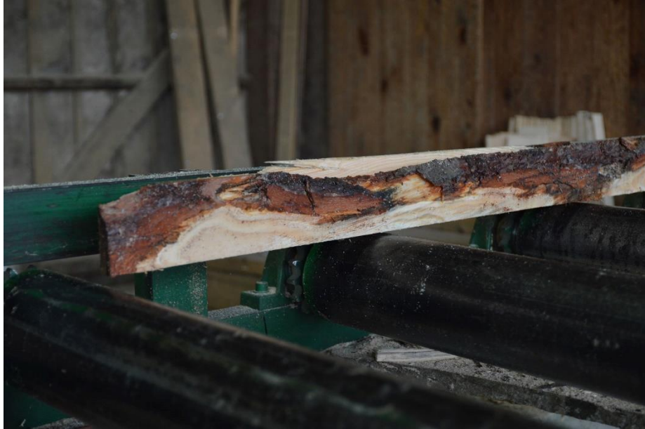
Slika 18. Piljenje trupaca u prvoj fazi

Trupci se tada režu, tj. pile pomoću mehaničkih pila. Trupac se rastavlja na više dijelova u neobrađenu piljenu građu, te se dalje obrađuje, tj. pili na sitnije dijelove, određene dimenzije, kao što prikazuju „Slika 18.“, „Slika 19.“ i „Slika 20. – vidi str.38)“.