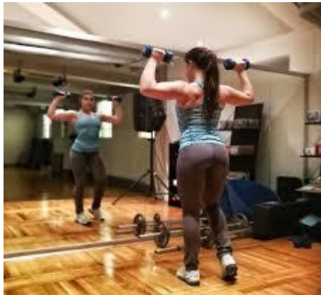
Slika 8.7.1. Trening