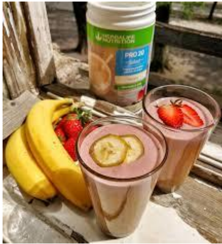
Slika 8.7.5. Mariina prehrana danas