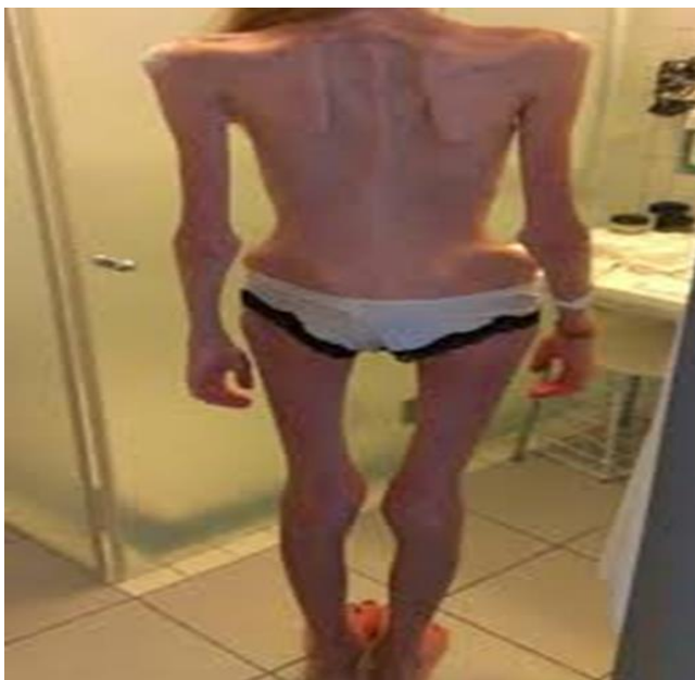
Slika 8.4.3. Izgled tijela sa 16 godina

Znala sam da sam jednom nogom u grobu i ja sam osjetila, ali stvarno, da mi je to zadnji dan. Nisam se uopće bojala. To sam očekivala, željela, bila sam sretna što je došao kraj. Vjerovala sam da za mene nema šanse, da je to nemoguće.“