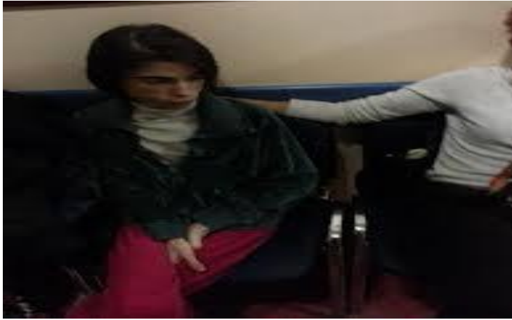
Slika 8.4.2. Psihoterapija