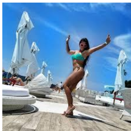
Slika 8.7.4. Izgled Mariina tijela danas