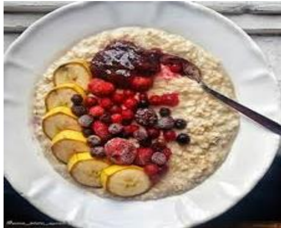
Slika 8.7.6. Zobene pahuljice s voćem