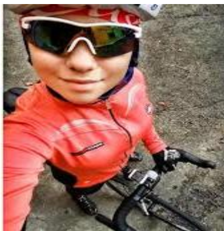
Slika 8.7.3. Bicikliranje