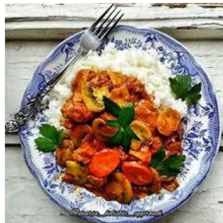
Slika 8.7.8. Rižoto