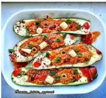
Slika 8.7.7. Veganska prehrana