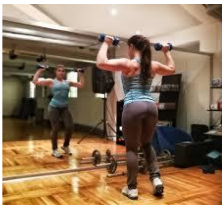
Slika 8.7.1. Trening