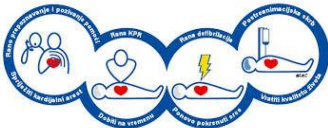
Slika 3.5.1. Lanac preživljavanja

Post reanimacijska skrb važna je faza u povratku spontane cirkulacije, normalne moždane funkcije te stabilnog srčanog ritma. Proces post reanimacijske skrbi uključuje primjereni nadzor nad bolesnikom, bezbrižan transport u jedinice intenzivnog liječenja i nastavak liječenja organskih sustava te ima važan utjecaj na ishod bolesnika [17].