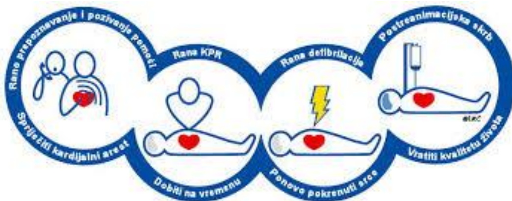
Slika 3.5.1. Lanac preživljavanja

Post reanimacijska skrb važna je faza u povratku spontane cirkulacije, normalne moždane funkcije te stabilnog srčanog ritma. Proces post reanimacijske skrbi uključuje primjereni nadzor nad bolesnikom, bezbrižan transport u jedinice intenzivnog liječenja i nastavak liječenja organskih sustava te ima važan utjecaj na ishod bolesnika [17].