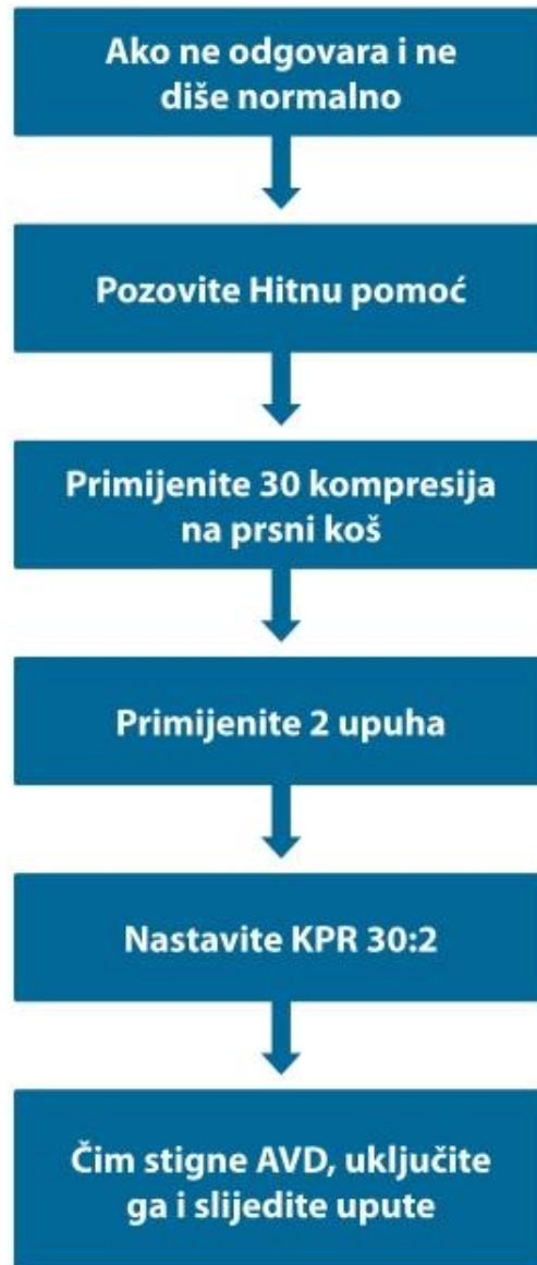
Slika 4.1.1. Prikaz BLS-a uz uporabu AVD-a