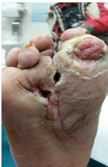
Slika 8.1.1. Početak zbrinjavanja kronične rane