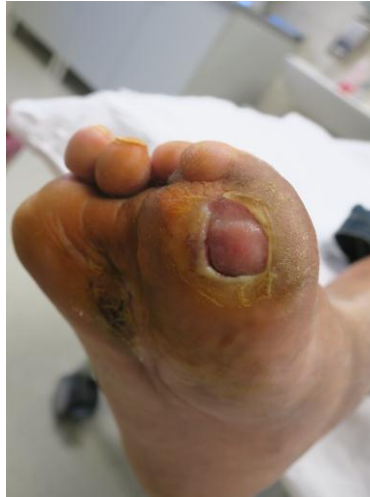
Slika 8.1.3. Prikaz kronične rane nakon šezdeset HBOT