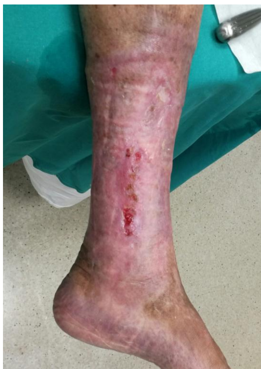
Slika 8.2.2. Prikaz kronične rane nakon pedeset tretmana hiperbaričnim kisikom