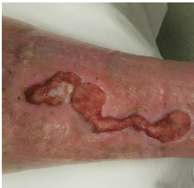
Slika 8.2.1. Prikaz kronične rane na početku liječenja