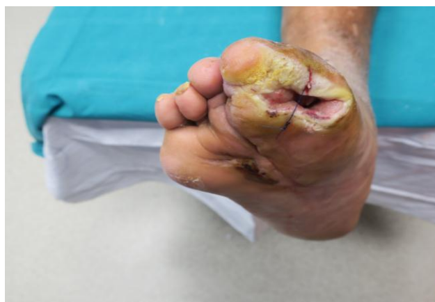
Slika 8.1.2. Postavljanje privremenog šava