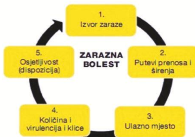
Slika 3.1.1. Vogralikov lanac infekcije