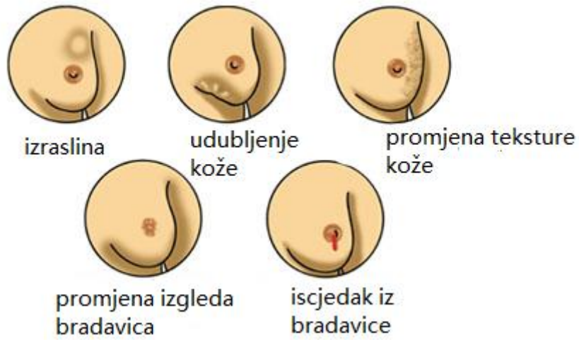
Slika 4.1 Simptomi raka dojke