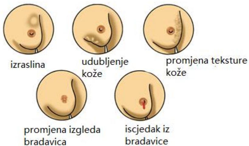
Slika 4.1 Simptomi raka dojke