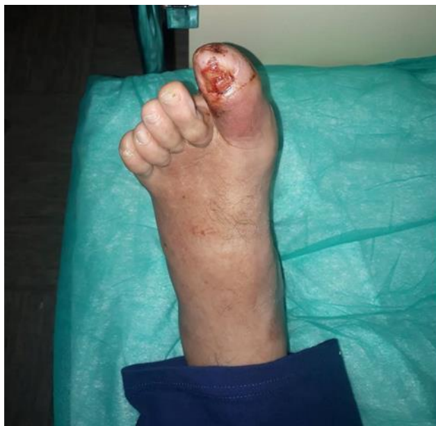
Slika 3.3.1.1. Neurotrofični ulkus

gangrene stopala. Ishemijsko oštećenje tkiva je predisponirajući faktor ulkusne lezije. Kod neurotrofičnog i ishemičnog ulkusa često dolazi do infekcije koja se suzbija odgovarajućim antibiotikom. Neprepoznavanje infekcije predstavlja neposrednu opasnost za gangrenu stopala koja se može razviti u samo nekoliko sati. Javljanje liječniku dolazi neposredno nakon boli u listu što upućuje na suženje ili začepljenje krvne žile što rezultira pojavom boli. Posebnu pozornost treba obratiti na "kuckanje u stopalu", otekline, bol, ranice ili mjehuriće, promjene na noktima ili dijelovima stopala. [10].