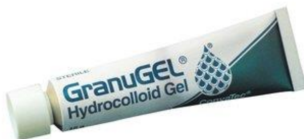
Slika 6.2.2. Hidrokolid – granugel