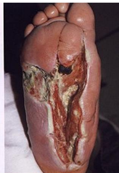
Slika 6.1.2.1. Dijabetička angiopatija i polineuropatija Multiple nekroze sa dubokim celulitisom Opsežne incizije + nekrektomije + antibiotičko liječenje