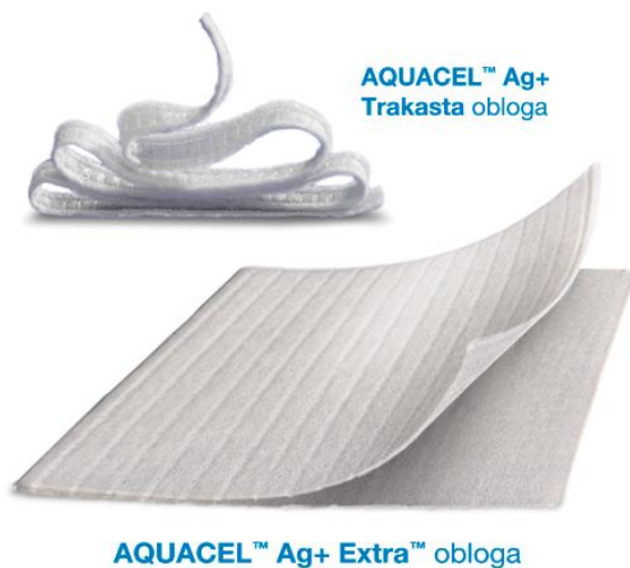
Slika 6.2.1. Alginatna obloga – Aquacel Ag Extra