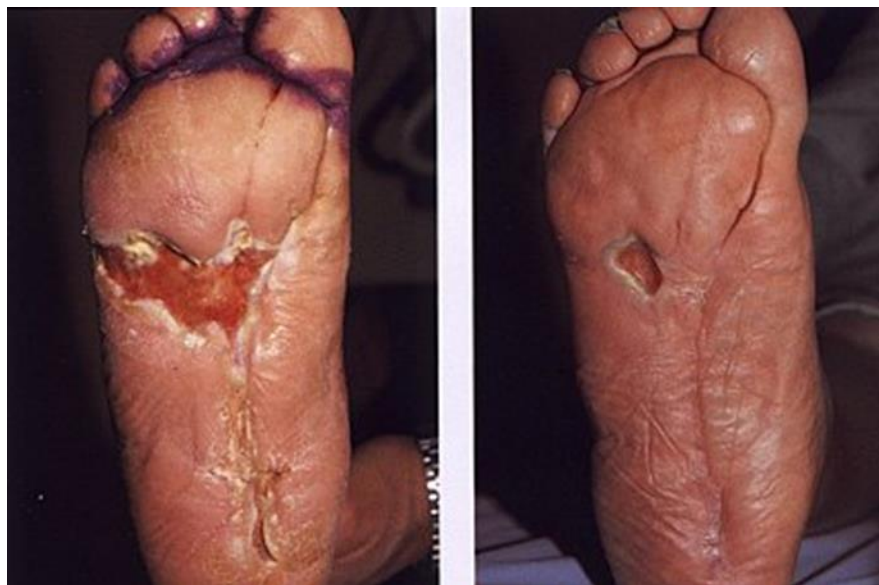
Slika 6.1.2.2. Rezultat nakon 4 mjeseca (Izvor: iz prezentacije "Dijabetičko stopalo", autor Dino Štrlek, dr. med)