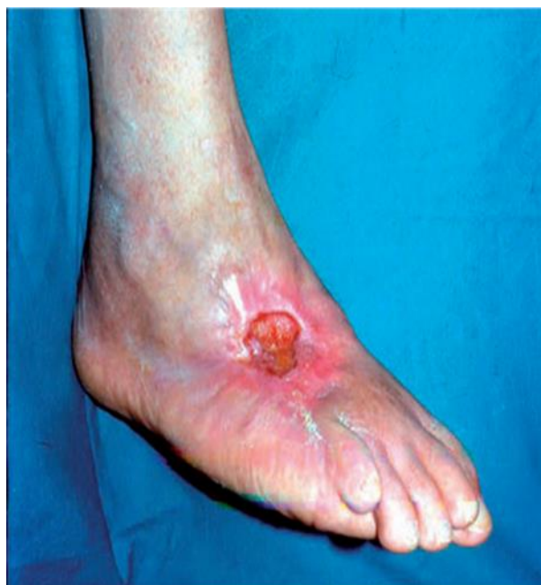
Slika 3.3.1.2. Ishemični ulkus