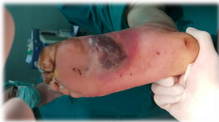
Slika 6.3.1.1. Stopalo prije primjene V.A.C. terapije (Izvor: iz prezentacije "Dijabeičko stopalo", autor Dino Štrlek, dr. med)