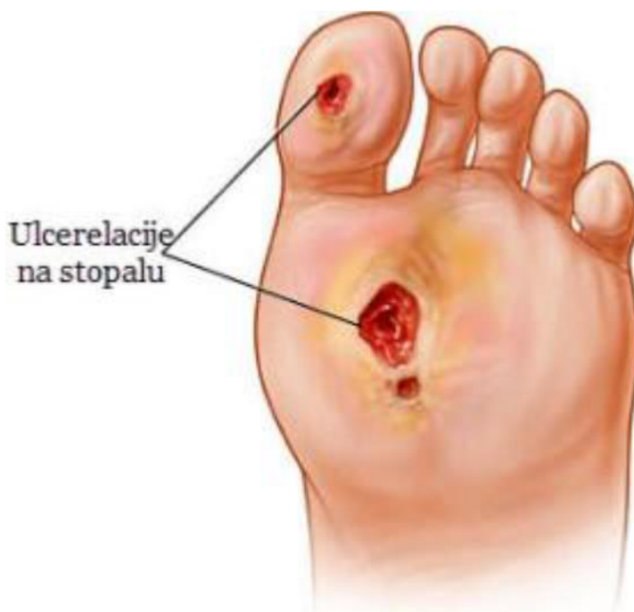
Slika 3.3.1. Ulceracije na stopalu

Kaskadu sindroma dijabetičkog stopala predstavlja dijabetički ulkus koji je ujedno i kritični i centralni događaj ovog sindroma. Stoga "No ulcer, no amputation" . Rizični čimbenici za ulceraciju se dijele na opće i specifične. U opće se ubrajaju dob, pretilost, slabovidnost, spol, rasa, loša obuća i samački život. Specifične čimbenike čine: biomehanička disfunkcija, traume, periferna neuropatija, periferna vaskularna bolest, ranije amputacije i ulceracije, dijabetička nefropatija, dugotrajnost šećerne bolesti, abnormalnost neutrofila, loša kontrola glikemije i vrijednosti HbA1c. Uz opće i specifične rizične čimbenike čest je pojedinačni uzrok ulceracija na stopalu. Najčešće je rezultat različitih kombinacija velikog broja rizičnih čimbenika. S obzirom da je glavni događaj sindroma dijabetičkog stopala nastanak dijabetičkog ulkusa, prevencija je od iznimnog značenja, a glavni cilj terapije je zatvoriti ranu stopala što je moguće ekspeditivnije, a rezolucijom ulkusa i smanjenjem ponovnog javljanja će se bitno produljiti životni vijek visoko rizičnog stopala i poboljšati ukupna kvaliteta života oboljelog od dijabetesa [8].