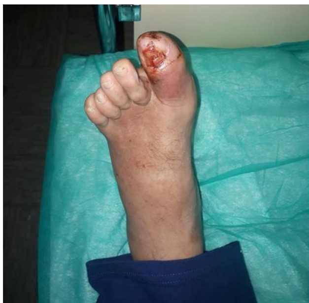
Slika 3.3.1.1. Neurotrofični ulkus

gangrene stopala. Ishemijsko oštećenje tkiva je predisponirajući faktor ulkusne lezije. Kod neurotrofičnog i ishemičnog ulkusa često dolazi do infekcije koja se suzbija odgovarajućim antibiotikom. Neprepoznavanje infekcije predstavlja neposrednu opasnost za gangrenu stopala koja se može razviti u samo nekoliko sati. Javljanje liječniku dolazi neposredno nakon boli u listu što upućuje na suženje ili začepljenje krvne žile što rezultira pojavom boli. Posebnu pozornost treba obratiti na "kuckanje u stopalu", otekline, bol, ranice ili mjehuriće, promjene na noktima ili dijelovima stopala. [10].