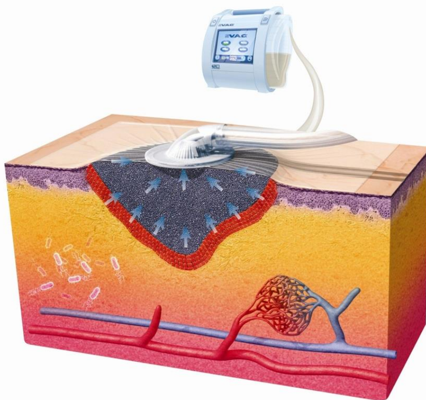
Slika 6.3.1. Mehanizam V.A.C. terapije

Ciljevi u liječenju V.A.C. – om su poboljšanje tkivne perfuzije, stvaranje neoangiogeneze, stimuliranje granulacijskog tkiva, smanjenje edema, odstranjenje viška eksudata što dovodi do kontrakcije rane [19].