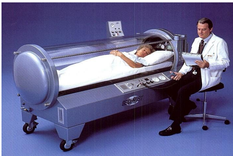
Slika 2.1. Jednosmjesna komora

Jednomjesne komore se danas koriste najčešće u terapiji. Pacijent u jednomjesnim komorama udiše komprimirani čisti kisik (slika 2.1.). Jednomjesne komore imaju svoje prednosti i nedostatke. Prednosti jednomjesnih komora su: rad s pacijentom je pojedinačan, idealne su za intenzivno liječenje, maska za lice nije potrebna (nema opasnosti od curenja kisika), idealna za pacijente vezane za postelju u akutnom stadiju ili zbog ozljede, lako nadziranje pacijenta, ekonomičnost prostora i troškova, potrebno manje osoblja za rukovanje. S druge strane, glavni nedostatak jest opasnost od požara u okruženju s visokom koncentracijom kisika [3,4].